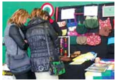
Eskaintza zabala azoka sozialean.