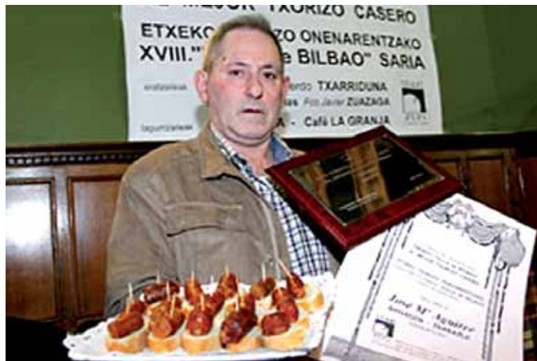
Agirrek saritutako txorizoengatik oroigarria jaso zuen Bilbon.

Epaimahaiak ere bost finalistak izendatu zituen eta horien arte-