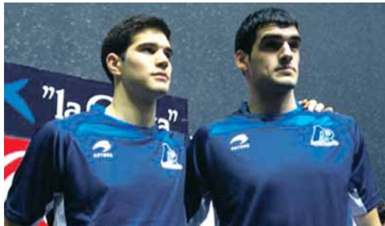
Ezkurdia-Zabaletak ez dute amore eman eta irabaztera aterako dira.

Tolosan jokatu zuten pilota partida modu orekatuan hasi zuten bi bikoek eta partida oso gogorra eta