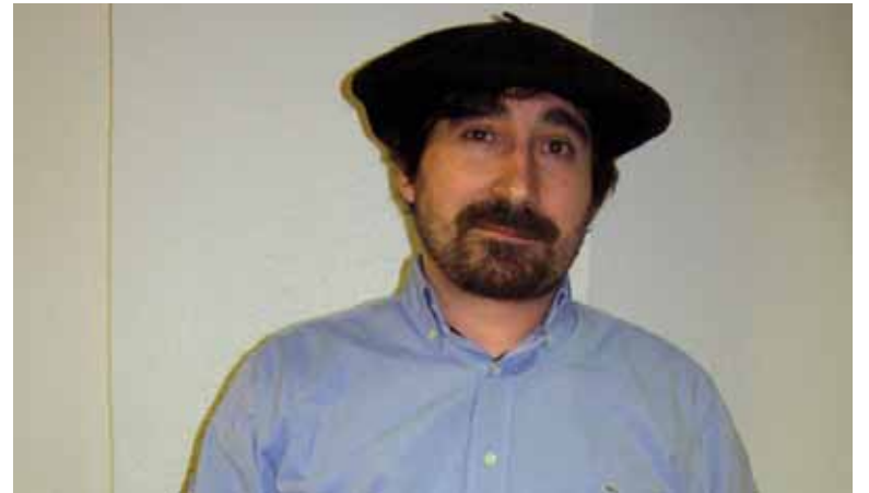
Hitz jokoan zale, Barrerok Arrasaten palindromo lehiaketa irabazi du.

Olatziarrak bere denbora libre hartzen du hitz jokoetan aritzeko. Papera eta boligrafoa eskutan hartu eta hitzekin jokatzeari ekiten dio.