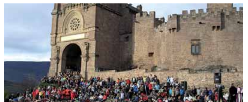
Xabierko gaztelua, atzera ere, erromesen bilgune izanen da.

dean izanen da. Gurutze-bidea 8:00etan abiatuko da Zangoatik eta 10:00etan izanen da meza Xabierraren. Aurtengo berritasuna bihar 17:00etan Xabierraren bertan erromesei egiten zaien harrera meza da. Bigarren Xabierraldia, martxoaren 15ean izanen da. Zangoatik gurutze-bidea 15:00etan abiatuko da eta 17:00etan izanen da meza. Bitartean eta Graziaren