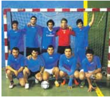
Bunker finalerdietarako saillkatu da.

1. Racing San Migel 34 puntu 2. Auzomotojorik 25 puntu 3. Arbizu 9 puntu 4. Etxarriko Gaztetxie 3 puntu 5. Biltoki 12 puntu 6. Iturmendi 9 puntu 7. Bunker 9 puntu