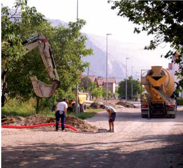
Makinak eta langileak, atzera ere, bueltan izanen dira Itxesi auzoan.