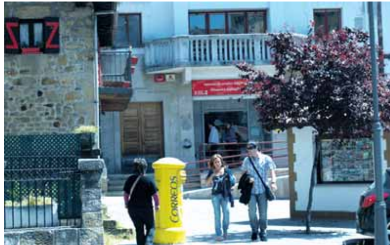
Prestakuntza eskaintzen berri bulegoan edo www.empleo.navarra.es orrian.

Gutxieneko baldintzak ez dituztenek funtsezko kompetentzia batzuk badakizkitela erakutsi behar dute. Hau da, gaztelania eta matematika ikastaroak egin behar dituzte. Horiek gainditu ondoren 2. mailako kompetentziak