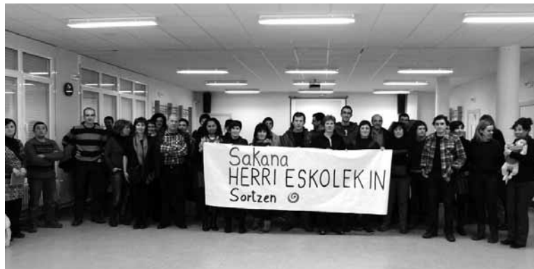
Sakanako herri eskoletako ordezkariak ostiralean bildu ziren.

Bat ez beste, Sakanako ikastetxe publikoetako Guraso Elkarte guztiak Sortzen elkarteko kide dira. Guztien artean maiatzaren 10erako ibarreko eskolen festa antolatzen ari dira. Laugarren edizioaren ardura Zelandi eskola publikoak izanen du. Foru plaza eta inguruak hartuko dituen egun osoko egitaraua prestatzen ari dira. Batasunaren eta elkarreraginaren ideia bulkatzeko Sakanako Herri Eskolekin Sortzen leloa