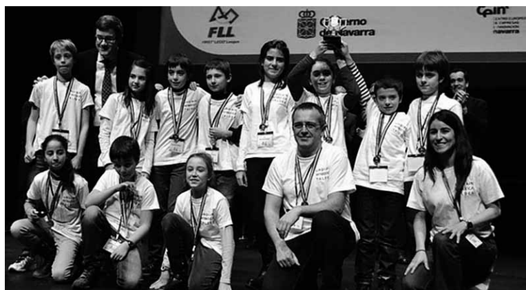
Urdiaindarrak sariekin. Guaixe.net-eko komunitatean azaldu dute esperientzia.