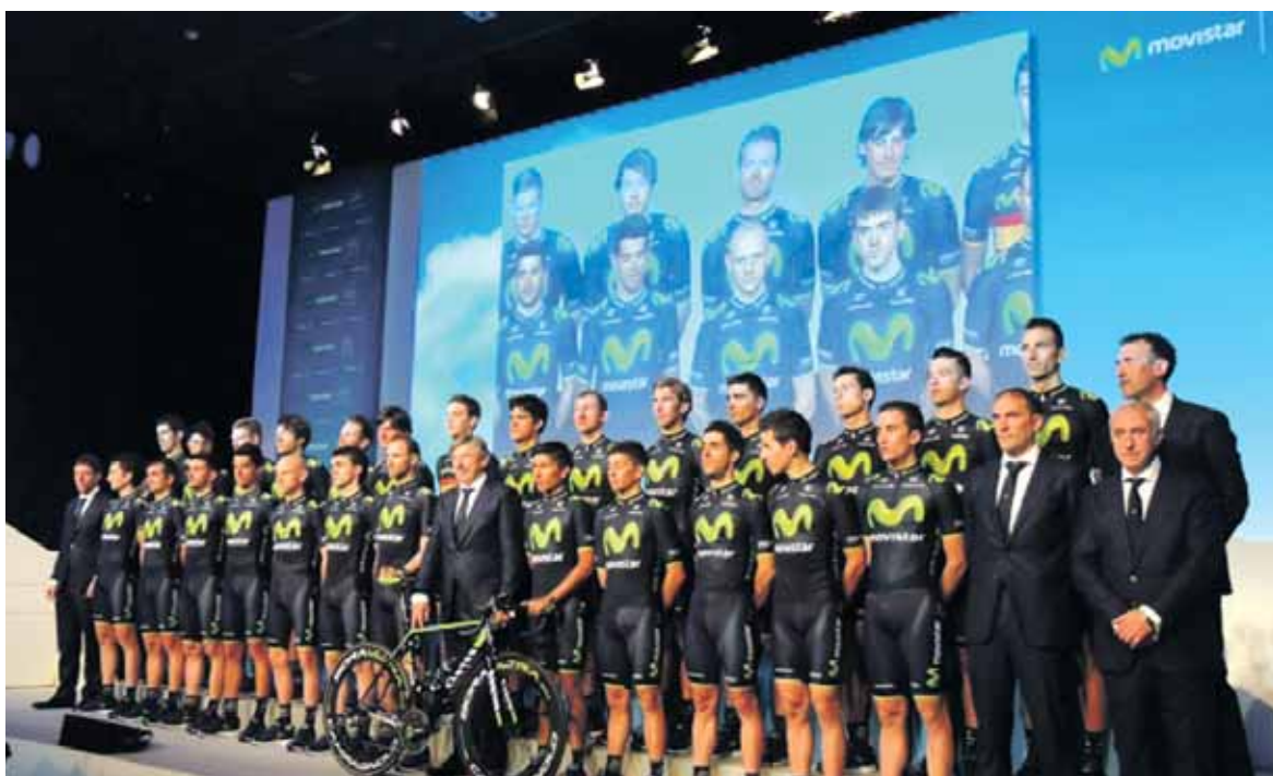
Movistar 2014 taldeko argazkia, aurkezpen ekitaldian.

OSTIRALEAN EGIN ZUEN AURKEZPENA MADRILEN. 27 TXIRRINDULARI IZANGO DITU TALDEAK, VALVERDE ETA QUINTANA BURU DIRELA.