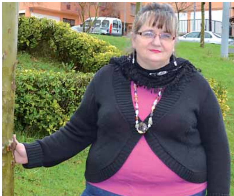
Elkarrizketa osorik: www.guaixe.net-en .