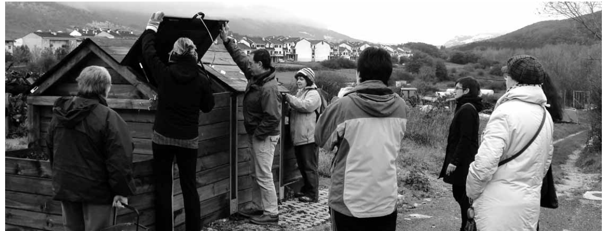
Konposta nola egiten den azaltzeko Etxarri Aranatzan egin zen saioa.