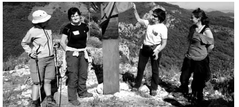
Etxeberriko Aixita gazteluan mugarrria jarri zutenekoa.

aurreikusitu ditu Garalurrek. Bate-tik, nire zaletasuna nire lanpostu