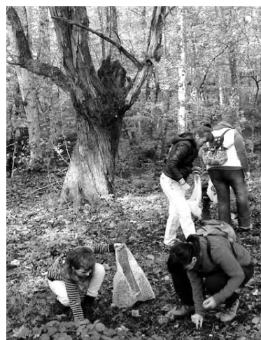
Bakaikuarrek gaztainak biltzen.

Kultura Batzordeak azken urteetan Gaztaina biltze eguna berreskuratu du. Horieta parte hartu duten bakaikuarrek bertatik bertara ikusi dute gaztainondoak gaitxo daudela. Eta hainbat galdera