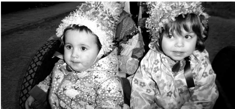
Gero eta gazteagoak parte hartzen dute festan.

Ardikia bazkaltzera 50 irintar inguru bilduko dira. 18:00etan inauteri kalejira abiatuko da elkartetik, gurdian Atxun Zarkoa eramanen dutela, eta trikiti doinuak lagun. Errondaren ondoren, sutan bukatuko du Atxun Zarkoak. Afariarekin ordu txikiak arte luzatu-