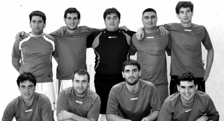
Bunkerrek galdu egin zuen liderraren kontra.

Arbizu eta Iturmendiren kontrakolehian 0-2 aurreratu ziren iturmendiarrak, baina Arbizukoak erremontatzeko gai izan ziren eta 5-3 nagusitu ziren bukaeran. Eta hirugarren partidan, Etxarriko Gaztetxiek gutxiatik irabazi zion Altsasuko Biltokiri, 4-3, partida estu eta lehiatuan. Jurgi etxarriarrak 3 gol sartu zituen, hat tricka. Racing San Migel da liderra (25