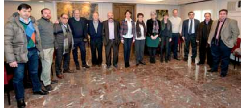
Hasitako zerga-erreformaren prozesuan parte hartzerantz gonbidatu zituzten.

tako arazoak artean daude: enpresek Sakana bertako erakundeentzainaldetik duten babes falta; Sakanaz kanpora zabaldu den irudi txarra; enpresari eta sindikatuen arteko lan-erlazio ez-egokiak; energia arazo larriak izaten diren argindar mozketak txikiengatik; langabezia handia badago ere, gaitutako langile falta; tokiko erakundeak enpresa arloan duten inplikazio eskasa; Lanbide Heziketa indartzea, eskualdeko industria-ehunera egokituz; Sakanako enpresa-pentsaera falta eta enpresariaren