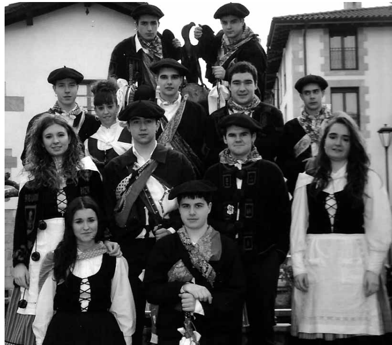
Olaztiko kintoak. UTZITAKOIA

Bestalde, herenegun, Santa Ageda egunean zilarrezko, urrezko eta platinozko ezteiak betetzen dituzten kintadak ospakizunetara bildu ziren. Eta, bihar, larunbatean, herri guztia batuko da festara, nor bere kintadarekin bazkaltzeko elkartuko baita. Udalak bere azpiegiturak eskaini zizkien kintadei herrian bazkaltzeko, eta haietako hiruk eskaintza onartu dute. 90 pertsonen bazkalduko dute Burundapilotalekuan. Bestalde, aurtengo kintoek dantzaldia antolatu dute plazan.