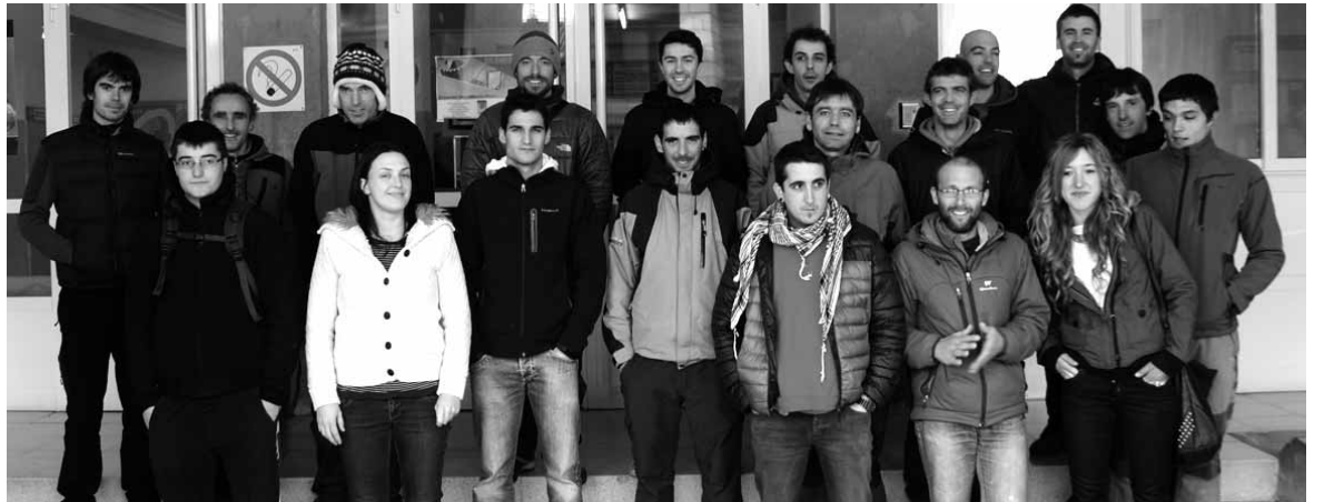
Gogoz ekin diote ikasleek eta irakasleek ziklo berriari.

Ikasketa berriek aurreneko kurtsuan 420 orduko iraupena dute. Aste Santua bitartean komuneko prestakuntza eta osagarria jaso-