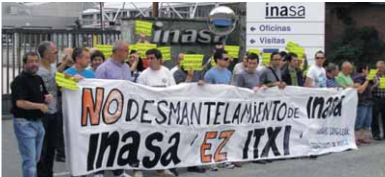
Langileak itxieraren ondoren ere euren eskubideen alde borrokan daude.

Nafarroako Parlamentuko Bozeramaileen Batzordeak, bestalde, Baikapeta berekudeatzaileek, nahita edo axolabekeriagatik, Inasa konkurtsoa eta itxierara eramanduten ikertu eta aztertze eskatu diete merkataritza-arloko epaitegiari, fiskaltzari eta hartzekodunen-lehiaketako kudeatzaileari. Aldi berean, haiei eskatu diete Inasakoen gizarte-aurreikuspeneko eskubideak babestu ditzatela.