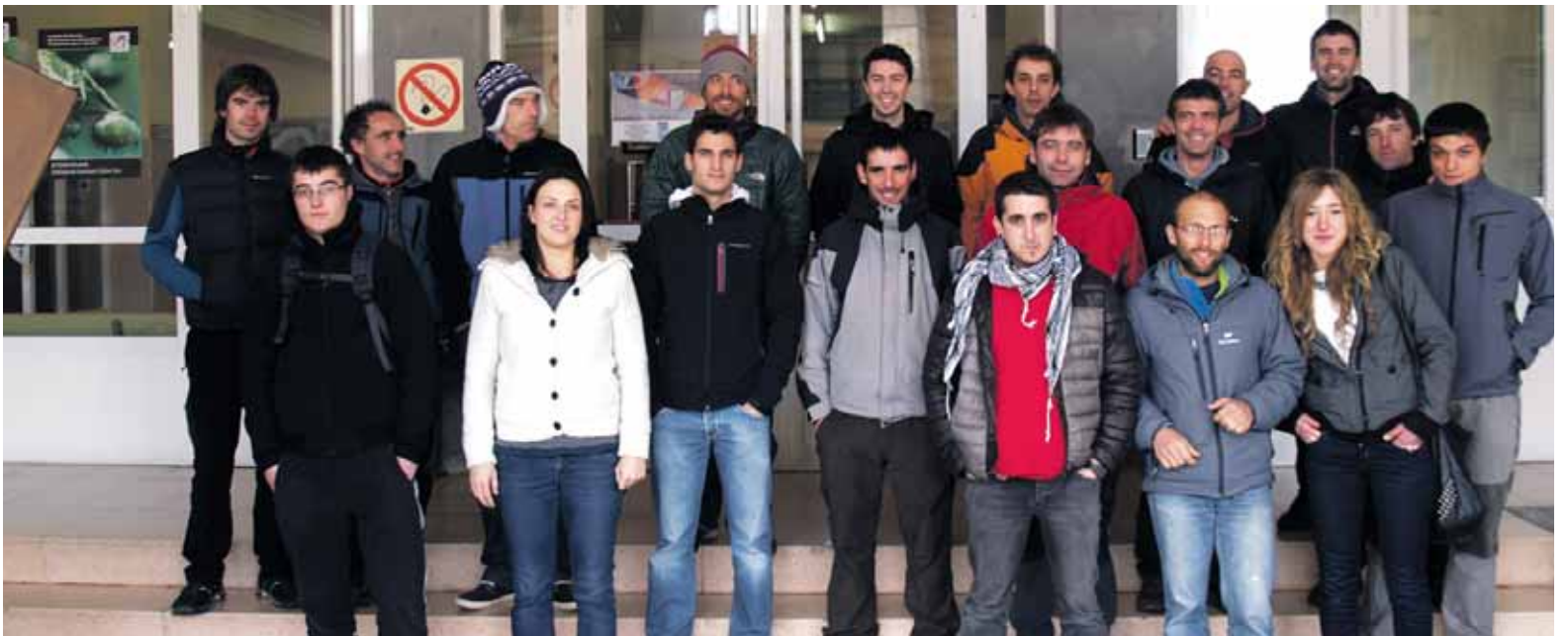
Mendi ertaineko kirol-technikaria, zikloko ikasleak eta irakaslea LHko sarreran.