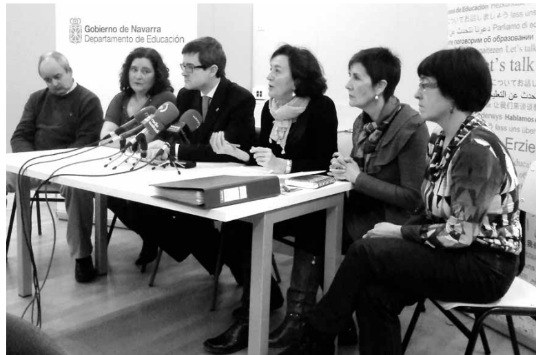
Gobernuko kideak ikastaroen otsaileko deialdiaren aurkezpenean.

Hala, iraila eta otsaila artean, 17 langabetuk gaztelania eta matematika ezagutzak hobetu dituzte Altsasun. 40 urte baino gehiago duen bertako emakumea, hori da izena eman dutenen profila.