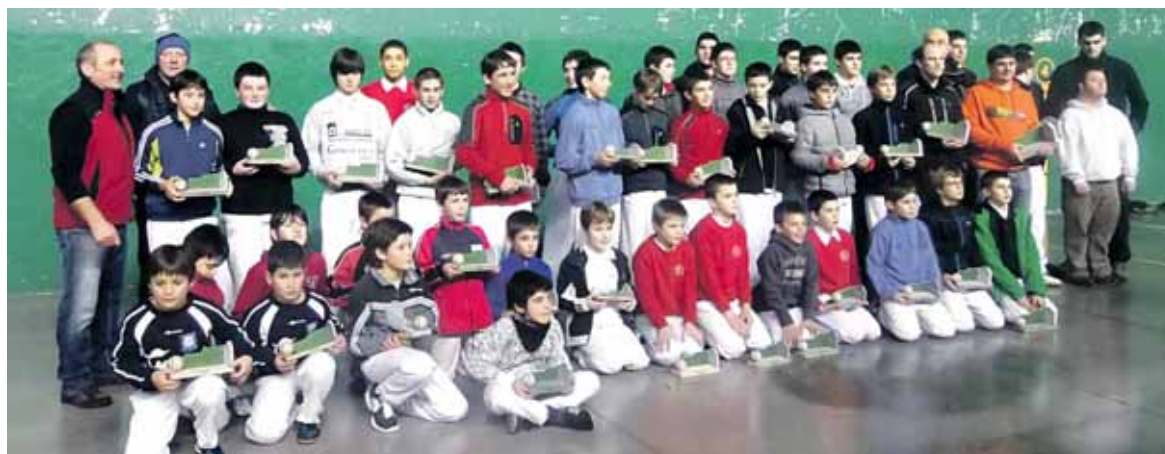
Sakanako Pilota Txapelketako finalista guztiak, sari ematearen ondoren.

SAKANAKO PILOTA TXAPELKETAKO FINALAK JOKATU ZIREN LARUNBATEAN ARBIZUN ETA LAKUNTZAN