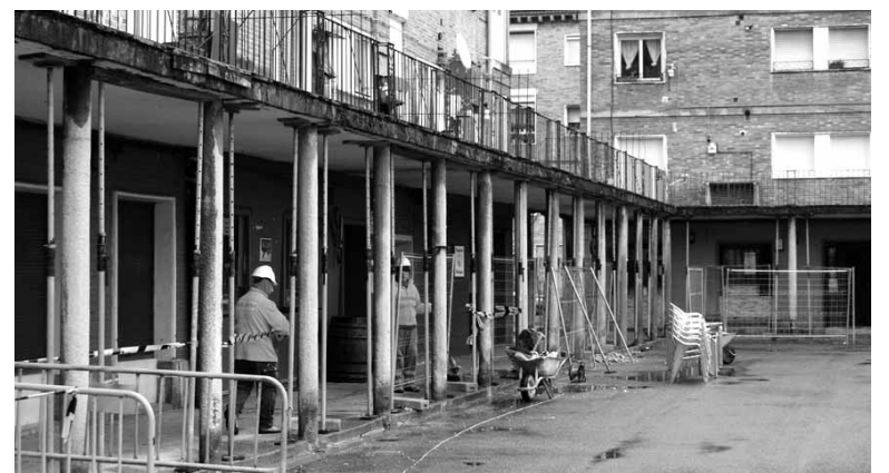
Langileak Zumalakarregi plazan lanean.

Altsasuko Udalak egingen ditu lanak, baina aterpeak hartzen duen zazpi portaletako etxejabeek ordainduko dute lana, haiena baita arkupea. Horrela eginda, bizilagunek udal zergen ordainketa pagatzea aurreztuko dute. Lan horiek despeditzean, aterpean argiteria publikoa berritzeko lanak egingen ditu udalak. Horretarako 20.000 euro bideratuko ditu.