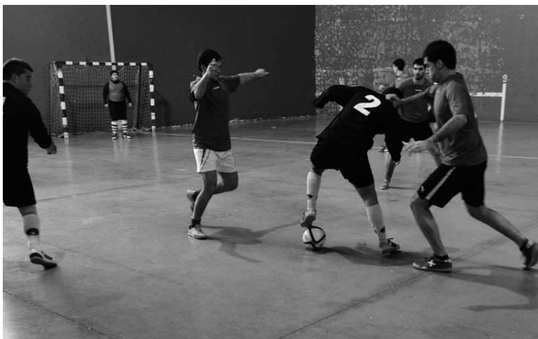
Taldeen maila hobetzen ari denez, txapelketa lehiatua iragarri dute.