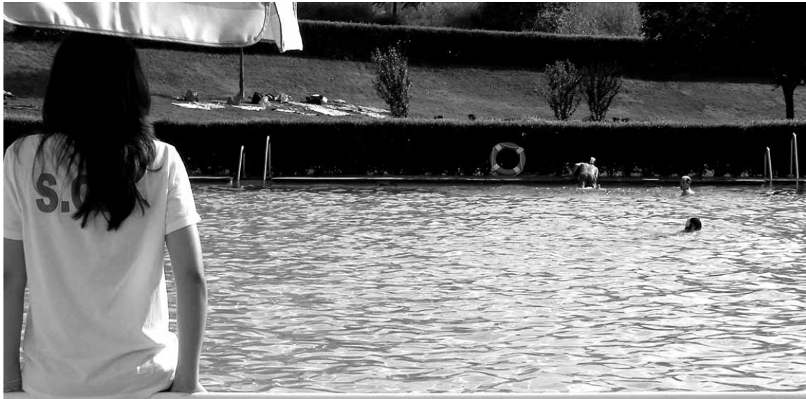
Udalak gutxienez 21 pertsona kontratatuko ditu.

Lau ildo erabiliko ditu udalak enplegua sortzeko. Alde batetik, Oinarrizko Gizarte Zerbitzuek kudeatzen duten Babestutako Gizarte Enpleguaren bidez 3 pertsona kontratatuko dira urte erdirako. Gobernuaren diru laguntzaren arabera jende gehiago kontratatuko luke udalak. Horretarako udalak 20.400 euro bideratu ditu. Bestetik, zuzeneko kontratazioak egiteko 37.600 euro aurrekusi ditu Irurtzunge Udalak. Diru horrekin 6 pertsona kontratatuko ditu. Nafarroako Gobernuaren deialdiaren arabera gehienez 9 langile hartuko lituzke udalak. Bestalde, Nafarroako Enplegu Zerbitzuaren programak erabiliko udalak kontra-