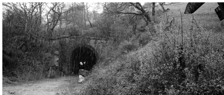
Artadiko tunelaren ahoa.

dago. Bide berdea nondik eraman aztertzen ari dira eta proiektua egi-