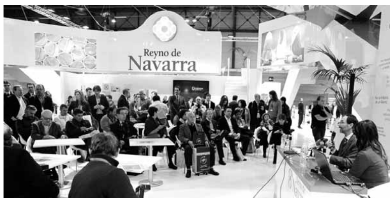
Fiturko Nafarroako standaren aurkezpena.