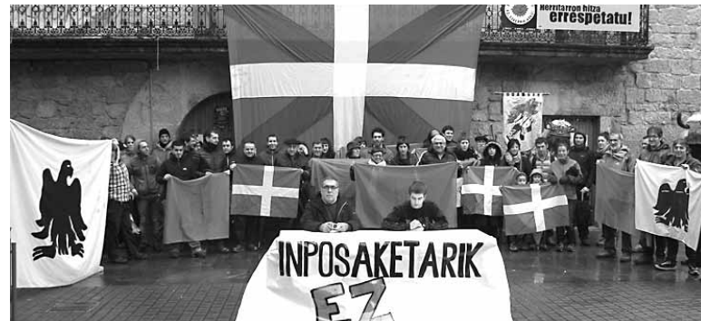
"Guk gure ikurrak aldarrikatzen ditugu, gure hizkuntzan eta sinboloetan oinarrituta".

Espainiako banderaren inposaketaren atzetik beste batzuk bada- tozela nabarmendu zuten. Eta adibide gisa, besteak beste, hizkuntza