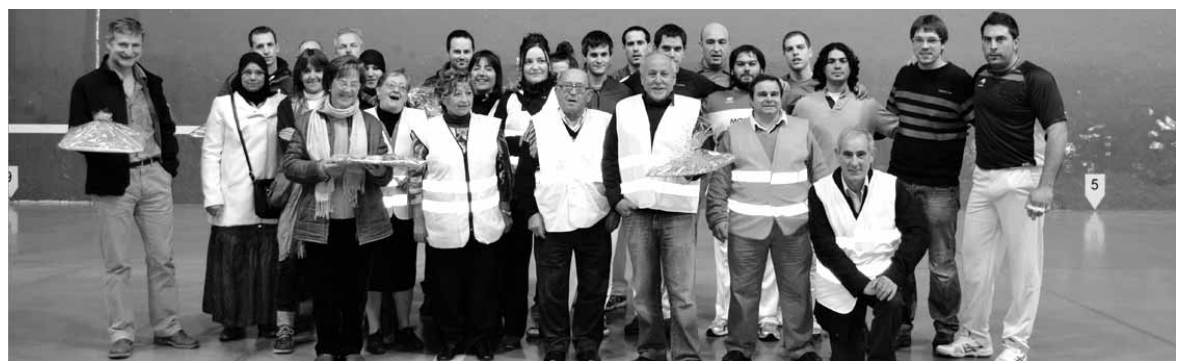
Boluntarioak eta pilotariak ikusleen babesa eskertu zuten.