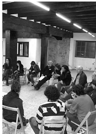
Gure Etxean egindako batzarra.

Sakanako eragile eta sindikal ugari elkartu dira prozesuari euren ekarpena egiteko asmoz. "Gure helburua eskualdean ahalik eta jende gehienaren ekarpena jasotzea da". Horregatik, hilaren 14ra arte Sakanako makina bat herritar gutunaren aurkezpen saioak egingen dira eta haietan parte hartzeko gonbitea luzatu dute. Abenduaren 15ean Bilbon Nazio Batzarra egingen da.