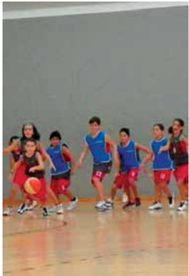
Topaketako partida bat.