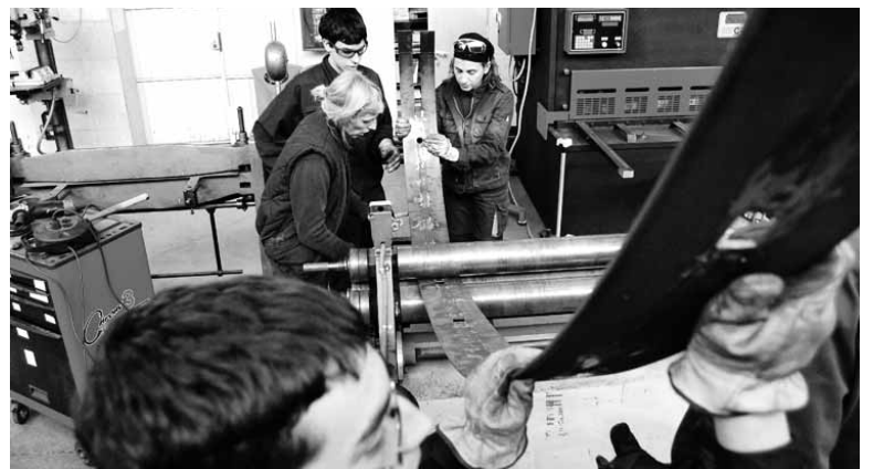
Onartuak izan direnak sarrera proba abenduaren 12an izanen dute.

Aipatutakoaz aparte, honako ikasketak egin daitezke: motoren mekaniko laguntzailea (DBH gaitziditu ez duten ikasleei zuzendutako hasierako prestakuntza profesionaleko programa); mantenu elektromekanikoa (gradu ertaina); sodadura eta galdaragintza (gradu ertaina) eta mekatronika industrial (goi gradu).