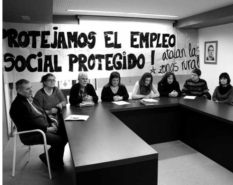
Ibarreko 3 mankomunitateko ordezkariak eman zuten prentsaurrekoa.

Hiru aukera eskaintzen dizkio BGEk pertsonari: lanean aritzea, bere burua prestatzea eta prozesu horretan teknikarien laguntza izatea. Nafarroako Gobernuak, berriz, aurten Zuzeneko Enplegu Aktiboko kontratazioak bultzatu ditu. “Lan bat egiteko aukera eskaintzen du bakarrik. Eta soilik Gizarteratzeko Errenta jaso-