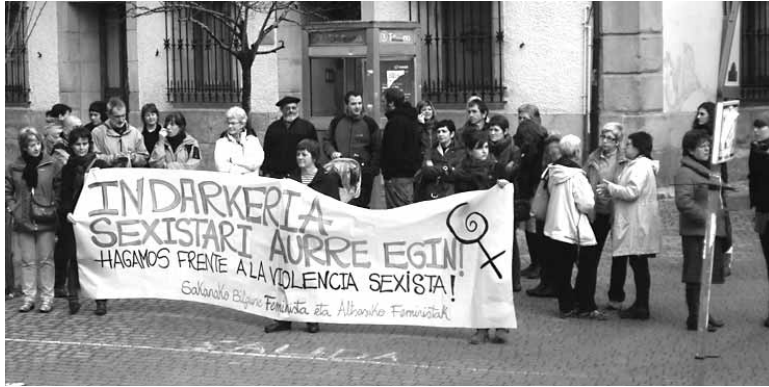
Genero indarkeriaren kontrako kontzentrazioak egingen dira astelehenean.

Emakumeen aurkako indarkeriaren aurrean: tokiko berdintasun politikak. Lelo hori du genero indarkeriaren kontra Altsasuko Udalak atera duen kartelak. Udaletatik prestakuntza, genero indarkeriaren errefusua, emakumeak ikustarazten, sentsibilizazioa eta tokiko genero jokabide egokiak sustatzen