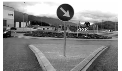
Pintura faltan, errotonda erabilgarri.