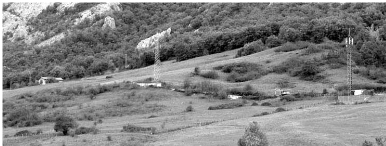
Aralar magalean dauden baserrietara eramaten du Amurgingo bideak.