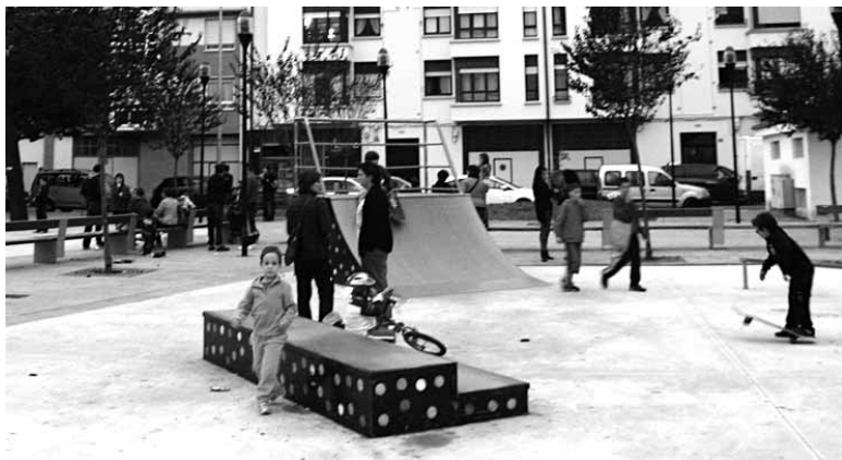
Haur eta gurasoak plazan.

Opor garaietan badira lana eta familia ardurek seme-alaben zaintza uztartzea zail egiten zaien etxeak. Haiei zuzenduta antolatu du Altsasuko Udalak Dibertigarria, Bateragarria eskaintza. 3 eta 12 urte arteko (2001. urtetik 2010. urtera, biak barne) neska-mutilak zaintzeko zerbitzu bat da. Eskarmentua duten aisialdiko begiraleen ardurapean garatuko da programa.