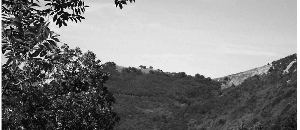
Hostoak gorritzen eta galtzen hasiak dira Aralarako zuhaitzak.

Departamentuak prestatutako zirriborroaren kopia Aralarako Elkartearen egoitzan eta Arakil, Irañeta, Uhartea Arakil, Arruazu, Lakuntza, Arbizu, Ergoiena, Etxarri Aranatz eta Bakaikuko udalteeetan daude. Interesatuak han kontsultatu dezakete txostena bilera joan aurretik.