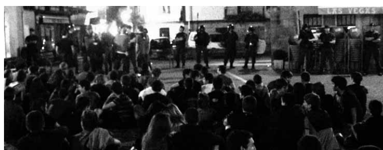
Aurtengo Ospa egunean gazteak Guardia Civilaren presentziagatik protestan.

Ospa! mugimendutik adierazi dutenez, azken aste hauetan lau herritarrei isunak iritsi zaizkie, bakoitza 450 eurokoa, "baimenik