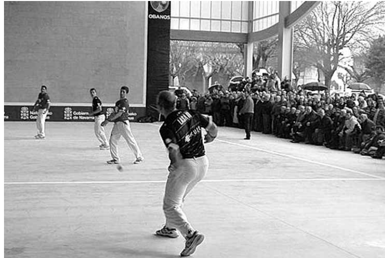
Aurretik ere elkarrekin jokatu izan dute Ongayk eta Lasak. INTERNET

Egun Irurtzungo 59 familiek jasozten dute Irurtzungo Elikagaien Bankuak eskainitako elikagaien otzara. Oinarrizko errenta edo diru sarrera txikia jasotzen duten familiak dira, gaizki pasatzen ari direnak. Lau boluntario aritzen dira bilketa lana egiten, otzarak prestatzen eta familiei banaketa egiten. Udan 70 familiari eskaini diete laguntza.