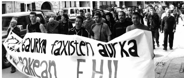
Pintada salatzen 2009ko irailean Arbizun egindako manifestazioa.

Horregatik eta beste ekintza batzuegatik bost gizon atxilotu