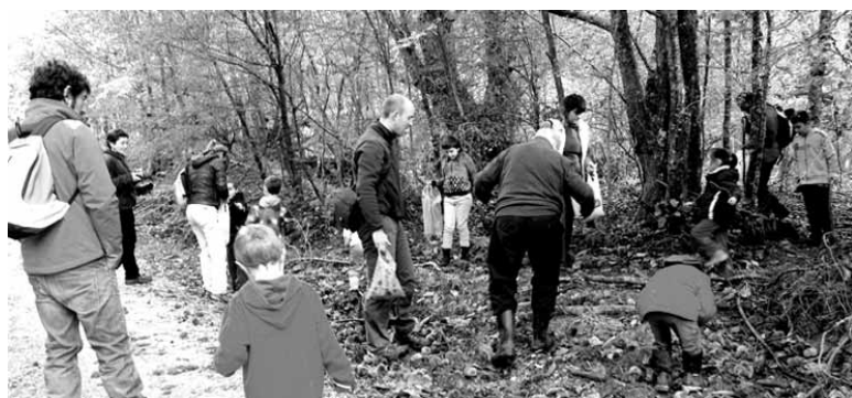
Bikoteen hizkuntza ohiturei erreparatzen diete haurrek. ERKUDEN RUIZ BARROSO.