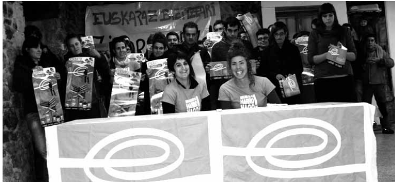
EHEko kideek heldu den asteko itxialdian parte hartzerantz deitu dute.

Hilaren 23an eta 24an epaileak jarritako zigorra Gure Etxea eraikinean beteko dute Euskal Herrian Euskaraz (EHE) eragileko bi kidek. Haiei sostengua adierazteko eta Altsasun zein Euskal Herri osoan euskaraz bizi nahia ozen zabaltzeko egitaraua prestatu da. Euskaraz bizitzeari zigorrik ez! Ezabatu eta euskaraz bizi leloa du egitarauak. Itxialdiak irauten duen bi egunetan Gure Etxea eraikinean lo egi-