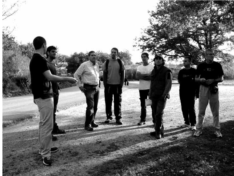
Baso teknikari batek eta udaleko langile batek gainbegiratzen dituzte lanak.

Enneco, haritzaren memoria hartuko duen Basopokale eta Danbolintxulo arteko parajea azalduen bazkalekua zen. Hura itxi eta abereei hara sartzea debekatu zitzaizkionetik sasiak janda zegoen. Aurreko egunetan boluntarioek egin dutena sasi horiek kentzea izan da, bestela ezinezkoa baitzen handik ibiltzea. 10 cm baino gehiagoko diametroa duten landareak mantendu dira, baita haritz landare txi-