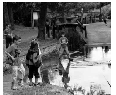
Haurrak ur ertzean jolasten.