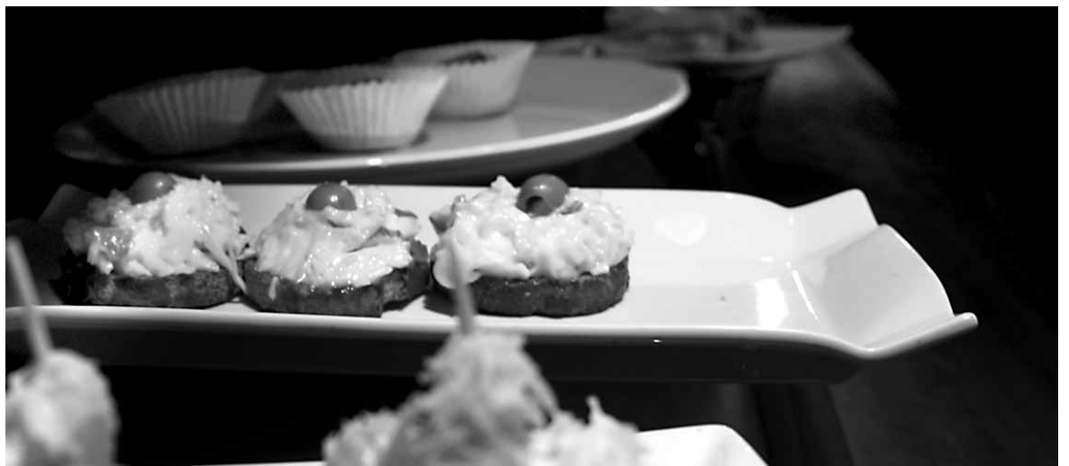
Onddo pintxoaren txanda izanen da heldu den astean Xurrut elkarteko tabernetan.

Lurrazpi, Urtzi eta Xume tabernetan dastatu ahal dira onddo gutziak. Pintxo bana bakoitzean eta guztiak bi eurotan. Onddo pintxo horietakoren bat dastatzen dutenek zozketa batean sartuko dira. Hala, Osasuna edo Laboral Kutxa taldeen partida bana ikusteko bina sarrera bikoitz zozketatuko dira. Horrekin batera, Iortia kultur gunean zinema ikusteko 10 sarrera bikoitzen zozketa ere izanen da.