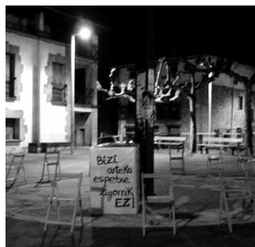
Espetxe politika salatzen aulkia.

tan aldeak ados ez daudenetan Gorenean helegitea aurkezteko aukera dute eta kasu horiek soilik tratatuko dituela adierazi du. Horrekin batera, Botere Legeleari eskatu dio arautzeko Europako epaiak nola bete.