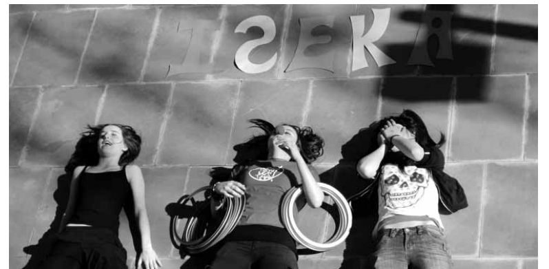
Iseka aisialdi programako parte-hartzaileetako batzuk. ARTXIBOA

Arartekoak argudiatzen du hizkuntza ezagutza hainbat modutan jaso daitekeela, nahiz eta onartu, ohikoena, etxea eta Deredua direla. Probak bestelako onurak izan ditzakeela gaineratu du Enerizek: "une jakinetan, emai-