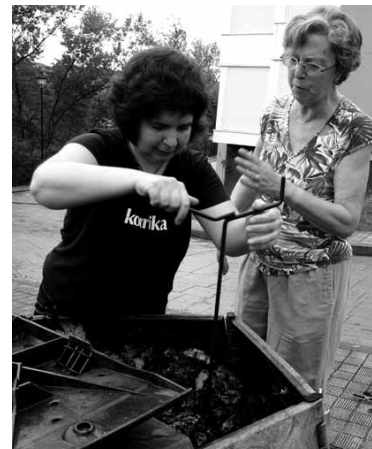
Eguraldiak laguntzen ez badu, 23an egingen da. etxarriaranatz.com kontsultatu web orrian.

postagailuen funtzionamendua, arazoak identifikatuko dira eta konponbidea eman eta dauden zalantzak argituko dira. Eta, ondoren, ibilbidea antolatu dute, Larreñondo, Sagarmiñeta eta Kalamurtxeiko konpostagailuak nola dauden ikusteko. Organikoz betetako pertz marroiak beteak eramatea gomendatzen da, prozesua egiteko.