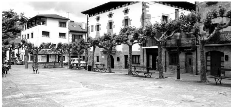
San Saastin festen ondoren hasiko dira plaza berritzeko lanak.

Plaza eraberritzeko parte-hartze dinamika martxan jarri zuen