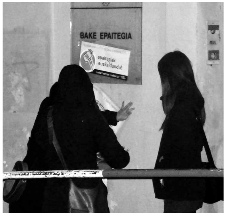
Hizkuntza paisaia euskalduna aldarrikatzeko ekitaldian identifikatu zituzten.

Azaroaren 23an eta 24an Euskal Herrian Euskaraz (EHE) eragileko bi kidek etxeko lokalizazio iraunkorra bete beharko dute. Horren berri astelehenean emanen dute, baina sakandarrak prentsaurreko horretan parte hartzera deitu dituzte. Zigor horrez aparte, EHEko bi kideek aurretik 6.000 euroko isuna ordaindu zuten. Hizkuntza paisaia euskalduna aldarrikatzeko 2011ko azaroan kalera atera zen EHE. Bi kide identifikatuak izan ziren eta 16 seinale ezabatzeko leporatu zieten. Joan zen urteko irailean egindako epaiketan bi seinaleren garbiketa kostuak ordaintzea eta bi eguneko lokalizazio iraunkorreko zigorra jarri zieten.