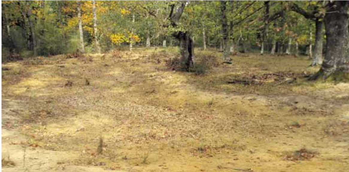
Urdiainen, Sanpedro aldeko bide ondoan, egindako baltsa. Euria egitean beteko da.

Nafarroan Ultzaman, Iruñerrian eta Sakanan besterik ez daude igel espezie horren populazioak. Hori dela eta, Nafarroan Mehatxatutako Espezieen katalogoan dago baso-igel jauzkaria; bere habitataren aldaketara sentibera den espezieztat jotzen da. Europako IV. Habitat zuzentarauak babes zorrotza behar duen espezieen artean sailkatu du. Sortu diren putzu edo