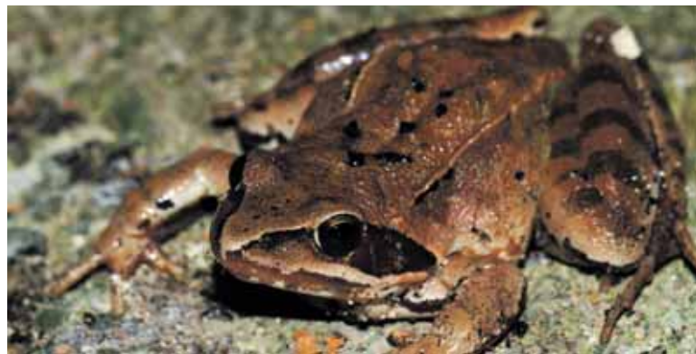
Babestuta dagoen baso-igel jauzkaria.

Azken urteetan hiru eskualdetan ur puntu berriak sortu dira. Baita Sakanan ere, Arbizon eta Altsasun: Sandindeikotik 2 km-ra egin zen baltsan eta Sietseko baltsan baso-igel jauzkaria ugaltzenari direla egiaztatu dute teknikariek.