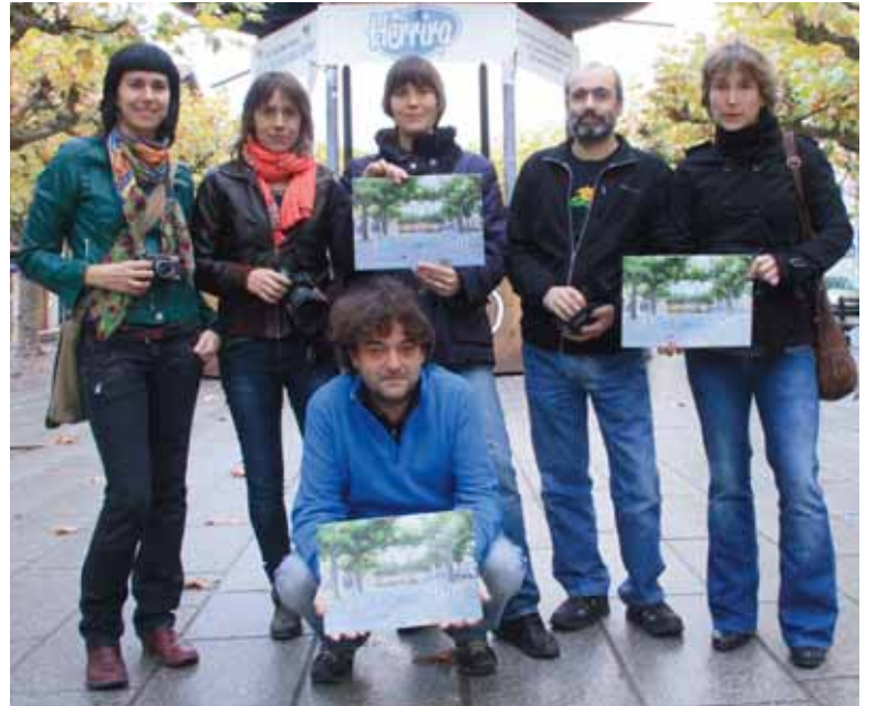
Elkarrizketa osorik: www.guaixe.net-en .