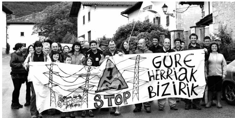
Autopista Elektriakoaren kontrako mobilizazioa.

Deikaztelu eta Itxaso lotuko dituen 400 KV-eko linearen kontrako egitasmoa berria da Lurkide. Goi tentsioko linea pasako den 35 udalerrietan 49 eta 81 metro bitarteko dorreak jarriko lituzke Red Eléctrica Española, 247 hain zuzen ere. Autopista Elektrikorik Ez plataformak haiendako amabitxi eta aitabitxi bila hasi da Lurkide kanpainaren bidez eta Geroa lurretik hasi leloa hartuta. Lurkide bihurtzen den elkarte, erakunde edo norbanakoa dorre bakoitzaren oinarriak hartuko duen 10x10 metro lur sailak babestuko du, haren jabetza hartu gabe. Lurkide agiria ekitaldi batean banatuko da (dorreen zenbakia eta kokalekua izanen ditu), egitasmoaren kontrako banderola bate-