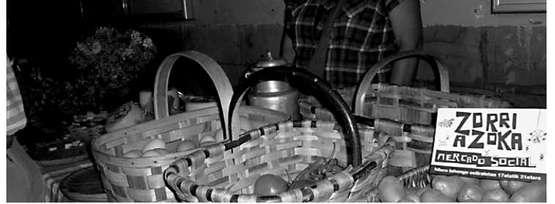
Zorri azokan denetatik eros daiteke.

eta gehiago dira azokak hartzen dituen bisitariak.