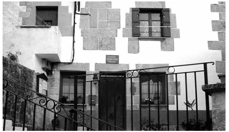
Etxeberriko elkartearen gainean dago Kontzejuko pisua.

Etxeberriko Kontzejuarendako garrantzitsua da frontoia estaltzea. Horrek festetako bazkari-afariak han egiteko aukera emateaz aparte, urte guztian aterpean kirola egiteko aukera ematen die etxeberriarrei, eta herritarren topalekua izango da eguraldia kaxkartzan denean. Egun, festetan frontoia estaltzeko urtero karpabat alokatzen du Kontzejuak.