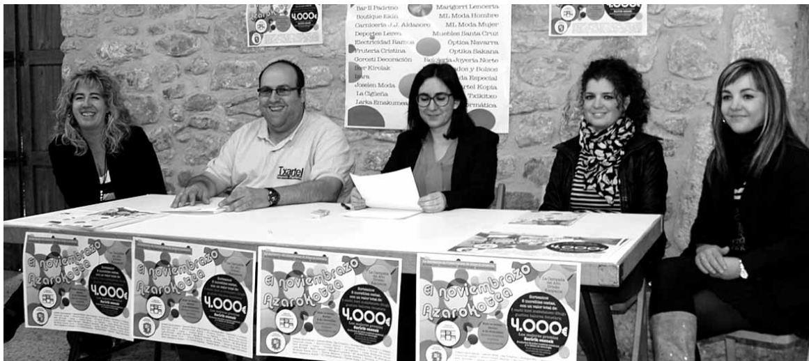
Altsasuko Dendarien Elkarteko ordezkariak aurkeztu zuten Azarokotea.