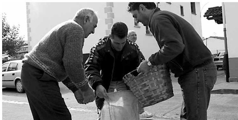
Alegria de Iruña-koek egingen dute patata eta dohaintzen bilketa.