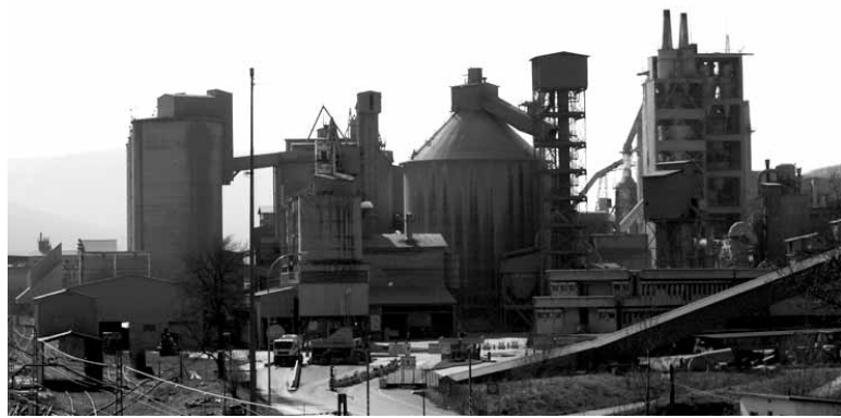
Olatziko Cementos Portland Valderrivasen EEE aplikatuko dute.

Asteartean sinatuzuten Cementos Portland Valderrivasek eta CCO-Ok, UGTk, USOk eta independenteeke taldeko sei porlandegietan Kontratuak aldi baterako eteteko onartutako Enplegu Erregulazio Espedientea (EEE). Aurretik langileek berretsi egin zuten. ELAk ez zuen sinatu eta ordezkariak proportzioagatik CGT ez zen izan. EEEn jaso denez, langileak gehienez ere 180 egun egonen dira lan egingabe azaroa eta 2014ko urte akabera bitartean. Ekoizpen beharren arabera aplikatuko da EEE. Cementos Portland Valderrivasek salmenten jaitsieragatik hartu ditu neurri horiek. Olatzagutiko porlandegiko ekoizpen aurreikuspenak 300.000 tona dira, aurreko urtean baino 50.000 gutxiago. Aurtengo aurreneko 8 hilabeteetan zementu kontsumoa %23 jaitsi dela ere adierazi dute. Adostutakoaren arabera 105 langileen soldata bi aldagarriren artean aterako da: langabeziatik jasoko luketen sari gordinaren eta soldatarbiaren arteko aldea. Estren