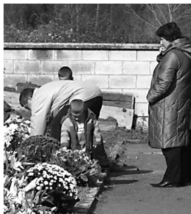
Hilerriak lorez beteko dira.

Badago, hala ere, egun honi kritika egiten dionik. "Urte gehienera ia ahaztuta egon ondoren, badi-rudi soilik egun honetan gogora