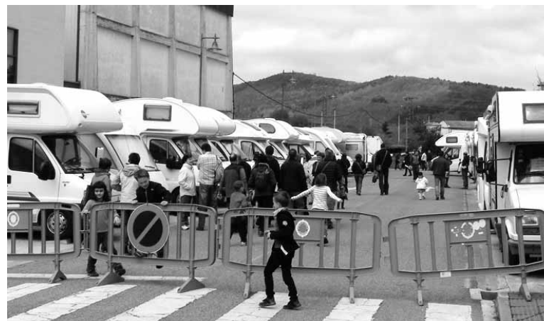
Autokarabanak, Zelandi kiroldegiko inguruneetan aparkatuta.