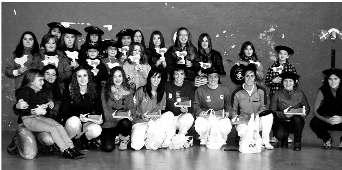
Sakanako Emakumeen Pala Txapelketako aurreko urteko finalistak. Aurten 26 bikote lehiatuko dira.

SAKANAKO NESKEN VIII. PALA TXAPELKETA GAUR HASIKO DA. 5 JARDUNALDIKO LIGAXKAREN ONDOREN, ABENDUAREN 15EAN FINALA JOKATUKO DA