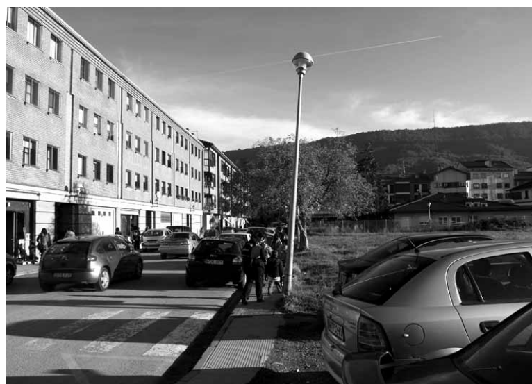
Amak eta haurrak eskolatik etxera. Eskubitan, aparkalekurako orubea.