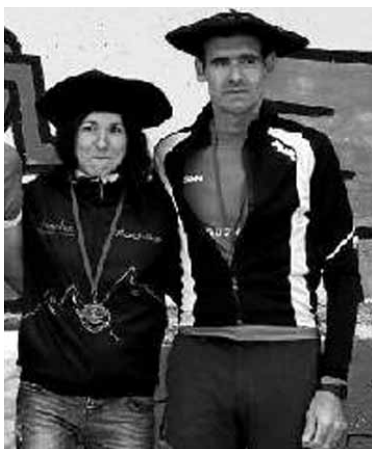
Unzurrunzaga igandeko sari ematean.

ETXARRIARRA LEHEN BETERANOIA IZAN ZEN NAFARROAKO MENDI LASTERKETEN BANAKAKO TXAPELKETAN