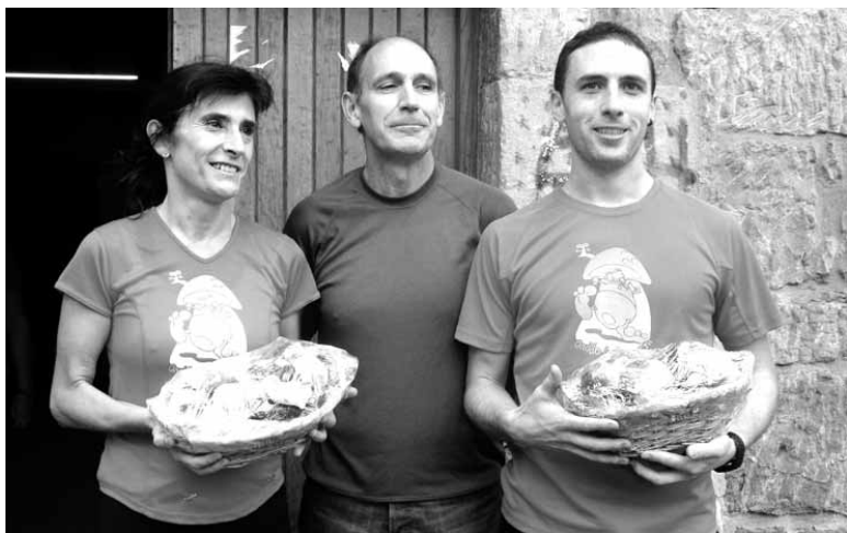
Azurmendi, onddo saskiak jaso zituzten bi korrikalarekin.

225 KORRIKALARIK DISFRUTATU ZUTEN VI. ONDDO LASTERKETAN, HORIETATIK 55 EMAKUMEK