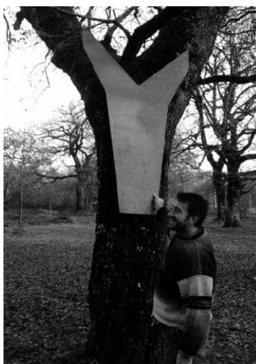
Zuhaitzetik atera litekeen pieza.

Sakanan erroldatuta egon behar dute eta euskara jakin behar dute lan hizkuntza izan baita. Zerrategian edo baso lanetan eskarmentua izatea kontuan izanen da. Gipuzkoako lan hitzarmenaren arabera soldata izanen dute. Curriculumak hilaren 30a baino lehen aurkeztu beharko dira, garapena@sakana-mank.com e-posta helbidearen bitartez edo Arbizuko Utzubar industrialdean dagoen Garapen Zentroan.