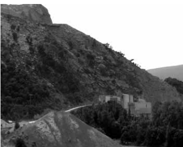
Bizkaia mendian dago harrobia.