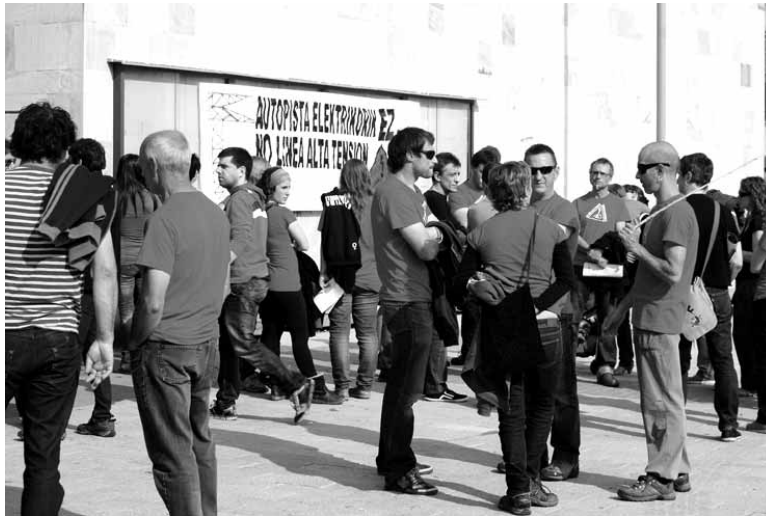
Plataformako kideek igandean Ororbiara joateko deia egin dute.

Igandean Ororbiara plataformaren kamiseta gorria jantzita