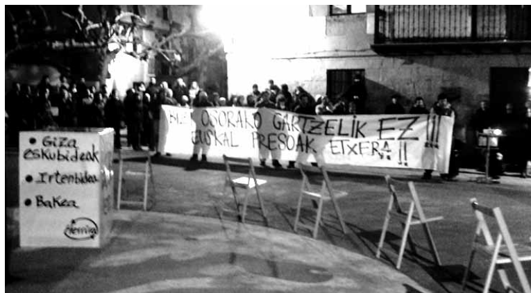
Hainbatetan eskatu da doktrina indargabetzea.

Estrasburgoko epaiaren ondoren, Espainiako Auzitegi Nazionalako Zigor Aretoko epaileen ohiko bilera eginen dute gaur. Erabakia-ekin aske geratu behar duten preso kasuak aztertzen hasiko dute. Presoen abokatuek haiek aske gelditzeko eskaerak aurkeztuak dituzte dagoeneko. Auzitegiak banan-banan aztertuko du preso bakoitzaren eskaera. Ofizios askatzeko aukera ez dirudi gauzatuko denik.