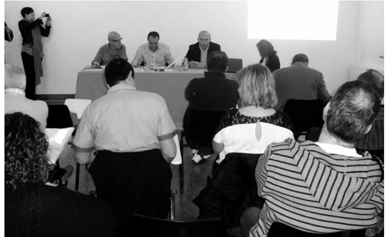
Hautetsiak bilduta. Mank eta kontzejuak ez zeuden gonbidatuak.

bateskatu zioten udal ordezkariak Esparzari. Toki erakundeak herri-tarrendandik gertuen dauden erakundeak izanik, Nafarroako Gobernu haiekin elkarlanean herri-tarren beharrak zein diren