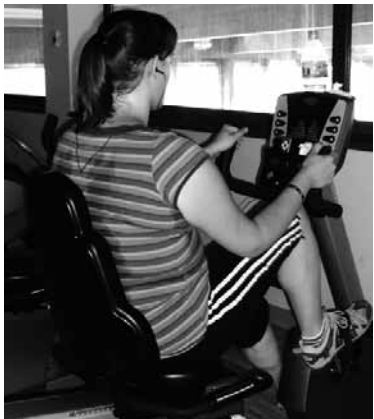
Emakumea kirola egiten.