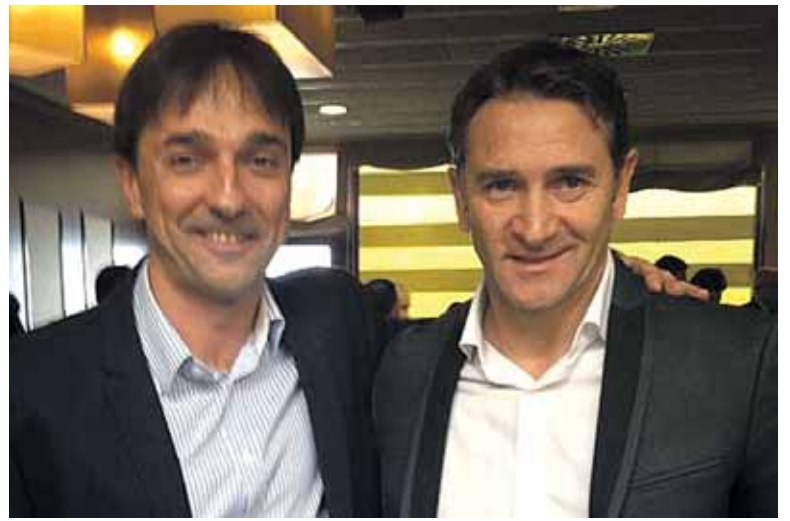
Arregi Montanierrekin, sari jasotze ekitaldian. XOTA

“Ilusio handiarekin jaso dut saria, jakinda egindako lanagatik dela. Pozik nago”, adierazi du Ima-