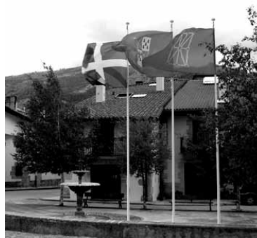
Banderak San Juan plazan.

Halako berrien aurrean, duela bi aste ospatutako Euskal Festaren barruan, San Juan plazan, Autobus geltokitik gertu, ikurrina, Uharteko