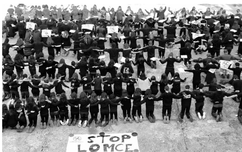
LOMCEren kontra institutuan atzo egindako protesta. UTZITAKOIA

Hamaika arrazoirengatik, LOMCEri ez! Lelohori izan zuen atzo Iruñean eta Tuteran egin ziren manifestazioek. Herrikoa, Sortzen, Ikasle Abertzaleak, LAB, STEE-EILAS, CCOO, AFAPNA, ANPE, CSIF, ELA, UGT eta Eraldatu erakundeek deituzituzten. Hainbat alderdik eta eragileek bat egin zuten deialdiekin. Murrizketen kontra eta onartu den LOMCE legearen kontra protesta egin zuten.