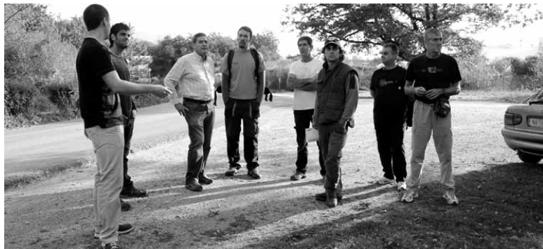
Ostiralean parkeko eremua ikuskatu aurretik. ENARA INSAUSTI

Etxarri Aranatzko Udalak eta Nafarroa Bizirik fundazioak boluntarioak eskatu dituzte, Enneco, haritzaren memoria zentroko aurreneko lanak egiteko. Egin beharrekoak hiru dira: Basopokale garbitu; sasiak kendu (mantendu behar diren zuhaitz eta guneen inbentarioa egiteko) eta tokiaren neurketa topografikoa egin (gero proiektua bertako balibideetara eta orografiara moldatzeko).