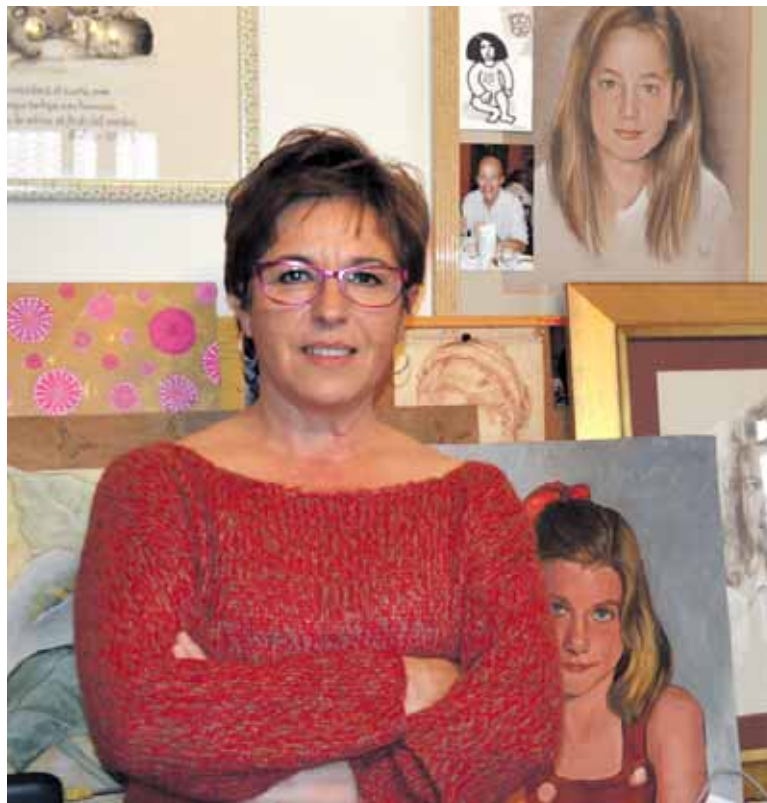
Elkarrizketa osorik: www.guaixe.net-en .

1.Noiztik zara margolari? Gaztea nintzenetik naiz oso behatzailea. Behin objektuak, paisaiak edo pertsonak nire irudimenean ditudanean islatzen ditut nire margolanetan. Gaztetan paisaiak egiten nituen batez ere. Gero erretratuak egiten hasi nintzen.