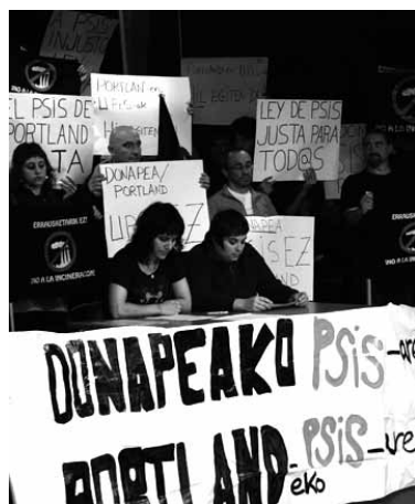
Jendetzak babestu zuen eskaera.

na. Aldiz, herritarrek eta udalek defendatzen duten interesa herritarren osasuna da, errausketaren kontra herritarrek mota guztietako minbiziak harrapatzeko arriskua areagotzen baita" nabarmendu du 3MBk. Horrengatik, plataformak eskatu du parlamentariak aukera baliatu dezatela diskriminaziorik egiten ez duen lege bat egiteko, "horrela beste UPPrS bidegabe batek aurrera egin ez dezan".