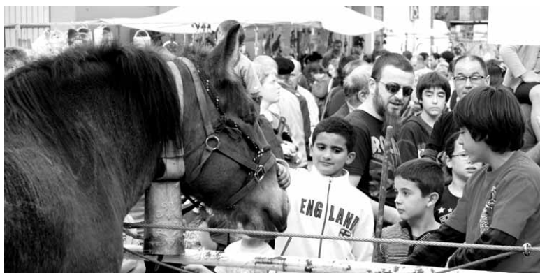
Jende asko izan bazen ere,azienda gutxi saldu zen.