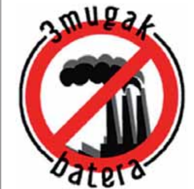
3Mugak Batera Plataforma

Portland-en UPrSaren kontra dauden talde politikoez guztie beren jarrera argia adierazteko eskatzen diegu, ezin dutelako beste egun bakar batez berriz ere Sakanako bidegabea eta baztertzaila den lege honen ondorioen erantzunkide izaten jarraitu.