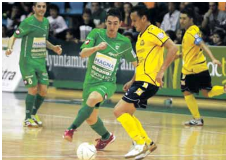
Irurtzundarrak Magna Xotan jokatzen. UTZITAKOIA