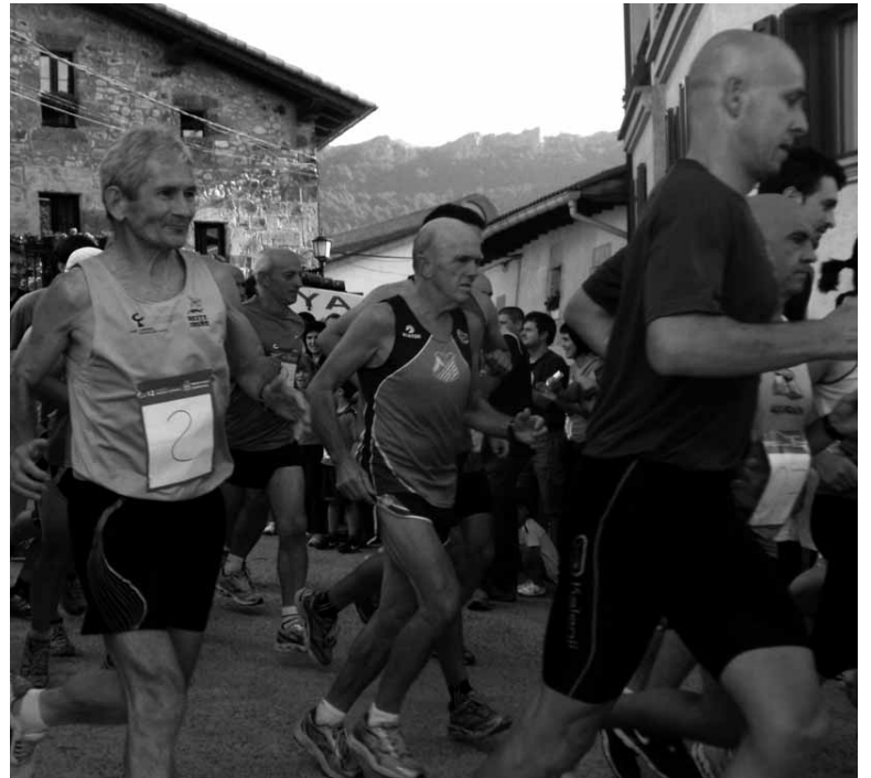
Giro polita izaten da Ergoienako Biran. Aurten Dorraon izango da topaleku.