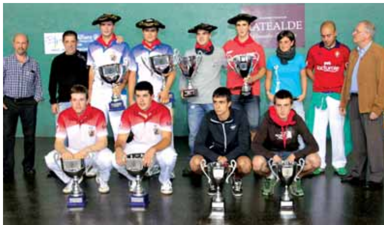
Finalistak, Federazioa, SDA eta Altsasuko Udaleko ordezkariak.