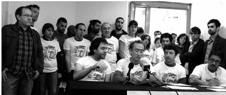
Auzipetuak eta babesak azaldu dieten herritarretako batzuk. UTZITAKOIA

tzak 5 urte eta 2.700 euroko isuna eskatzen du; Barcinaren akusazio partikularrak, berriz, 9 urte eta