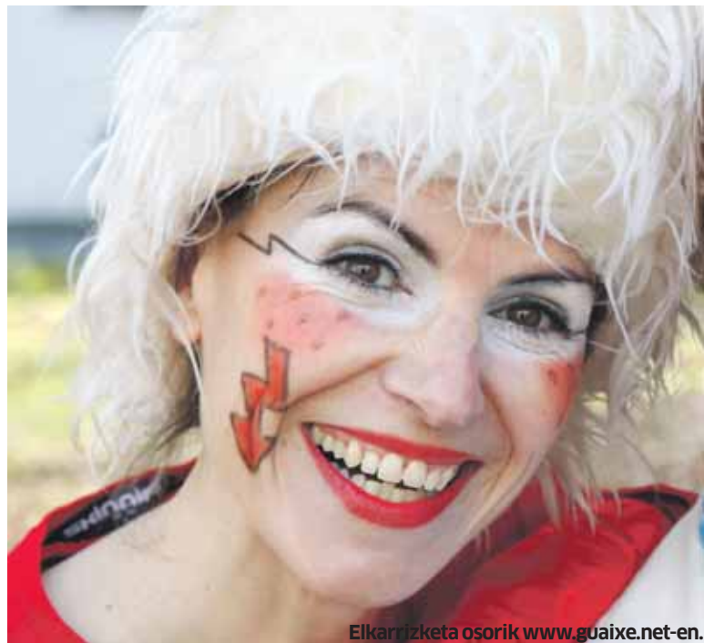
Elkarrizketa osorik www.guaixe.net-en .