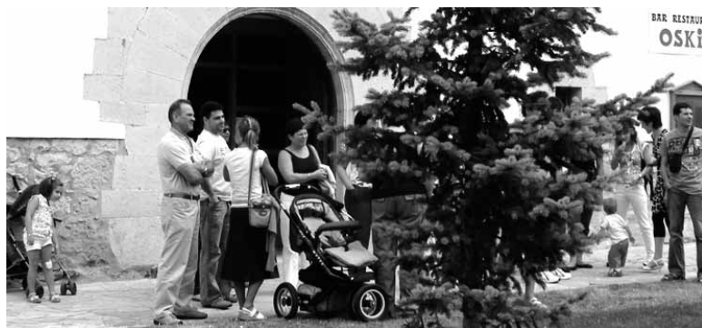
Jendea Sastrerena etxearen alean. ARTXIBOA