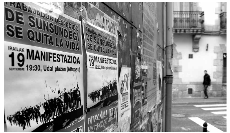
Atzoko manifestaziora deitzen zuten kartelak.

Kapitalaren eskutik etorri diren erreformen eraginez mila-