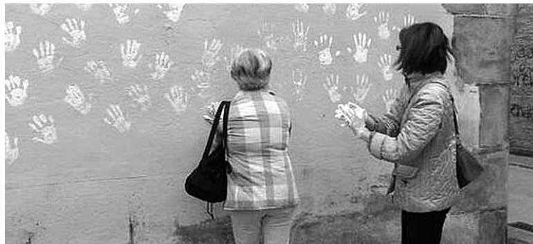
Hondo urdinaren gainean esku txuriak margotzen.

Aurreko igandean ETA goratzu pintadak agertu ziren Ulaiardarren etxean, Txartxenekoan. Haiak eta aurretik zudenak ere ezabatu zituzten larunbat goizean. Behin