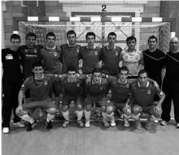
Xota Bk 9-4 irabazi zion Colo Colori.