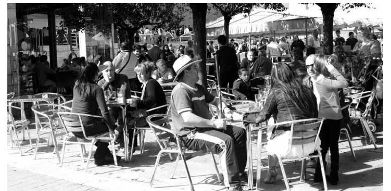
Proiektua onartzu gero, mintegiak, hitzaldiak, arte lehiaketa... etorriko dira.