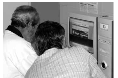
Ikastaro eskaintza zabaldu izanen da.