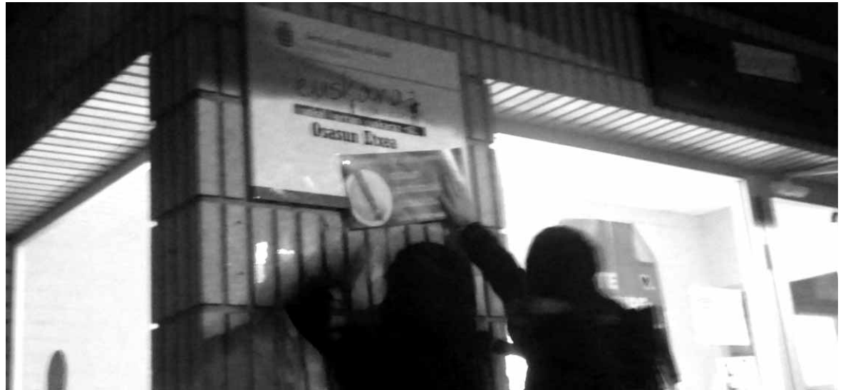
EHEko kideak Ezabaketa Egunean Osasun Etxean euskararen aldeko kartelak jartzen.