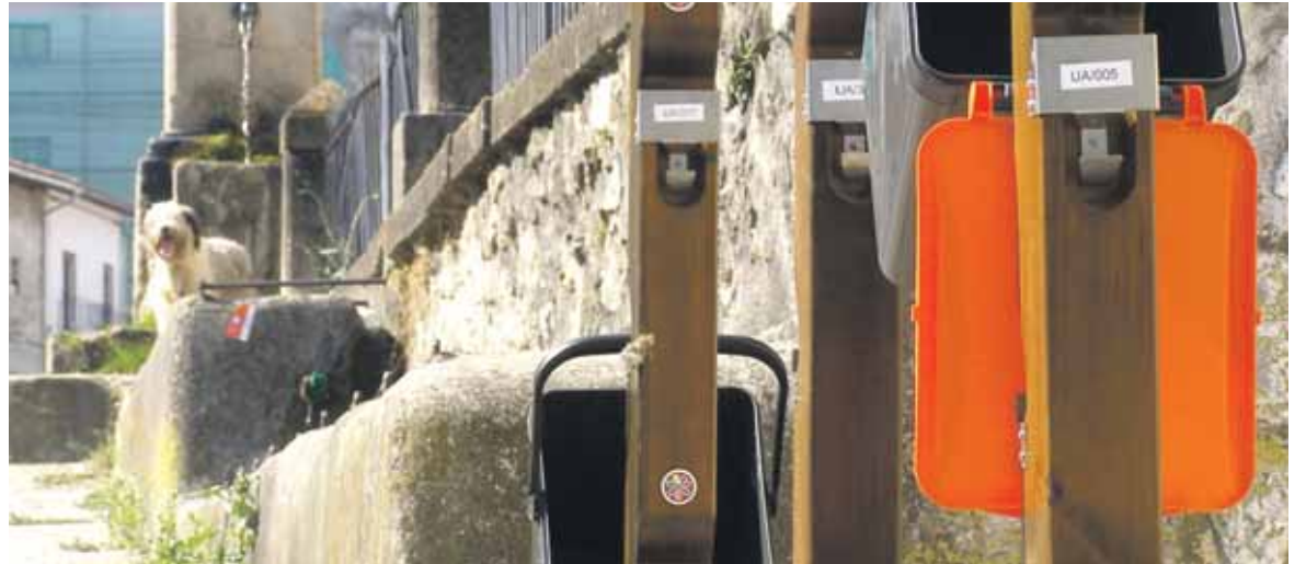
Hondakinaren pertzak jasoak, zintzilik, Uhartea Arakilen.

Hondakin bilketa sistema berriko ardatzetako bat konposta da, Mank-ek horrela hondakin organikoaren biltzetan lan gutxiago egin behar duelako eta haren tratamen-