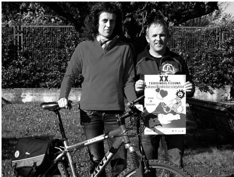
Txirrindularia puntuan jarri eta Txirrindula Egunean aritzera animatu dute.

Parte hartzea libre da eta doan, baina antolakuntzak autobus zerbitzua jartzen du txirrindulariak euren herrietan jaso eta Irurtzenera eramateko -goizeko 7:45ean aterako da Ziorditik-, eta proba bukatuta, atzera ere txirrindulariak etxera eramateko. Bizikletak emateko kamioia egoten da ere. "Zerbitzu hauek erabiltzeko aurretik izena eman behar da. Irailaren 23a da azken eguna. Herri guztietan izena emateko tokiak jarri