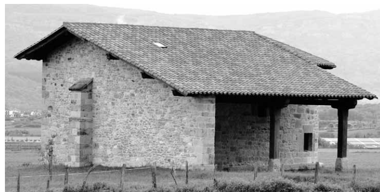
Larunbatean, 12:00etan, meza izanen da eta, ondoren, auzatea. UTZITAKOIA