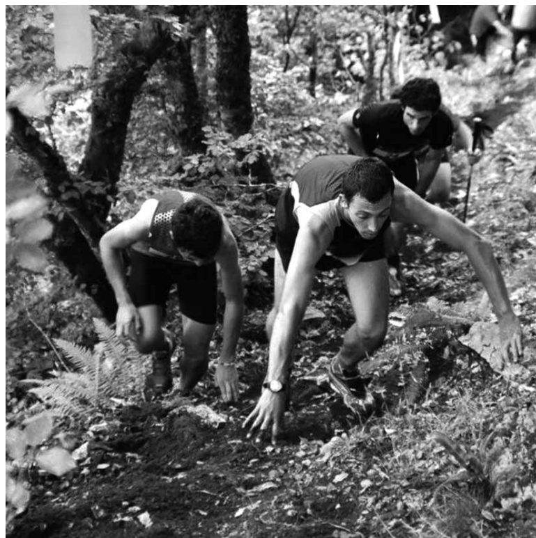
Malda izugarrietan gora ibiliko dira korrikalariak. ANTOLAKUNTZA

Uharte-Arakil-Beriain Km Bertikalean 158 korrikalari daude izena emanda. Proba hauetan egin ohi denez, parte hartzaileak banakabanaka aterako dira, proba kronometratua izango baita. Uharte Arakildik aterata Beriaingo San Donato ermita izango dute helburu parte hartzaileek (1.494 m). Proba motza da, baina intentsitate handikoa: 5 km-ko lasterketa, baina 1.023 metroko desnibelarekin eta sekulako etapa eta maldekin. Aurten ibilbidean aldaketa egin dute: menditik barrena zati handiagoa sartu dute, pistako eremu bat kenduz.