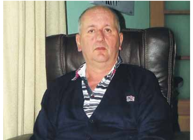
Mugikortasun handiagoe emanen dion aulkia eskatu du Axio. ERKUDEN RUIZ

"Ez digute kasurik egiten". Flores itxaropena galtzen ari da. Parlamentura joatea ere pentsatu du. "Diru-