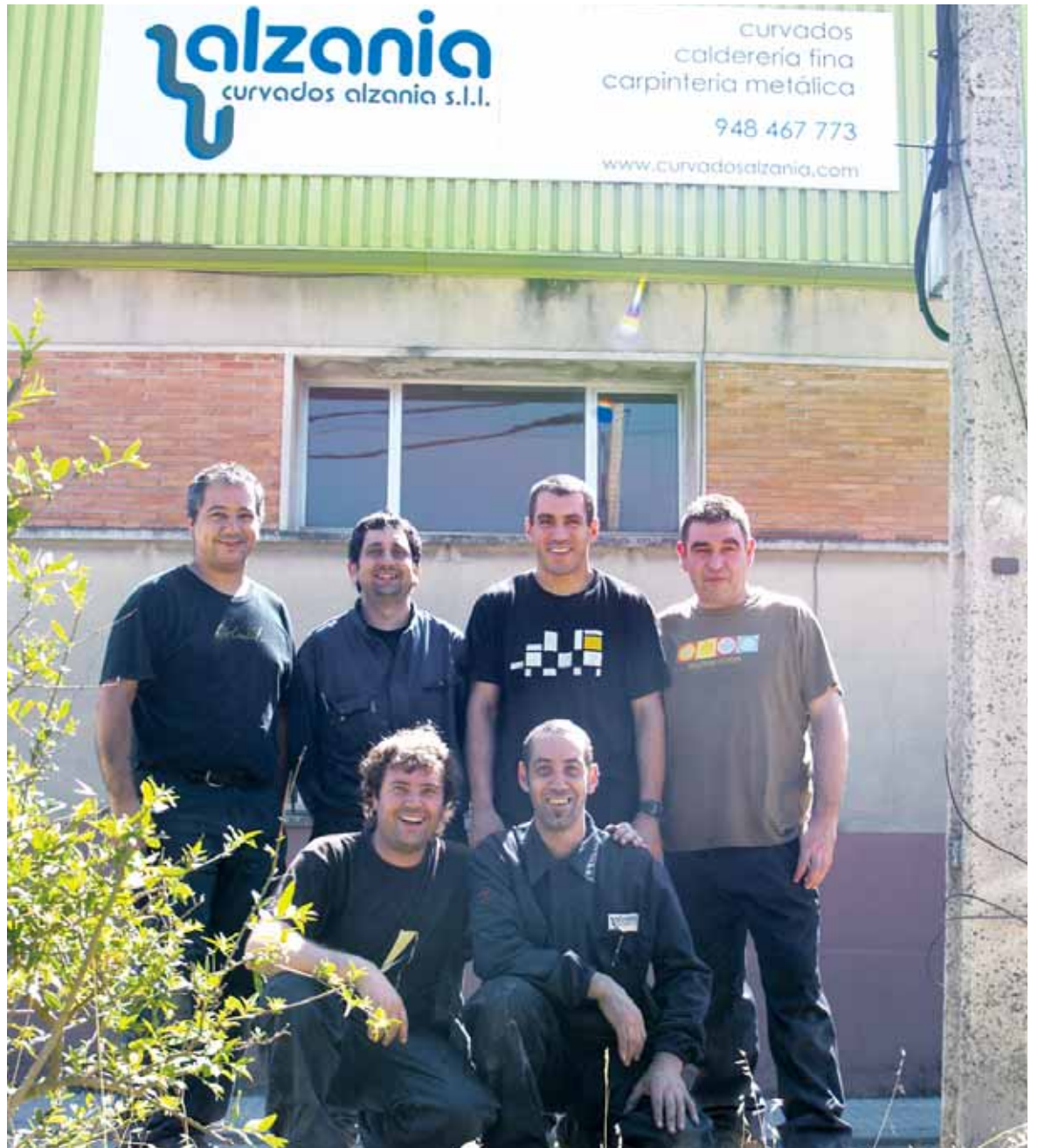
Curvados Alzania enpresa sortu dute Comebarren zeuden langileak, euren langabezia kapitalizatu ondoren.