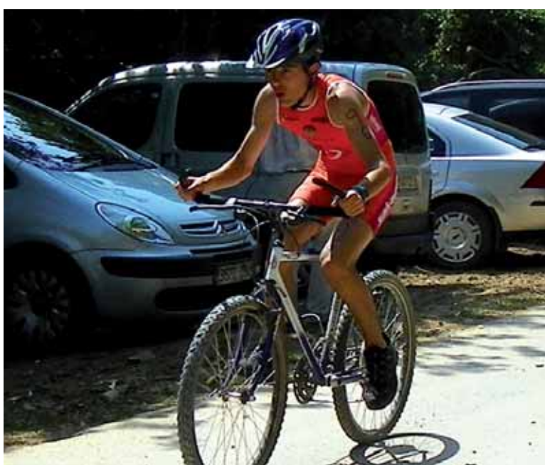
Gero txirrindulari hartu behar izan zuten, eta, azkenik, korrika egin. ERKUDEN RUIZ