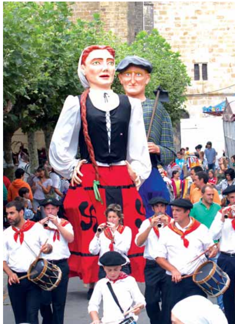
Konpartaren 10. urteurrena denez, omendu egingo dute.

13:00etan Bertso saioa. 13:00etan Auzatea, Haizearen eskutik. 17:30ean El gran circo social antzezlan. Kalejira batekin hasiko da herriko plazan. 20:00etan Auzatea. 20:00etatik 22:00etara Musikaldia Ttanttaka taldearekin. 22:00etan Zezensuzkoa. 24:00etatik 3:00etara Musikaldia Ttanttaka taldearekin.