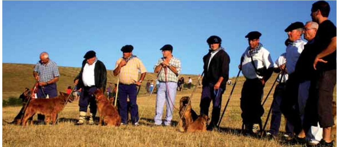
Polita izaten da Artzai Eguneko artzain txakur lehiaketa.