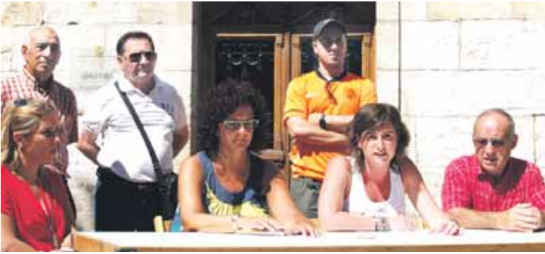
Zelandiko guraso elkarte burua eta zuzendaria udal ordezkariekin.