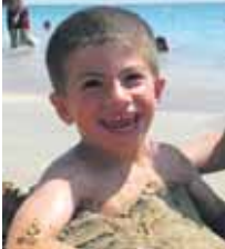
Andoni ZORIONAK!! "Felon el bandido"

Tailerra eta erakusketa Zuntaipe auzoa z/g (N1 zaharra), Altsasu Telf.: 948 468 559 info@lehalsaventanas.com www.lehalsaventanas.com