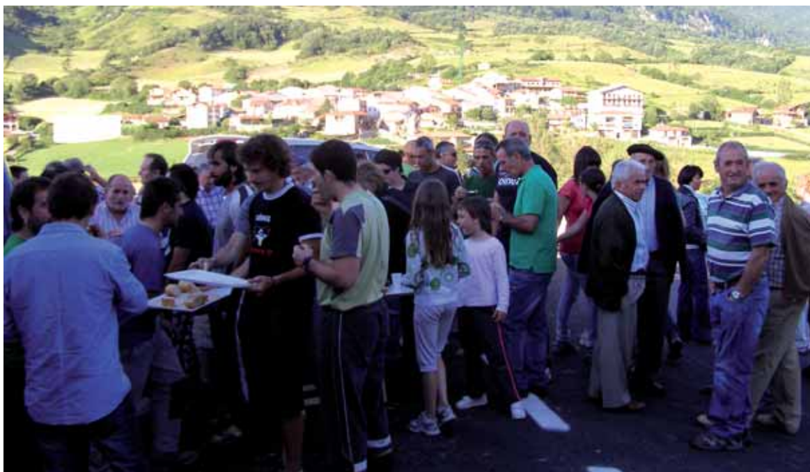
Dorraoko festetan ez da auzaterik faltako.

12:00etan Meza nagusia. 13:00etan Otamena eta musika eliz-atarian. 18:00etan Manu Magoa, magia erakustaldia. 18:00etan Satrustegiarren arteko herri hirolak. 19:30etik aurrera moztorro dantzaldia Dj Asierrekin. 22:00etan Festa bukaera. Hau pena, nik!