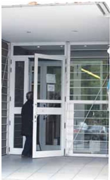
Etxarri Aranatzeko osasun etxea.

Mankomunitateko ordezkariak nabarmendu dutenez, "Osasunbideak bere burua euskalduntzeko planik ez du, ez eta aurrera begira egiteko asmorik ere; beraz, sortzen diren arazoei irtenbidea bilatzeko oinarriko arazoak topatzen dituzte eta topatzen jarraituko dute. Horrela, Nafarroako udalerrri euskaldunetako herritarren hizkuntza eskubideak urratuak dira, etenik gabe". UEMAK herritarren hizkuntza eskubideak bermatzeko Osasunbidearekin harremanetan segitu eta elkarlanean aritzeko prest azaldu da.