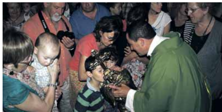
Haurrak aingerua gurtzen. NEREA MAZKIARAN

Hamargarrenez San Migeli haurrak aurkezteko jardunaldia hartu zuen Aralarko Deun Mikel Goiaingeruaren Kofradiak. 87 haurrek parte hartu zuten elizkizunean eta ondorengo gurtzean. Guztiek ere elizkizunean aingeruaren bedeinkapena jaso eta irudia gurtu zuten. Akaberan aingeruaren lagun direla adierazten duen pergamino bana jaso zuten. Haurren gurasoek, bestalde, gutun bana jaso zuten haien izenean.