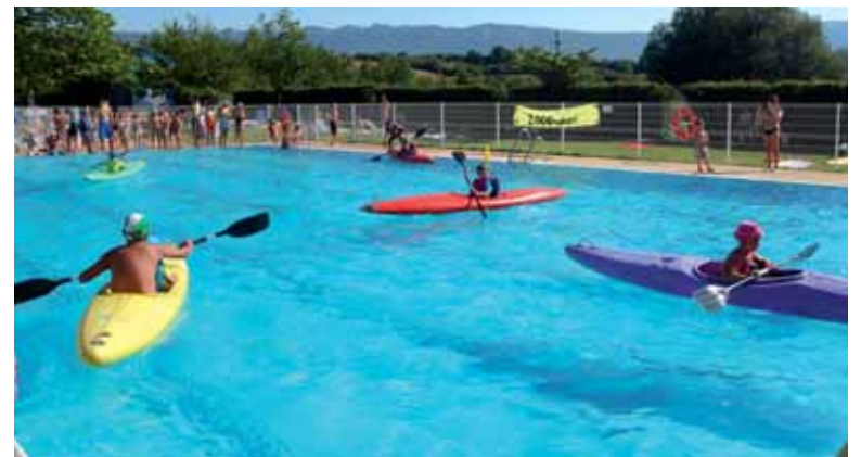
Iaz Lakuntzan izan zen kayak jardunaldia. Aurten Uharten izanen da.