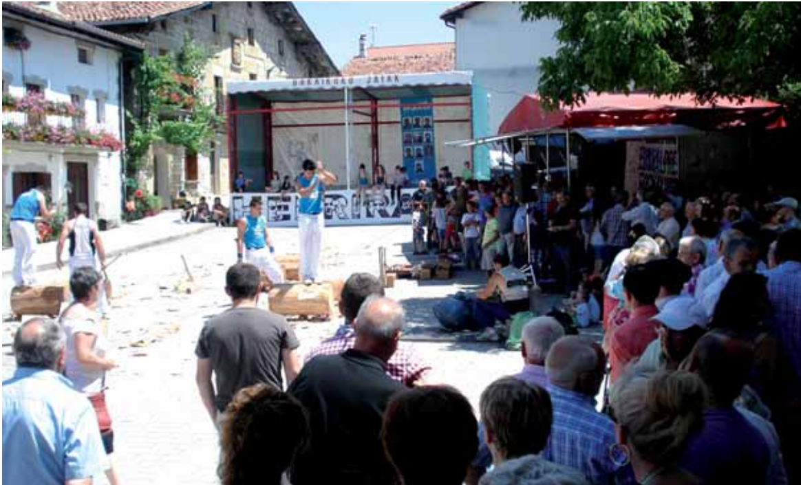
Bakaikun aizkolariak izan ziren atzo. Bihar FlashMoba grabatuko dute, 19:00etan.