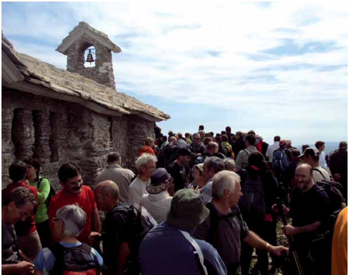
Urtero jendetza biltzen da Beriaingo erromerian. Aurten agorrilaren 11n izanen da, Uhartea Arakilek antolatuta.

Agorrilaren 7a San Donato eta San Kaietano eguna da. Antzinatekegun horretan uharte arakildarrek erromeria egiten zuten Beriaingo ermitara, baina egun agorrilaren 7a erreferentziatzen hartuta igande gertue- nean, ospatzen da aipatu erromeria. Oso erromeria polita izaten da eta jende asko biltzen da. Uhartearre- kin batera, makina bat sakandar eta Oloko ibarreko jendea bilduko da Beriaingo malkor gainean. Lehenik eta behin, elizkizuna har- tuko du ermitak, 11:00etan. Uhar- te Arakilen gordetzen dituzten