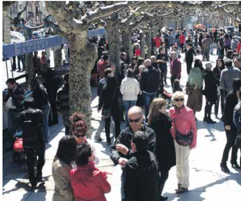
Jendea Belardik Etxarri antolatutako Amalurra azokan.

Salmenta postuetan Sakanako ekoizleak edo artisauak egonen dira eta haiekin zuzeneko harremana izateko aukera izanen dute bisitariak, haren produktuen sortze prozesua ezagutzeko esatera-