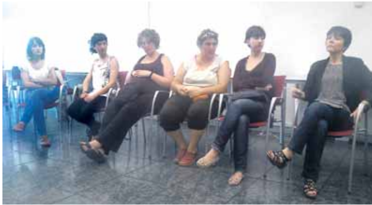
Saioan parte hartu zutenetako batzuk. UTZITAKOIA

Prietok azaldu digunez, saioetan parte hartu zuten langabetu gehienek 22 eta 44 urte bitartean zituz-