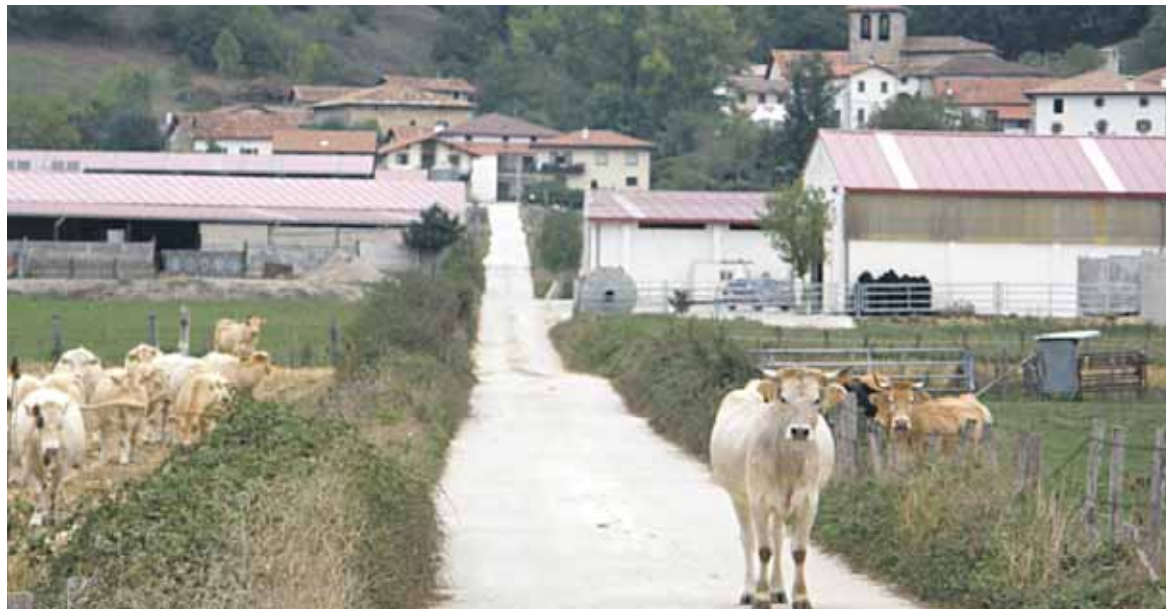
Irurtzungo bulegoan nekazari eta abeltzainei arreta eskaintzen zieten orain arte. Edozeinendako zerbitzua dute orain.

Sareko bederatzi bulego nagusietako bat Irurtzunen dago, Trinitate kalean (kamineroen parean). Han bi albaitarik eta hiru administratzailek lan egiten dute. Azken horietako bat astelehenetan Lakuntzako bulego laguntzailerak etortzen da (Saka-