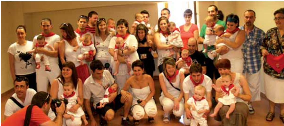
2012an jaiotako haurrei zapi gorria jarri zieten atzo Olaztin.