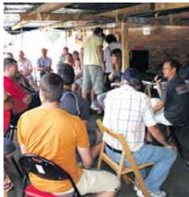
Langile ohiak ate ondoko aterpean.

Halaxe daude Inasako langile ohiak, lantegiko ate ondoko etxolan zain. Fabriketan ez dago mugimendurik, zaindaria besterik ez dago eta dena lasai dago. Bulegoetan, ordea, bada mugimendua. Gaur bertan hartzekodunen lehiaketako kudeatzailea eta inbertsiogilea bilduko dira. Bestalde, lehiaketako hori kudeatzen duen epailea oporretan dago eta agorrilean bueltatuko da. Bulegoetatik etorriko diren albisteen zain, bitartean