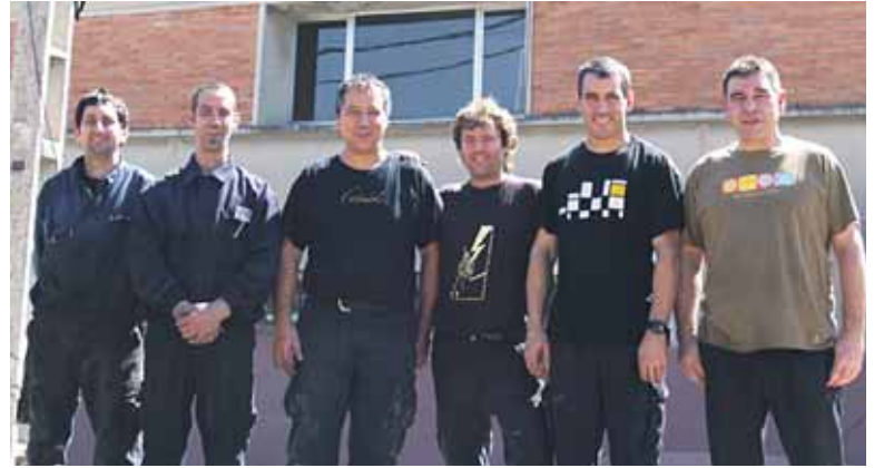
Enpresa berria martxan jarri duen seikotea.

Langileen jarduna aldatu da ere. Enpresan metalezko kurbaturaketa