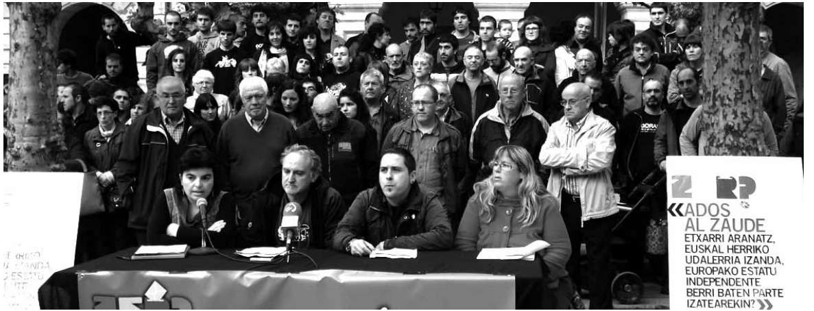
Udaleko eta ekimeneko kideek eman zuten prentsaurrekoa, alkate ohi eta etxarriarrez lagunduta.

Etxarri 2012+1 herri ekimenetik gogora ekarri zuten herri galdeketa sustatu zutelara, "aldarrikapen prepolitiko bat delako, oinarri demokratiko bat sortzearen aldekoa eta sentsibilitate guztien topaleku". Ekimeneko kideek gaineratu zuten, galdeketa "erabakitzeko eskubidearen defentsa jardun demokratikoa dela". Eta herri-tarrei bere etorkizuna erabakitzeko hitza ematea baino demokratikogorik ez dagoela adierazi zuten. Erabakitzeko eskubidearen aldeko atxikimendu pertsonal eta taldekakoak metatuz eta antolatuz jarraituko zutelara gaineratu zuten.