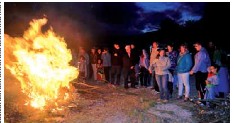
Izurdia gakoak, festetan. San Juan sua piztu zuten, Sakanako herri guztietan bezala.

Irurtzun Telebistaren aurkezpena. Garilaren 4an, ostegunean, 20:00etan Iratxo elkartearen. Lehen 3 saioak eta otamena.