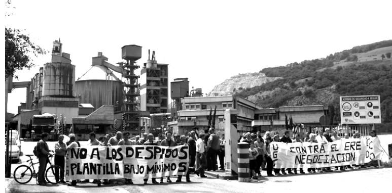
Herenegun taldearen 7 porlandegietako ateetan kontzentrazioak deitu zituzten UGTk eta CCOOk. ELAk ere kontzentrazioarekin bat egin zuen.