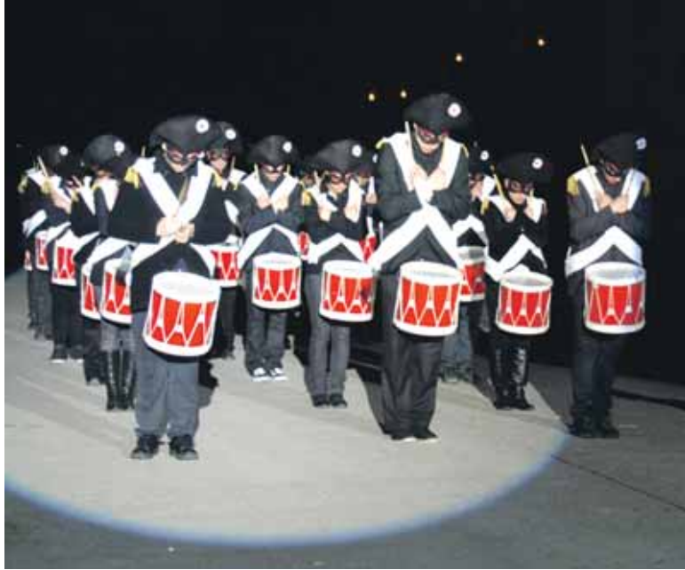
Napoleonen tropek izua ekarri zuten Arbizura.

Horixe antzeztu zen larunbatean Arbizun. Duela bi mendeko gertakariak gogoratuz, baina gaur egungo nahia ere islatuz. Hori erakutsi baitute makina bat arbizuarrek larunbateko ikuskaria aurrera ateratzerakoan eta haien herriko historiaz interesa azaltzerakoan.