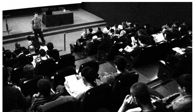
Gazte jende ugari bildu zen aurkezpenean.

Ostiralean azaldu zuten, "herri gisa duen nortasuna ezabatzeko, Euskal Herriko gainontzeko herrien modura Altsasuk Espainia eta Frantziako estatuen errepresio gogorra jasan du". Gehitu