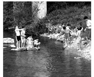
Gaztetxoak ibaian.

beharko, eskularru, zabor poltsak eta bestelakoak antolakun-