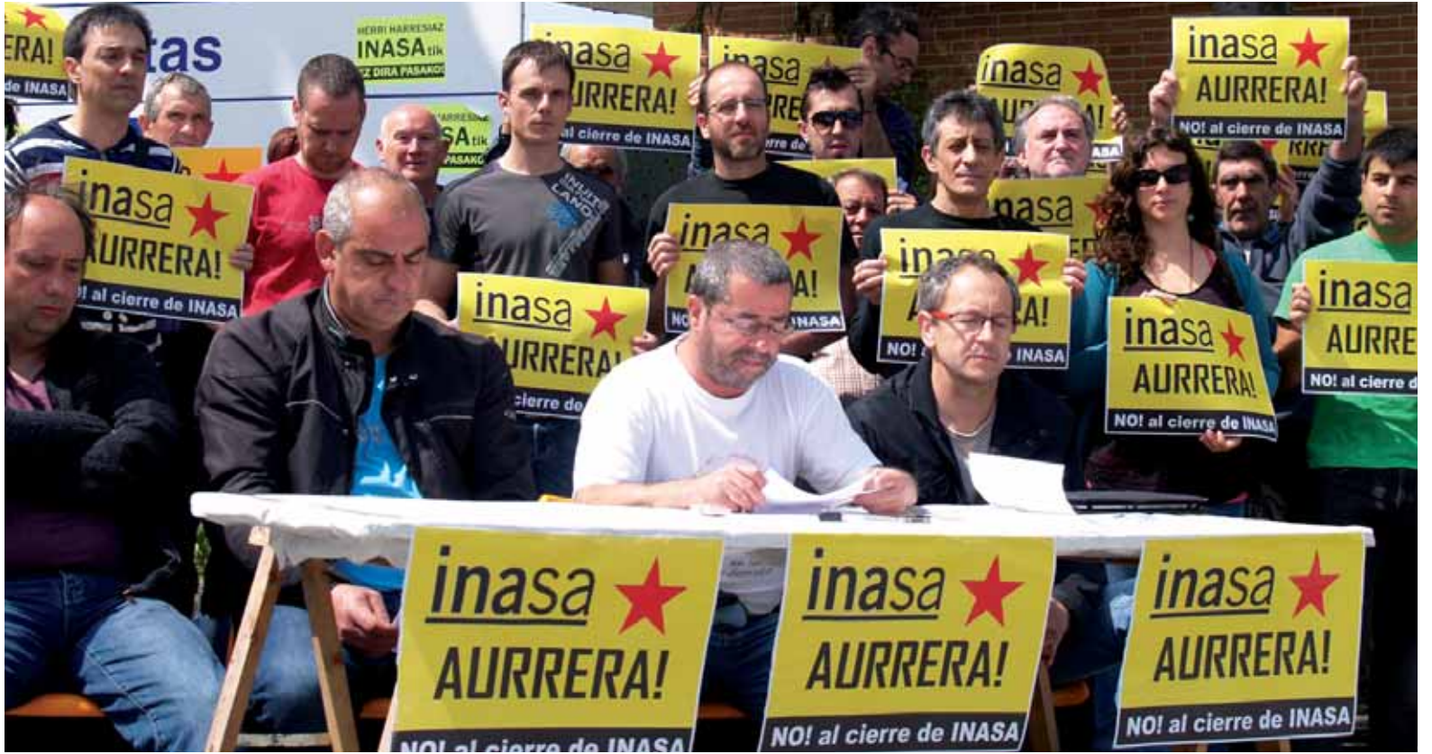
Inasako langile ohiek bihar eguerdirako manifestazioa deitu dute. Sakanako udalen eta Kirol, sindikatu eta gizarte eragileen babesa dute deitzaileek.

Larraun ibaia garbitzeko deialdia egin da biharko >>>7