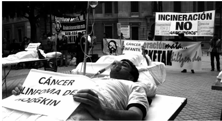
Errausketak sortu ditzakeen gaitzak salatzen 3MBk egindako protesta.

3MB-tik adierazi dute porlandegian egin beharreko berrikuntzak interes orokorreko izendatzea