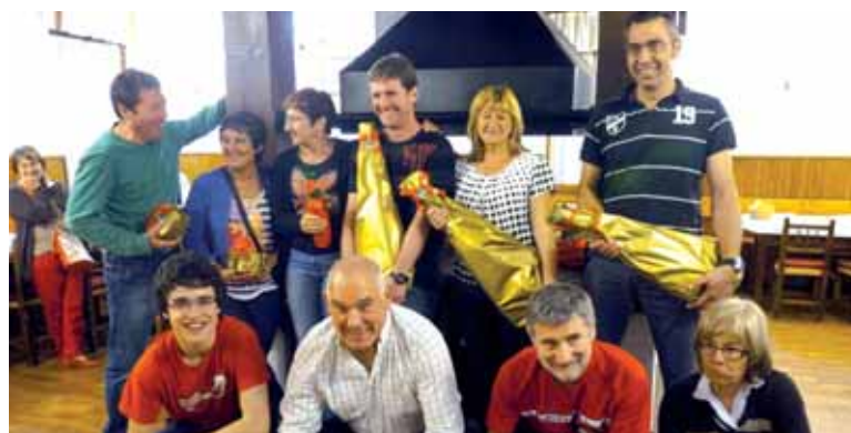
Iratxo Botxa Txapelketako sarituak. PATXI ALEGRE

Sorpresa emanez, Tirillas (Mari-Jabi-Alfredo) eta AHTrik Ez (Florentino-Marivi-Mikel) taldeek jokatu zuten finala, eta Tirillas talde-