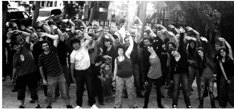
Flashmobean parte hartzea deitzeko lehen mugimenduak.

Dagoeneko aukeratu dute kantua: Lady Gagaren bat izanen da eta bakaikuarrek beraiek jarri diote