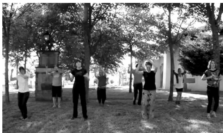
Makina bat etxarriarrek koreografiarekin bat eginen dute. UTZITAKOIA

Bihar toma bakarreen bideoklipa grabatuko da