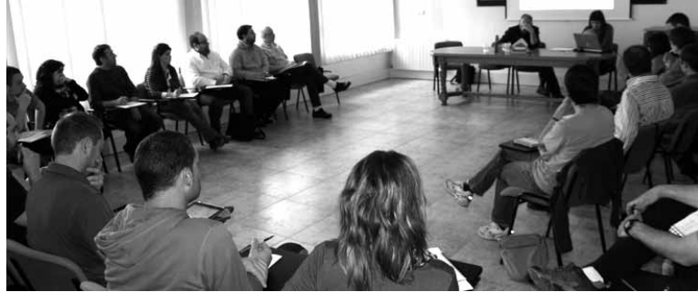
Behatokia eratu ondoren bilera gehiago egingen dira.