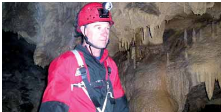
Espeleologo bat Urbasan.

Udako oporretan ez aspertzeko aukera paregabea eskaini du Sakanako Mankomunitateko kirol zerbitzuak: piragua ikastaroa eta espeleologia ikastaroa Sakanan bertan eta familian egiteko aukera. Aipatu bi ikastaroak uztailearen 28an burutuko dira, igandearrekin. Piragua ikastaroa goizeko 10:00etan egingen da, Arbizun edo Uharte Arakilen, ibaian. Aldiz, espeleologia ikastaroa Urbasako Laminatutu