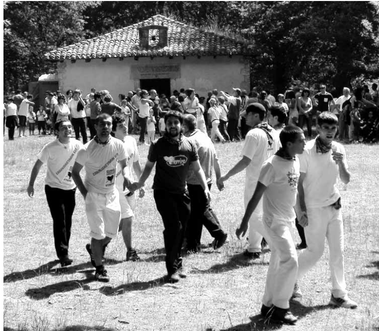
Aurten 25 urte bete dira San Pedro ermita berri zutela.

San Pedro Eguna 12:00etan Meza Nagusia. 13:00etan Luntxa.