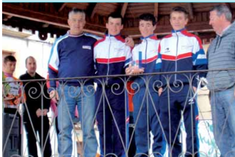
Igandean kadeteen proba jokatu zen Araian, I.L. San Pedro Saria, Euskadiko Txirrindularitza Txapelketa zena. Sakanako Aralar Txirrindulari Taldeak kadeteen lehen mailako taldekako txapelduna izan zen. Zorionak!