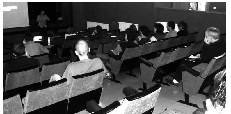
Hizlariaren azalpenak entzuten.

Handik sortutako egitasmoek ere lanean jarraitzen dute. Sakanan egiteko asko dagoela uste dutela-