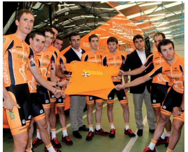
Elkarrizketa osorik www.guaixe.net-en .