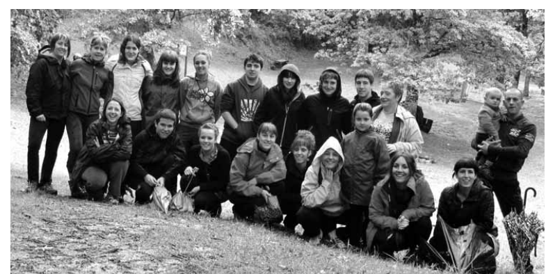
Batuekora igo ziren ziordiarrek. UTZITAKOIA

Ziordiko Gazte Asanbladak deituta herritar mordo batek eguraldiari aurre egin eta domekan Batueko iturrira joan ziren, baita ura edan ere. Garai batean iturri horren inguruan ziordiarrekin batera olaztiarrak, ameskuarrak eta lautadako jendea biltzen ziren. Ohitura hori berritzeko lehen urratsa izan zen San Juan bezperakoa.