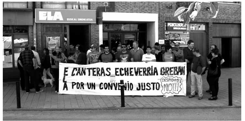
Gaur 115 egun egin dituzte greban langileek.

espedienterik aurkeztu “halako neurri zorrotzak hartzeko” eta ez delako adiskidetzeko-ekitaldietara aurkeztu. Horrek, parlamentariaren iritziz “horrela eskualdean garrantzitsua den enpresa baten etorkizuna argitzeko beharrezko elkarrizketari atea itxi zaio”.