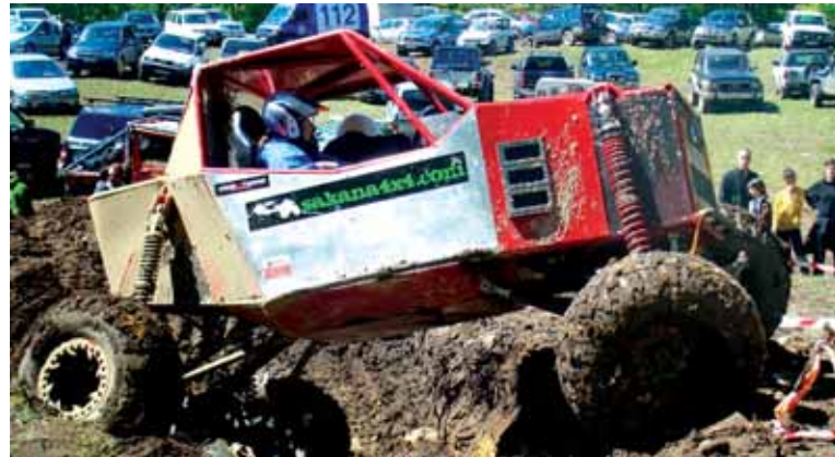
Rixitas prestatu berri duen autoarekin, 4x4 trial proba batean. SAKANA 4X4

Arbizuko industrialdean gauzatu da lasterketa, bihar, larunbatean, 16:30ean hasita. 20 pilotuk eman dute izena. Lauzprobost gune ezberdin prestatu beharrean, antolakuntzak 800 metro inguruko zirkuitu bat prestatu du, zuloz, aldapaz eta zailtasunez beteta, zabalagoa, autoek aurreratzeak