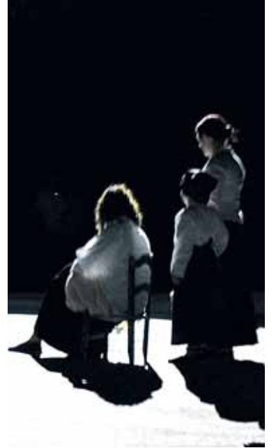
Arbizuar askok parte hartu zuten.

Napoleonen tropen etorrerarekin eta arbizuarren basorako ihesarekin hasi zen dena. Aire martzialak nagusitu ziren. Sua nabarmenduzengero, soldaduek herriari su eman ziotelako gauaren iluntasunean. Dolua azaltzeko garaian, erretako etxe bakoitzaren izenak errezitatu ziren. Aldi berean, emakume bana atera zen kandelana bana, esperantzaren sua, eskuan zutela. Su hori emanaldiaren akaberan piztu zen, herritarren itzulera, batasuna, elkartasuna eta herriaren berreraikitzea irudikatzean.