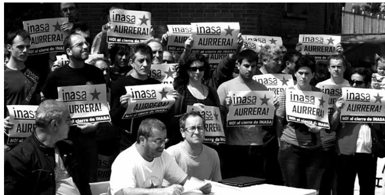
Udalen eta gizarte, kirol eta sindikal arloko eragileen babesa dute langile ohiek.

Proposamenaren berri izan bezain laster Inasako langile ohiek Merkataritza-arloko epailearen-