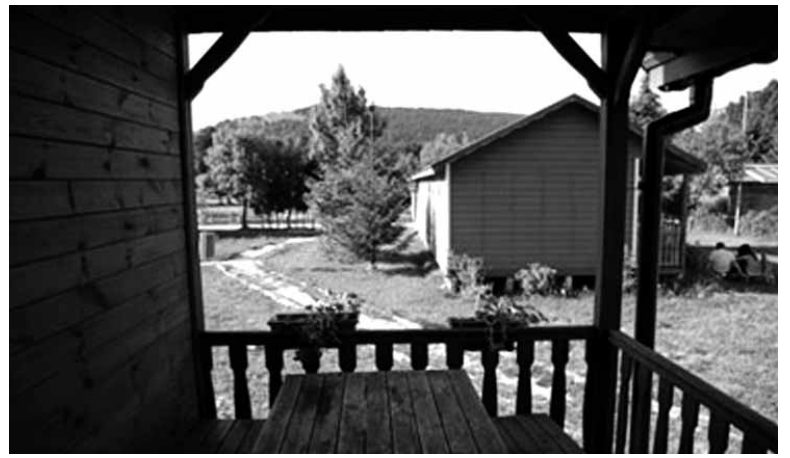
14 bungalow ditu kanpinak.

Haiek ere zuraren egoera hobetzeko 2 urteko epe eman diote beren buruari. Kanpina martxan jartzeko 80.000 euroko inbertsioa egingen dute bi bazkideek eta hurrengo