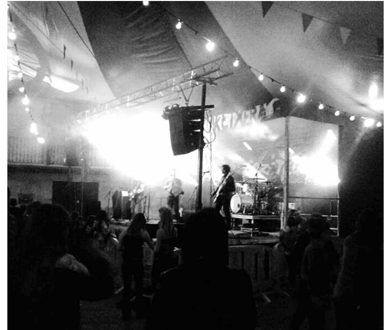
Giro bikaina jarri zuen Gozategi taldeak Arbizuko plazan.

11:00etan Buruhandiak margotzeko tailerra. 12:00etan Etxajua eta festen hasiera El Cohete txarangak alaitua. 13:00etatik 14:00etara Trikipoteoa (Urdaingo gazteek antolatuta). 13:00etatik 15:00etara Kuadrillen arteko kalderete txapelketa. (Suak Udalak jarriko ditu). 17:00etan Kuadrillen arteko herri kirol txapelketa. 20:00etatik 22:00etara Drindots taldearekin dantzaldia. 22:00etan Euskal Presoen aldeko herri afaria. 1:00etatik 4:00etara Drindots taldearekin dantzaldia.