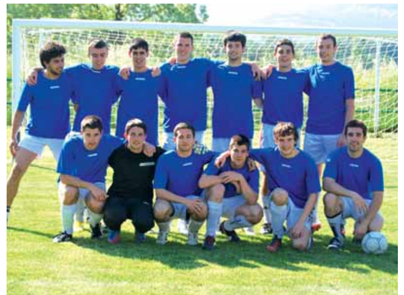
Lakuntzako Karrotillo taldekoak 6.ak sailkatu dira. UTZITAKOIA

Bihar, larunbatean, 19:00etan 3. eta 4. postuak erabakitzeke partidak jokatu dute Arakilgo Rajatablak eta Irurtzungo Guanlarrazek. Giro lehiatu berezia espero da, derby itxurakoa. Baina lehenago emakumezkoen futbolaz gozatzeko aukera izango da Izurdiagako futbol zelaietan, 17:00etan, Toldos Berriainz eta Orkoiengo Kirol Sport taldeen arteko lehia jokatu ko baita.