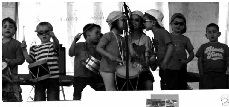
Iraila-lastailerako jarriko dituzte parkeko altzariak eta han jolastuko dute.