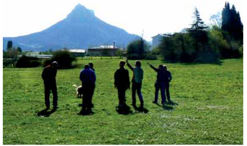
Herri baratza hartuko duen Etxarriko lurra.

Etxarri Aranatz: garagarriak 28; gailak 4; irailak 7, 14, 21 eta 28 eta otsailak 8, 15 eta 22. Altsasu: garagarriak 25 eta 27; irailak 24 eta 26; lastailak 1, 3 eta otsailak 6, 13 eta 20. Ikastaroak 16:00etan hasiko dira.