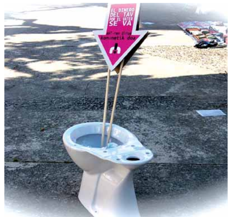
Larunbatean komunak agertu ziren ibarreko 5 herrietako toki publikotan.

300 milioi euro aurreratu ditu jada, eta 45-60 milioi arteko maileru baten interesak ere bere gain hartu ditu, eskandalo ikaragarria beraz". Mugimendutik egitasmoaren bestelako ondorioak ere aipatu zituzten: "ingurumenean eragiten duen txiki-zioa, energia kontsumo andana, lurralde antolaketan sortzen duen desoreka eta duen gastu ekonomikoak diru publikoaren dako egitasmo jasanezina bihurtzen dute".