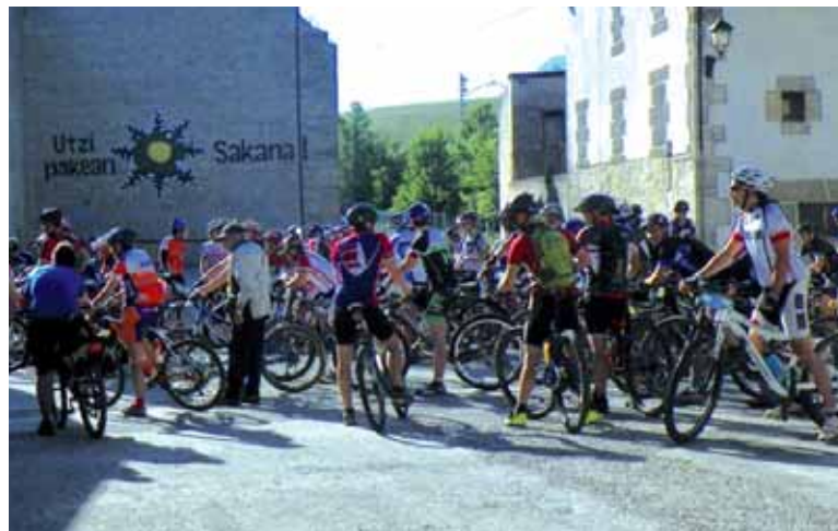
Txirrindulariak Uharteko Arakilen, proba hasi baino lehen. ERKUDEN RUIZ

Txirrindulariei izugarri gustatu zitzaien proba. "Gogorra eta oso ederra iruditu zitzaie, bereziki Beriaingo zatia. Guk balorazio positiboa egiten dugu" gaineratu du