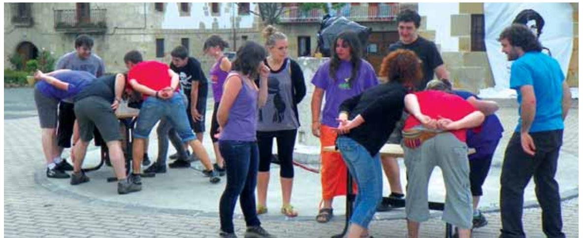
Bakaiku eta Iturmendi herri olinpiadetan neurtu ziren. ERKUDEN RUIZ BARROSO

Independentziaren aldeko ekitaldiak izandako Nekane Jurado ekonomilariaren hitzaldiarekin hasi ziren, ostiralean Bakaikun. Gaur egungo krisi ekonomikoak