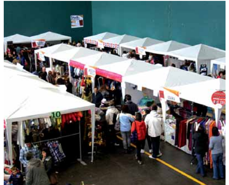
Dendak, atzera ere, kalera aterako ditu Altsasuko Dendarien Elkarteak.

Postuak itxi ondoren, 20:15ean, bere bi sarien zozketa eginen du ADEk. Atzora arte elkarte-ko kide diren establezimenduetan 6 eurotik gorako erosketak egiten dituz-