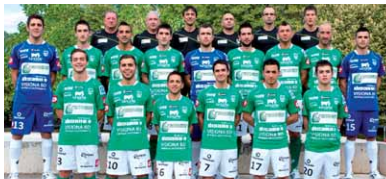
Plantillan aldaketak egongo dira.