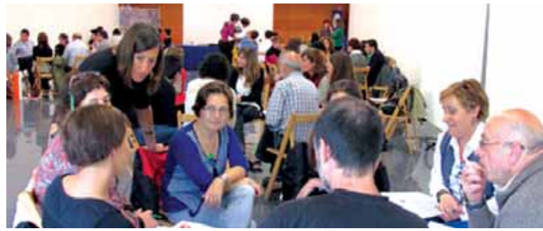
Kedadan lan taldeka ere aritu ziren parte-hartzaileak.