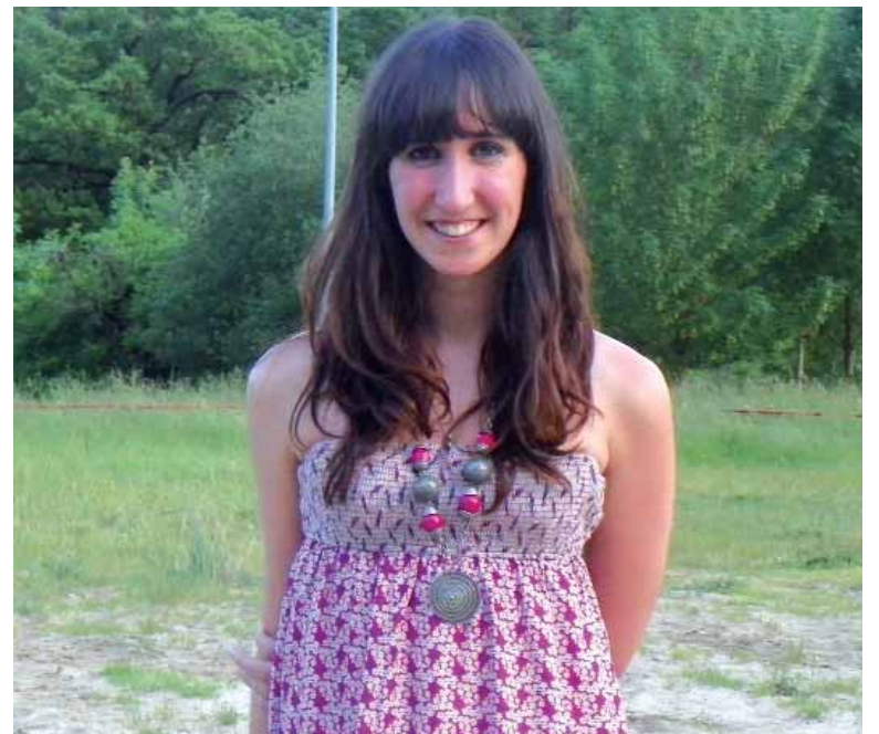
Elkarrizketa osorik: www.guaixe.net-en .