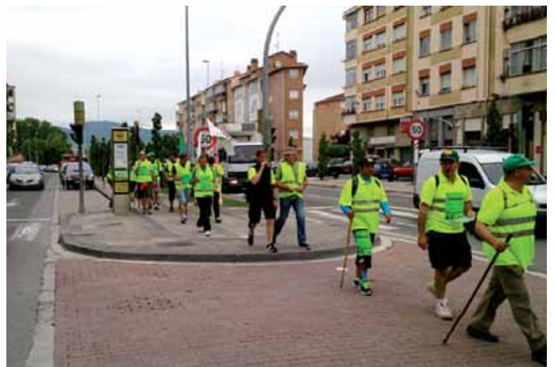
Langileak Berriozarren, Iruñerako bidean. UTZITAKOIA