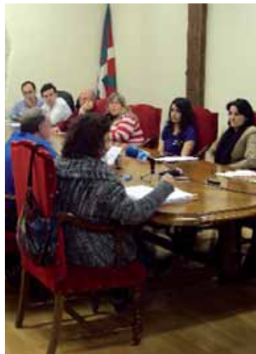
Udal bilkura.

Koalizioak herri galdeketa- ren aldeko bere jarrera berretsi zuen.