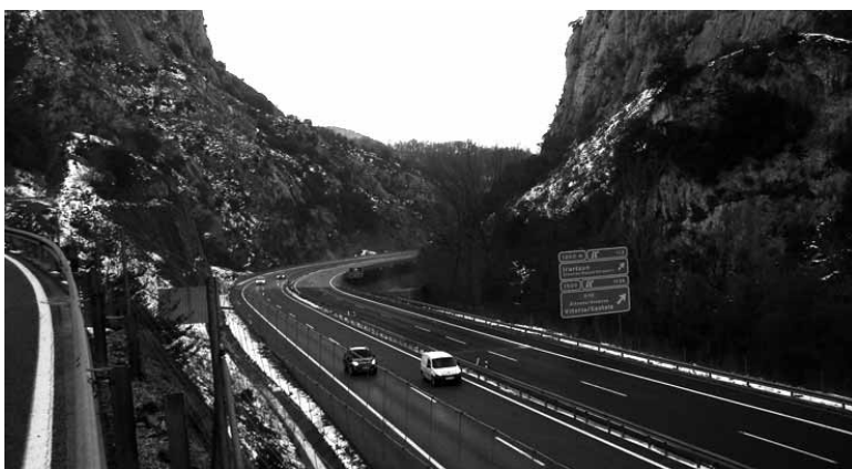
Trafikoa Leitzarango Autobian, Biaizpen.