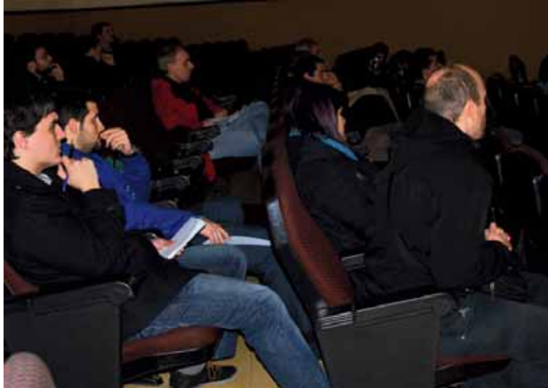
Sakandarrak adi Etxarriin egin zen topaketan.

Sakantzen Sareak jardunaldiaren antolaketan Landa Garapene-