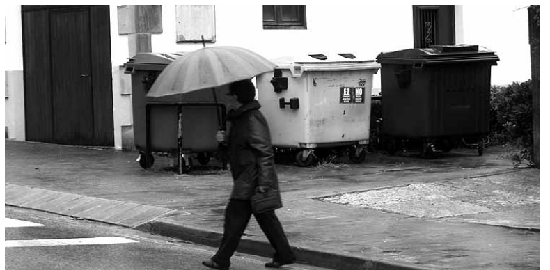
Irurtzunen 6 hilabete gehiagoregonen dira edukiontzia.

Arbizun 258 arbizuarren sinadura jaso zituen Arbizuarra Plataformak. "Udalak inposatu nahi digun atez ateko sistema" ez dute la onartzen azaldu zuten. Ezarpenarako "kostu izugarriak" salatzeari batera, sistema berriak "eragozpen gehiago, eta norberaren intimitatearen eta pribatasunaren inbasio izugarria" ekarriko duela ziurtatu zuten. Hondakin organikoekin higie eta ingurumen ondorioak izan ditzakeela ustetu dute plataforman. Haiek biogas plantetan tratatzea proposatu dute. Ssistemka herriaren estetikan izanen zueneraginaz ere kezka azaldu zuten. Hondakinen bilketa sistemaren aukeraketan parte hartzen utziez zietelako kezka ere ziren, baita ezarpen prozesuaren azkartasunaz. 5. edukiontzia jartzea eskatu zuten.