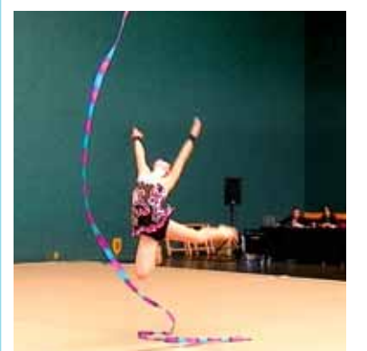
Zintarekin lanean. ERKUDEN RUIZ