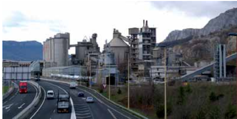
Porlandegian 150 langile zeuden 2012an eta orain 93 gelditu daitezke.

Erabakia gauzatuko balitz, Olatzagutiko ikerketa, garapena eta berrikuntza departamentua itxi egingen litzateke (16 langile) lantegiko 10 langile kaleratuko litzuzke, harrobiko langile bakarria eta pertsonal eta segurtasun arloetako bana ere bai. Bestalde, urteko 550.000 tona ekoizteko gaitasuna duen lerroa itxiko luke (besteak 700.000 tona urteko gaitasuna du). Aurten 340.000 tona inguru ekoiz-