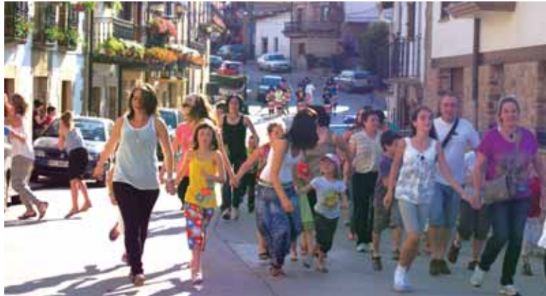
Igandean entsegu orokorra egin zuten. Gastuak estaltzeko kamixetak eta beste salduko dituzte eta zozketak egingo dituzte.

Ondoko herrietako laguntza izan dute. Lakuntzako Pertza elkarteak danborrak utzi dizkiete. Emausko trapuketariak deabruak eta danborroek erabiliko dituzten txaketa guztiak utzi dituzte. Etxarriarrek muntaietan eta lagunduko dute egunean. Bakaikuko Kikek zaldiak eta astoak ekarriko ditu. Guztieieskerak eman dizkiete.