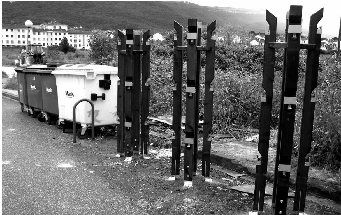
Zintzilikarioak jartzen ari dira Uharten, Lakuntzan, Arbizun, Etxarrin, Bakaikun, Iturmendin, Urdiainen eta Olatzin.