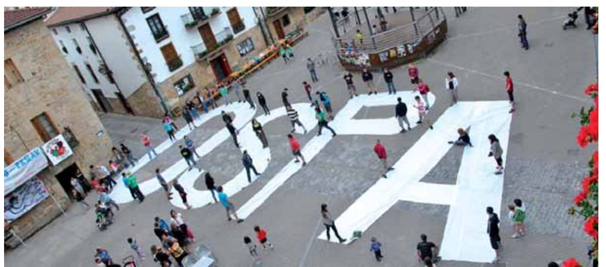
Errepresio indarrak alde egiteko eskatu zuten larunbatean.