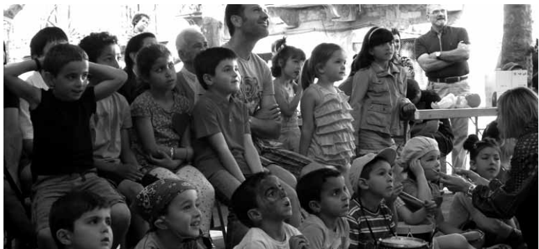
Eguneko protagonistetako batzuk haurrak izan ziren