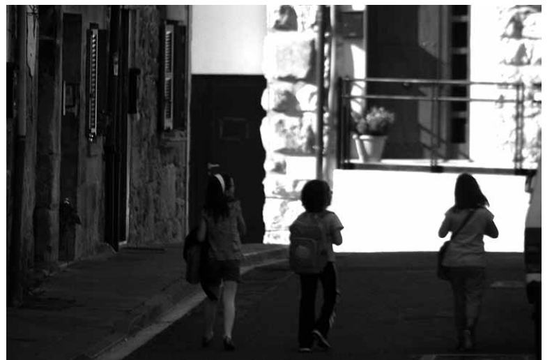
Ikasleak musika eskolako bidean.

Hezkuntza musikala, kantua, akordeoia, txistua, tronboia, tronpeta, bonbardinoia, saxofoia, gita-