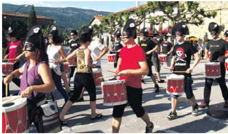
Gaiaren historia liburua, elektro-sinfoniaren CDA eta ipuina argitaratu dituzte.