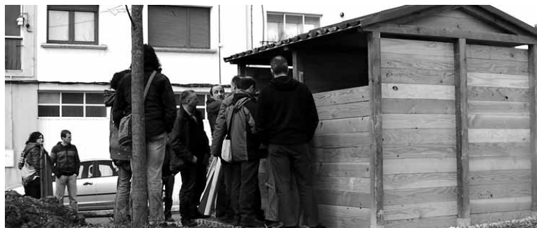
2.000 pertsonak auzo-konposta egiteko izena eman dute.

Estudio Arquitectura eta Talleres Irulizar. Hondakin sistema berriak 9 lanpostu sortu ditu.