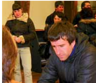
Etxarriarrak sinatzen. ERKUDEN RUIZ

lerri modura Europako estatu independente berri baten barnean sartzearekin ados al zaude? Nafarroako Gobernuak herri-galdeketa eragotzi eta Etxarri Aranatzko Udalaren erabakia bertan behera utzi nahi duela salatzeke gaur prentsaurreko jendetsua deitu da. Etxarriarrak bertan parte hartzea deitu dituzte udaletik eta ekimenetik.