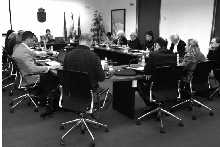
Nafarroako Parlamentuak batzorde batean Sakanako hizpide izan zen.

nahikoa izan azken puntua onartzeko. Mank-i eskatzen zitzaion hondakin biltza berrirako dirua aurrekontua jarduerako ekonomikoa eta enplegua sustatzera bideratzea. Bestalde PPk ez zuen onartu Geroa Baiko haien mozioari aurkeztutako zuzenketa.