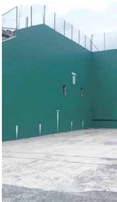
Ihabarko frontoia berritu da.