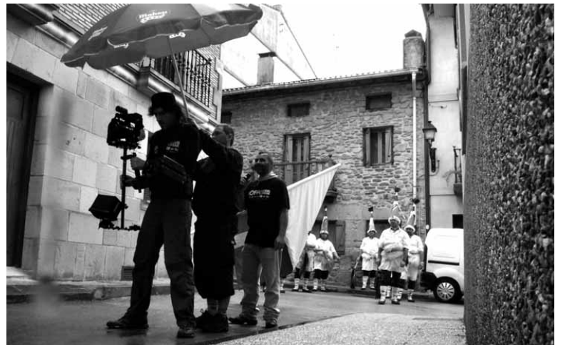
Pasa den urtean Herri Askeak lip dub-a grabatu zuteneko.