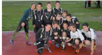
ZORIONAK TXAPELDUNAK! Nanclareseko Futbol 7 txapelketan txapeldunor-deak izan zarete. Esker mila hain egun hunkigarria eskaintzeagatik!! Hoberenak zarete!!