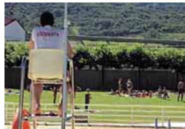
Soroslea igerilekua zaintzen.

Ordu-tegiari dagokionez, agorriaren 19tik irailaren 6ra arte izanen da ikastaroa, astelehenetik ostiralera goizeko 10:00etatik 14:00etara. Ikasleek gutxienez 14 urte eta gehienez 22 izan beharko dituzte. Ikastaroaren prezioa 430 eurokoa da, eta aipatzekoa da diru