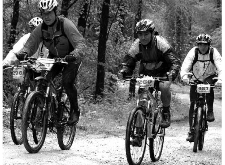
Altsasun euria egin zuen baina iganderako eguraldi ona iragarri dute. ANA VILCHES

Partaide guztiek martxako kamiseta jasoko dute opari. Horretaz aparte, dortsalen zenbakiarekin ondoko sariak zozketatuko dira: Uharte Arakilgo Gari Gutxi lan-