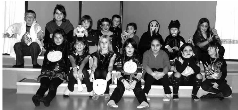
Olaztin mozturro festa egin zuten Larunblaiok. UTZITAKOAK.

Sakanako Mankomunitateko Euskara Zerbitzuak Bakaiku, Iturmendi, Urdiain eta Olatzagutiko udalekin batera gaztetxo eta gazteendako aisialdi programa antolatuz, haien artean euskarazko harreman sareak sortu eta indartzeko. Topaguneak kudeatu du programaren martxa eta taldeek hilaren erdialdean despeditu dute ikasturtea.