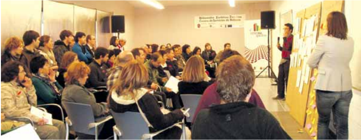
Ekintzaileak eta enpresetako ordezkariak biltzeko deialdia egin du Cederna-Garalurrek.