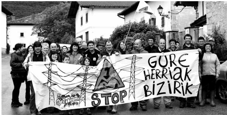
Ibilbidea egin ondoren Satrustegin bazkaldu zuten. UTZITAKOIA

Arakil eta Iza lotu zituen igandean, euripean, mendi martxa batek. Bi ibarretako herritarrez aparte Euskal Herriko beste zenbait tokitatik etorritako mendizaleak egin zuten ibilbidea, 29 guztira, hasieran 50 inguru bazeuden ere. Goi tentsioko linearen ibilbidea eta haren ondorioak zein liratekeen