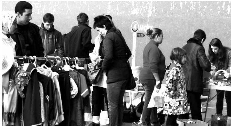
Bigarren eskuko azoka eta hainbat jarduera gehiago izanen dira bihar.

Lakuntzarrek beraiek irudikatutako parkea egiteko finantziazioa behar da eta hori da biharko egunaren helburua, parke berri bat egiteko dirua biltzea. Izan ere, zinemako lanek herria haurrendako jolas parkerik gabe utzi zuten.