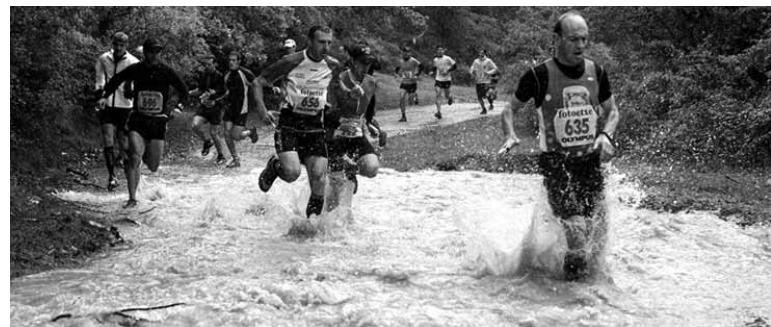
Ura eta lohia izan ziren protagonista. Sarritan bideak errekek ziruditen.