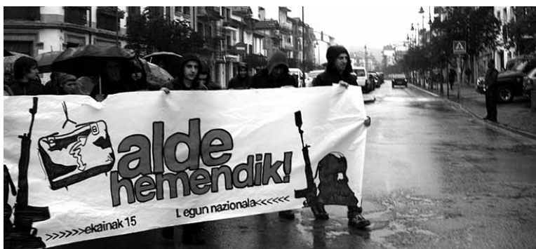
Manifestazioa Guardia Zibilak zainduta.

Berria egunkariak asteartean argitaratu zuenez, azken hiru urtetan gora egin du Espainiako Poliziaren eta Guardia Zibilaren agenteen kopuruak Hego Euskal Herrian.