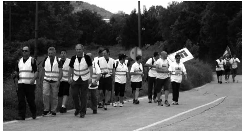
Herenegungo beroaren ondoren eguraldi freskoarekin hobe ibili ziren.

zuten haiek negoziatzeko prest daudela, greba hasi bezperan euren proposamena aurkeztu ziotela zuzendaritzari, gutun bidez ere saiatu direla euren negoziatzeko prestutasuna azaltzen, "baina zuzendaritzaren aldetik ez da inolako pausurik eman. Ez dute boron-daterik". Eta ez dela diruagatik nabarmendu dute. Langileek azaldu dutenez, grebak iraun duen bitartean harri-lubetarako 20.000 tona atera dira, eta 80.000 tonako lana hartu dute.