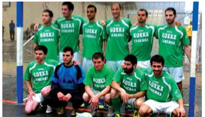
Bar Koxka taldekoak.