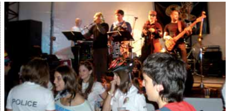
Bestelako dantzaldia egongo da Hiriberri.

Garagarriaren 15ean, larunbatean, 11:00etatik aurrera Lakuntzan.