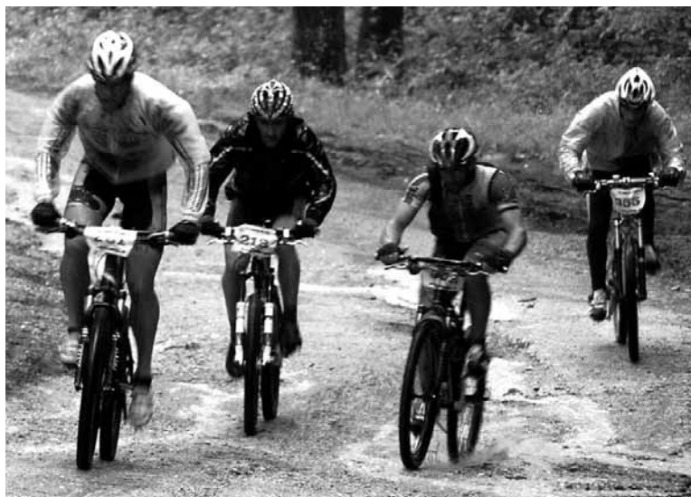
Ibilbidea guztian barna egin zuen euria baina gustura ibili ziren.