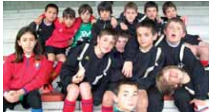
ZORIONAK TXAPELDUNAK! Nanclareseko Futbol 7 txapelketan txapeldunor-deak izan zarete. Esker mila hain egun hunkigarria eskaintzeagatik!! Hoberenak zarete!!