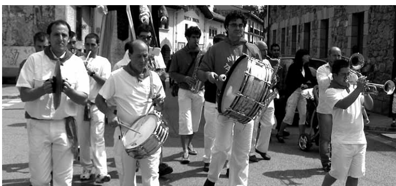
La Cigarra txarangako musikariak festetan.

Hilaren 28ra arte egonen da zabalik, udaletxean. Informaziorako 948 468 128 telefonoa edo olaztimusika@gmail.com e-posta