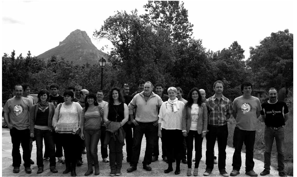
Enplegu tailerreko parte-hartzaileak agintariek batera.