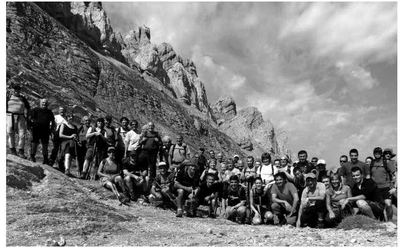
Larrañetakoek aurreko urtean Pirinioetara egindako irteera.

Sakanako Mendizaleak mendi ibilbidea antolatu du San Juan bezperan, garagarriaren 23an. Nafarroako Lapoblación (1.245 m) mendia igotzeko asmoa dute. Autobusa goizeko 7:00etan aterako da Olaztitik eta geldialdiak egingo ditu Sakanako gainontzeko herrietan, mendizaleak eramateko. Izena ematea zabalik dago ostegunera arte ohiko tokietan edo 636 827 166 telefonoan.