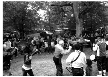
Jan, edan eta dantza. Festa osoa.