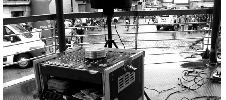
Soinu ekipoa kirol proba baten hasieran erabiltzeko prest.

Herritar guztiei zabalduko jarduera bat garatu behar duten eta