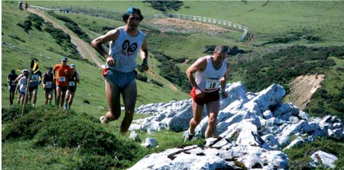
Aralarko paraje zoragarrietan barna ariko dira mendi korrikalariak.

Lakuntzako Aralar mendizerraren bihotzean egiten den lasterketa da (28,5 km, 2.308 m desnibela). Korrikalariak 9:30ean abiatuko dira Lakuntzako plazatik. Atazar-