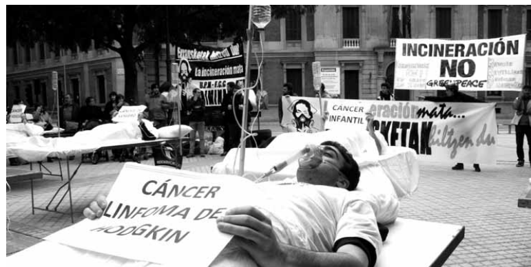
Errausketak gaitzak sorrarazten dituela irudikatu zuten.

Jakinarazi zenez, "hondakinak errausten dituen zementu-fabrikak