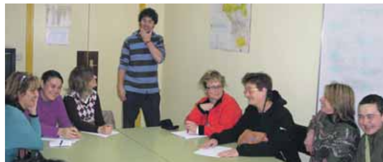
Zelandi eskolan izan zen saioetako bat. UTZITAKOA

Sakanako AEK-k ordu bateko doako euskara bi eskola saio eskaini ditu