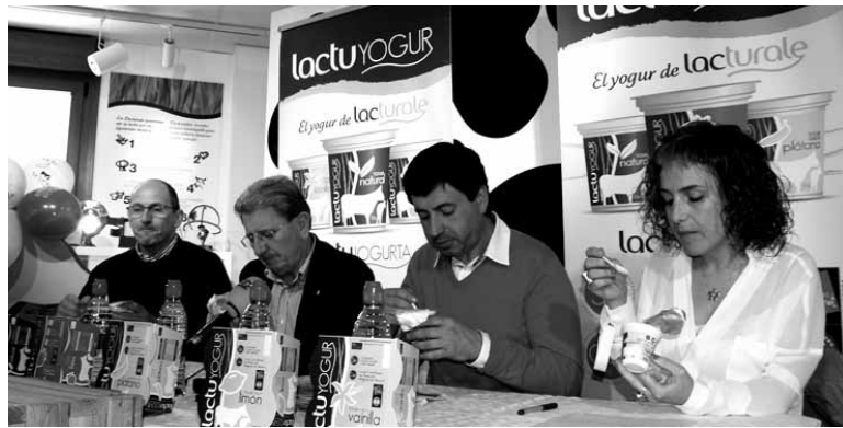
Naturala, marrubia, limoia, platanoa eta banilla zaporeko Lactuyogurrak daude.

turaleren enpresa filosofia laburtzeko: "egitasmoa kontsumitzaileari errespetuan oinarrituta dago, kalitate irisgarria eskainiz; ingurumena errespetatuz, ekoizpen prozesu jasangarria erabiliz eta, azkenik, gizartearekin errespetuan, gauden tokian aberastasuna sortzea izan baita gure konpromisoa".