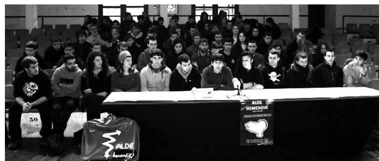
Frontoian aurkezpena eta kalean Guardia Zibila zegoen PPko en aktoa zaintzen.

Azken eskaera instituzioendako, "gatazkaren konponbidean