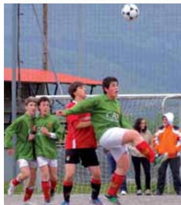
Derbya oso estua izan zen.