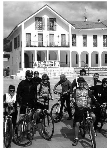
Berriki bizikletan protestatu zuten.

Ahalik eta auto gutxien erabiltzeko Irurtzango Pikuxarren gelditu dira. Handik 8:45ean aterako dira. Abiatu aurretik, Otsobin gosaria izanen da. Bizkai lepoan geldialdia egingen dute. Ibilbidea Satrustegin despidituko dute, herri bazkari batekin. Mendi martxari, besteak beste babes azaldu diote: Arakilgo Udalak eta Errotzeko, Izurdiagako, Urritzolako, Ekaiko, Zuhatzuko eta Satrustegiko Kontzejuek. + www.guaixe.net