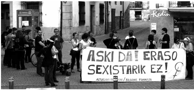
Eraso bakoitzaren biharamunean, 19:00etan, kontzentratzen dira.