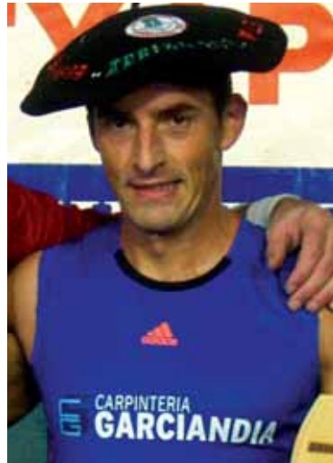
Txapel bilduma gehitu du Nazabalek.

Etxarriarrak sekulako palmaresa du. Igandekoarekin 8 Urrezko Aizkora irabazi ditu, egungo Euskal Herriko Maila Nagusiko txapelduna da (6 txapela ditu) eta Nafarro-