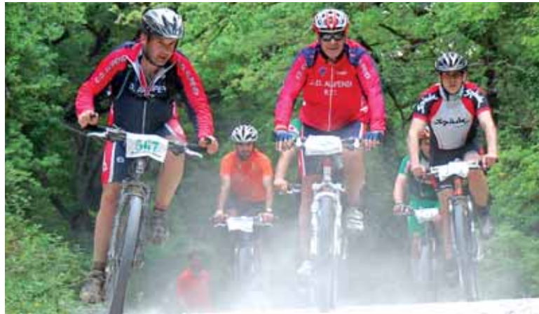
Txirrindulariak gustura ibiliko dira prestatutako zirkuituan.

Txirrindulariak goizeko 9:00etan aterako dira Altsasuko plazatik. 43 km dituzte aurrez aurre. Hasieran Sorozarretara joko dute. Segidan Urdalurko urtegitik pasako dira, handik gora Ziordia eta Olazitiko