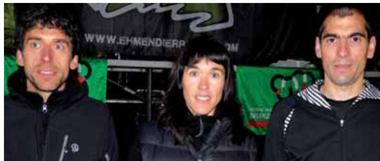
Martiarena, Larrañaga eta Arrieta saria jasotzen, Leitza.

Aralar Mendiko korrikalariak puntan daudela ezin da ukatu, eta