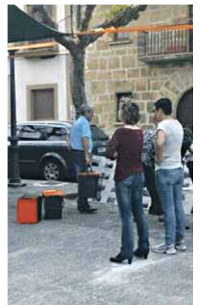
Lakuntzan ontziak hartzen. UTZITAKOIA

bulegoetan jasotzeko aukera izanen dute. Hondakin bilketari buruzko bulegoak 10:00etatik 20:00etara zabalik izanen baitira.