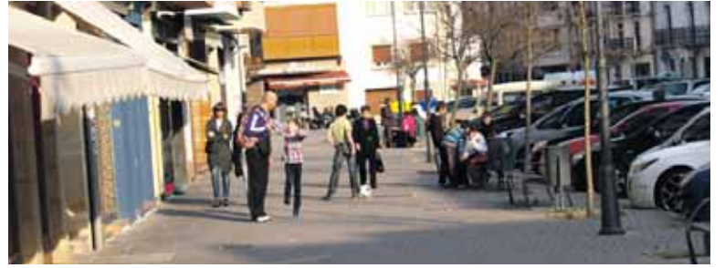
Jendeak denda txikietan erosketak egingen ditu, haiei bultzada emateko.

eta gozatzeko gogoia besterik ez da behar" azaldu digu Abian-ekokide batek. Gaurko deitu duen cash-mob-arekin Altsasuko denda txikietan "eragin positiboa sortu nahi dugu, ongi pasatzen dugun bitartean". Parte-hartzaile bakoitzak zehaztuko du zenbat diru gastatu behar duen. Ez du asko izan beharrik. Parte hartzeko deia egin dute.