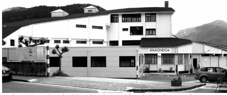
Orain arteko ordutegi aldatzeko 8 boto gehiago behar ziren gutxienez.