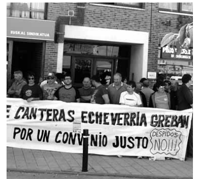
Langileak asteazkenean bilkuran.

egon eta elkartasuna adierazteko. Azken etapa heldu den ostiralean egingen dute Sarasa eta Nafarroako Parlamentuaren artean. Hara eguerdian iritsi eta alderdiekin harremanak mantenduko dituzte. Lazaro Echeverriako langileek gonbitea luzatu diete sakandarrei haien martxara batzeko.