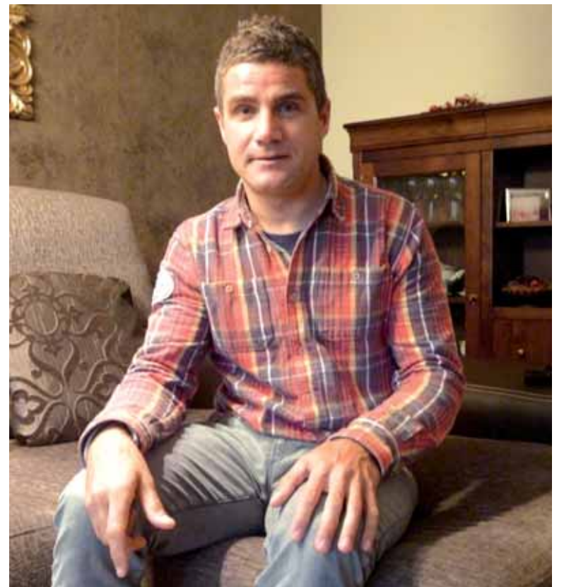
Elkarrizketa osorik: www.guaixe.net-en .