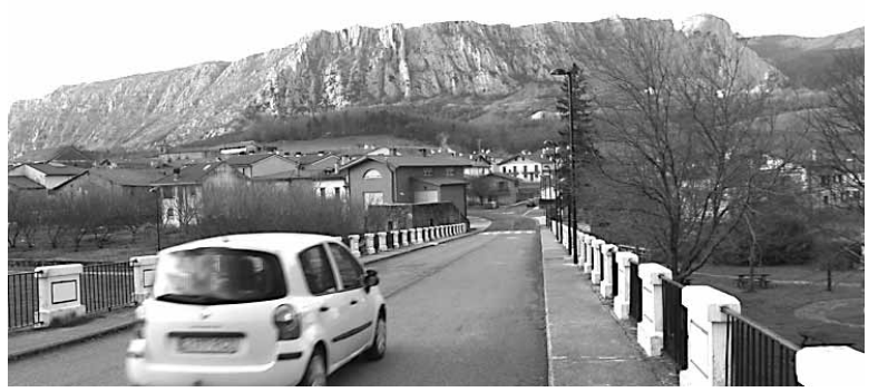
Ziordiko Udalak ez du inbertsiorik eginen.

Aurten udalak 300.055 euroko aurrekontua izanen du. Jesus Arrese alkateak azaldu digunez,