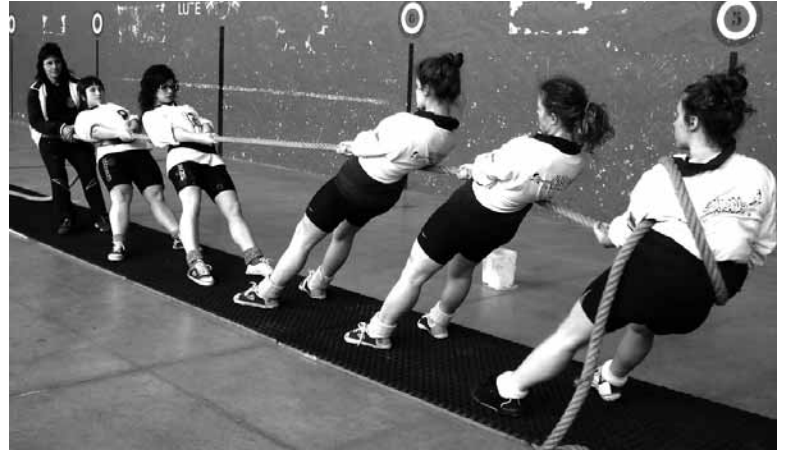
Sakana taldeko neskek, lehia baino lehen beroketa egiten.

Kadeteetan (280 kilo), Berriozar A nagusitu zen azken jardunaldian, Andra Mari ikastolarena aurretik. 4 jardunaldietako puntuak batuz Berriozar A izan zen lehena (19 p.), Andra Mari (17 p.), Ultzama (10,5 p.), Berriozar B (9,5 p.) eta Andra Mari ikastolatik sortutako Beriain (4 p.) taldeen aurretik. Lehen bi