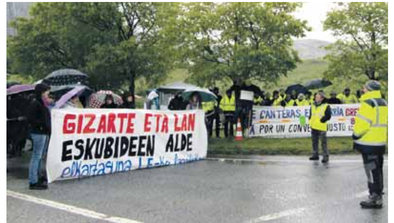
Ziordian Lazaro Echeverriako langileei elkartasuna azaldu zieten.

beharra aldarrikatu zuen. Klase gatazka gaur inoiz baino nabar-