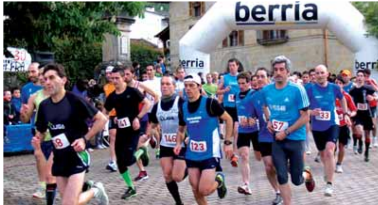
Aitzkozar lasterketaren irteera.

Aurten, Irurtzango Aitzkozar elkarteak eta Bakaikuko Baka-rrekoetxea elkarteak elkarlanean antolatutako 9. Aitzkozar Herri Krosak Iturmendi izan zuen irteera eta helmuga.