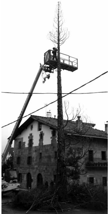
Garabi baten laguntzaz moztu zuten.