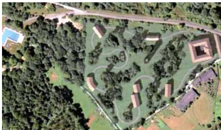
Itxura hau izanen luke Enneco, haritzaren memoria interpretazio zentroak.

Etxarriko Udaleko aholkulari juridikoak eta alkateak azaldu zuten Ingurumen Departamenduan ez dutela eragozpenik ikusi proiektua egiteko. Jasotako proposamena egingarria dela ikusita, udalak osteguneko batzarra deitu zuen, proiektuaz informatzeko eta herritarren iritzia jasotzeko.