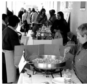
Arroza, bakarra. Prestaketa, anitza.

Ekimena beste herrietan garatzeko herritar talde bat biltzea besterik ez da behar