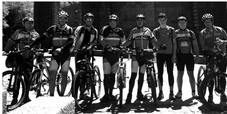
Taldea Arantzazuko santutegiaren aurrean.