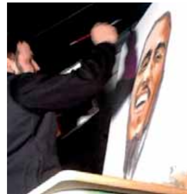
Kale, kontzertuetan margotzen.

Parkea Martxan-ek ekainaren 6an “haurtzaroren kultura” lelopean gurasoendako hitzaldia antolatu du eta ekainaren 15ean Parkearen eguna. Buruhandiak eta erraldoiak, Irrien Lagunekin talo tailerra eta haurren ikuskizunak izanen dira.