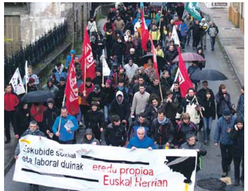
Altsasuko goizeko manifestazioa.

menago ageri dela azaldu zuen Uhartek eta haien erronka “ofentsibara jendea batzea eta Euskal Herriak behar duen aldaketa gauzatzea” dela.