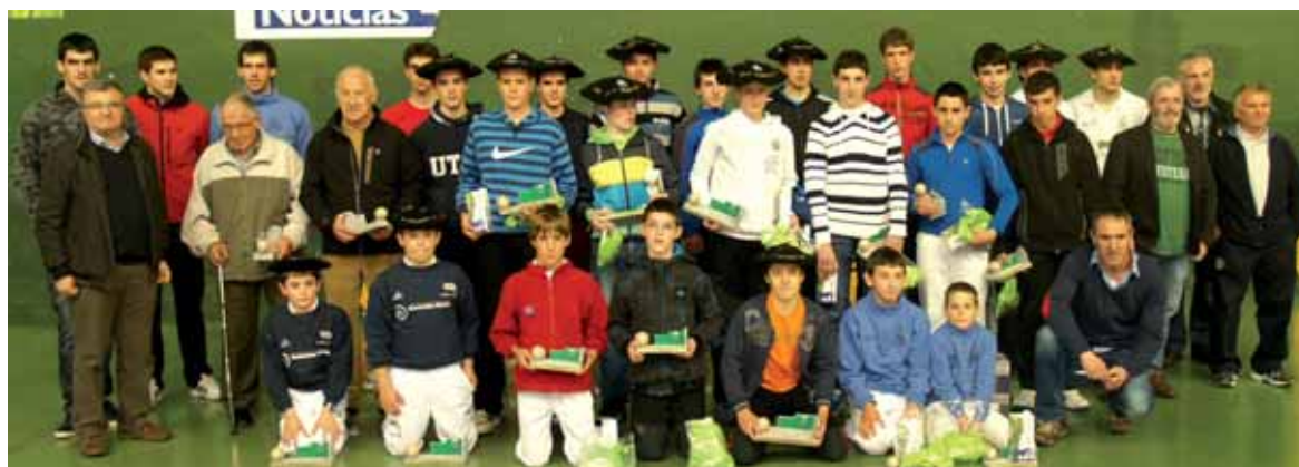
Finalista guztiak, Irurtzun klubeko kide, omendu, pilotari eta udal ordezkariekin.