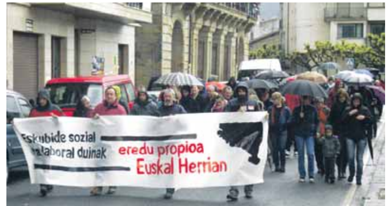
Etxarriko goizeko manifestazioa.