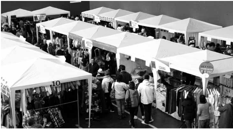
Garagarrilaren 22an, larunbatekin, azoka izanen da Iortia kultur gune aurrean.

Garagarrilaren 5etik 20ra ADEko kide diren establezimenduetan 6 eurotik gorako erosketak egiten dituzten guztiek txartel bat jaso-