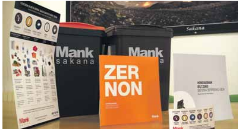
Mankomunitateak hondakinen bilketa berria azaltzeko materiala prestatu du.

Uharte Arakilen, Lakuntzan, Arbizun, Etxarri Aranatzan, Bakaikun, Iturmendin, Urdiainen eta Olatzagutian hasiko da banaketa