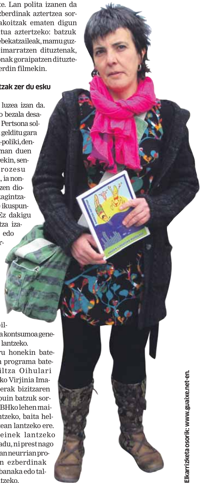
Elkarrizketa osorik: www.guaixe.net-en .

Edozeinek lantzeko asmoa badu, ni prest nago ahal dudana neurrian proposamen ezberdinak jaso eta banaka edo taldean lantzeko.