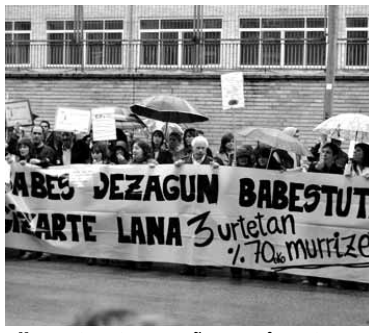
Elkarretaratzea Iruñean egin zuten.