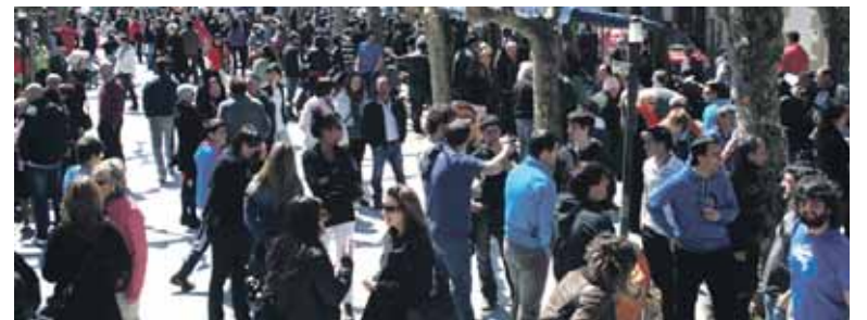
Jende asko erakarri zuten Ama-Lur azokaren baitan aurkeztu zen proiektuak.

Trukerako erabiliko dituzten bertako haziak jasotzen hasi da talde sus-