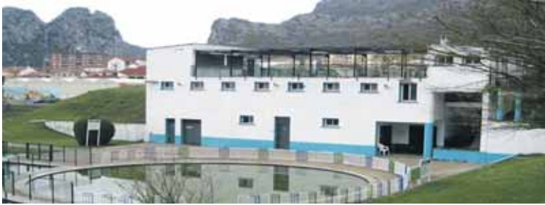
Igerilekuko merenderoa hobetzen ari da orain udala. Lan gehiago egon litezke.