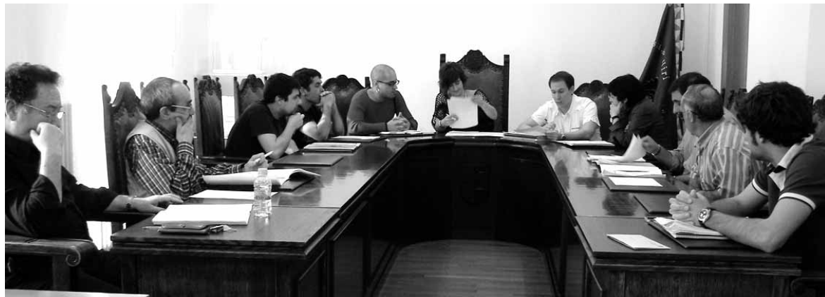
Altsasuko hautetsiak aurreko bilkura batean.