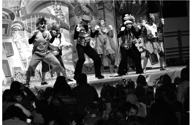
Aizpea euskara taldeak ekarrita aritzen dira urtero pailazoak Irurtzunen.

Batzuk eta besteak, eskabidearekin batera, IFKaren fotokopia, egin nahi den jardueraren gaineko plangintza xehatua, jardue-