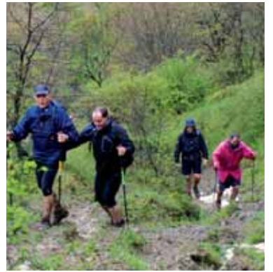
400 mendizalek eman dute izena da-goeneke. Gehiago espero dira.