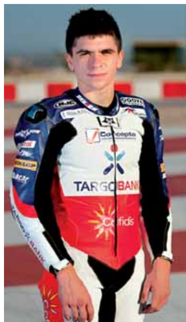
Mariñelarenak 20 urte ditu.

ASTEBURUAN HASIKO DU DENBORALDIA, KATALUNIako ZIRKUITUAN