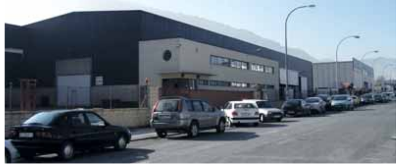
Laguntza jasoko duten bi enpresak olaztiarrak dira, bestea irurtzundarra.

ko da. 533.557,17 euroko inbertsioa egin du eta 106.711,43ko laguntza jaso du. Bost langile finko izatetik sei izatera pasako da enpresa. Azkenik, Kalpe Calderería Pesada SL-k 625.385,23 euroko inbertsioa egin du ingeniari-tza mekanikoan aritzeko. Gobernuarengandik 125.077,05 euro jaso ditu. Zortzi lanpostu berri sortuko dira.