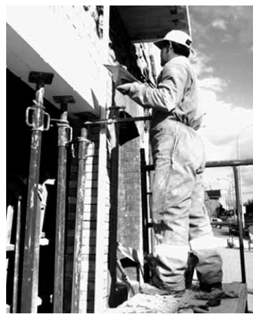
Kisugilea aldamio gainean.

eskaintzen erdia, %50,55, zerbitzuan aritzeko da (1.015; aurreko hilean baino 6 gutxiago). Industrian lan egin nahi lukete langabeen %34,61k (695; 1 gutxiago). %7,97 prest dago eraikuntza arloan aritzeko (160; 2 gutxiago). Lehen sektoreak, berriz, eskaeren %1,84 jaso du (37; berdina). Azkenik, aurretik lanik egin ez eta lan bila dabilenak %5,03 dira (101; 3 gutxiago).