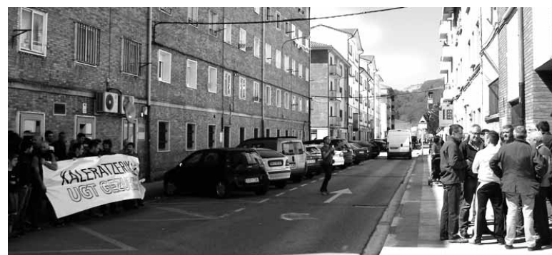
Kaleratuen kontzentrazioa ezkerrean, UGTko kideak eskubian; egoitza aitean.

Ordu erdiz UGTk Altsasun duen egoitzaren aurrean kontzentratu ziren. Sunsendegui izan diren 49 kaleratzeengatik protesta egin zuten bildutakoek. LABek nabarmendu zuen kaleratuen %90 UGTkoak ez diren langileak direla. UGTk ostiralean esandakoak "kalumniako adierazpen" jo zituzten LABen eta ukatu egin zuten "kaleratzeen herenak