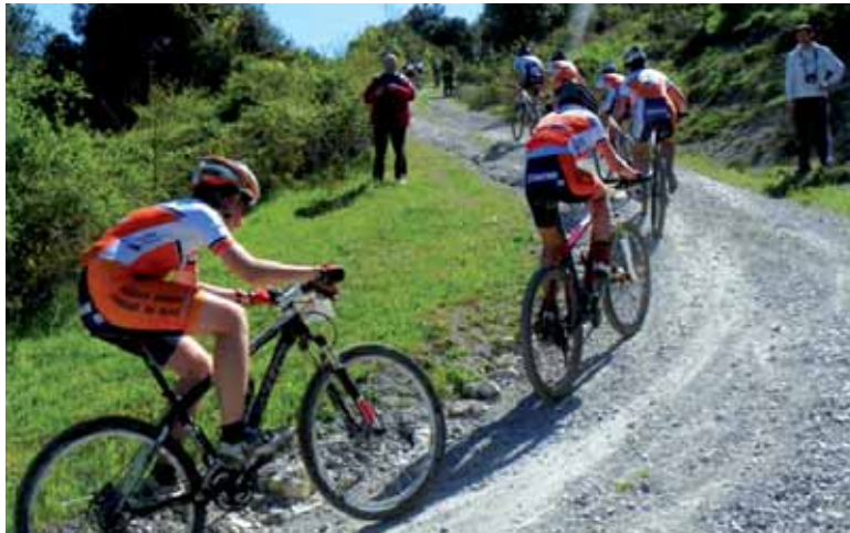
Bikerrek malda gogorrekin egin behar izan zieten aurre.