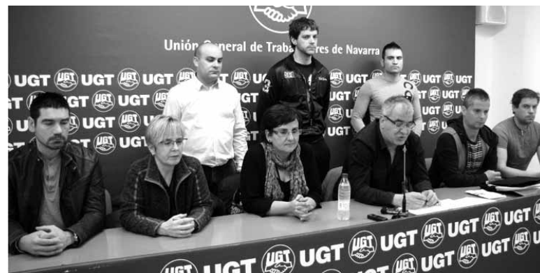
UGTko ordezkariak Iruñeko prentsaurrekoan.

UGTko metaleko federazioko buruak LABek egindako adierazpenei erantzun nahi izan zuten adieraziz, "haien jarrera arduragabea