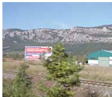
Industrialdea iragartzen zuen kartela.

Administrazio tramitazioa egin ondoren, Prolivisa enpresa pribatuak Hiriberri eta Ihabar artean sustatu behar zuen industrialde egitasmoa aspaldi dago gelditu. 56.000 metro karratu azalera aurreikusitako zen. Baina enpresak ondo jo eta haren ondasunak, Hiriberriko lurrak barne, Banco Popularren esku gelditu dira. Jabe berriak industrialdea garatzeko interesa azaldu zion udalari, baina duela urte batez dute haren berririk Arakilen. Gainera, aurreko lurren jabeak udalarekin dituen zorrak jabe berriak bere eginen dituen ahalgintzen ari da udala.