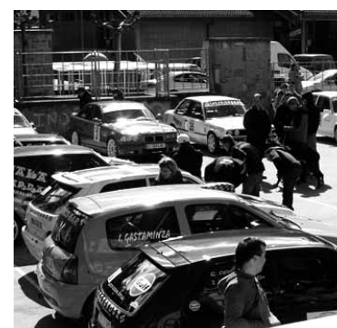
Autoak proba hasi aurretik.