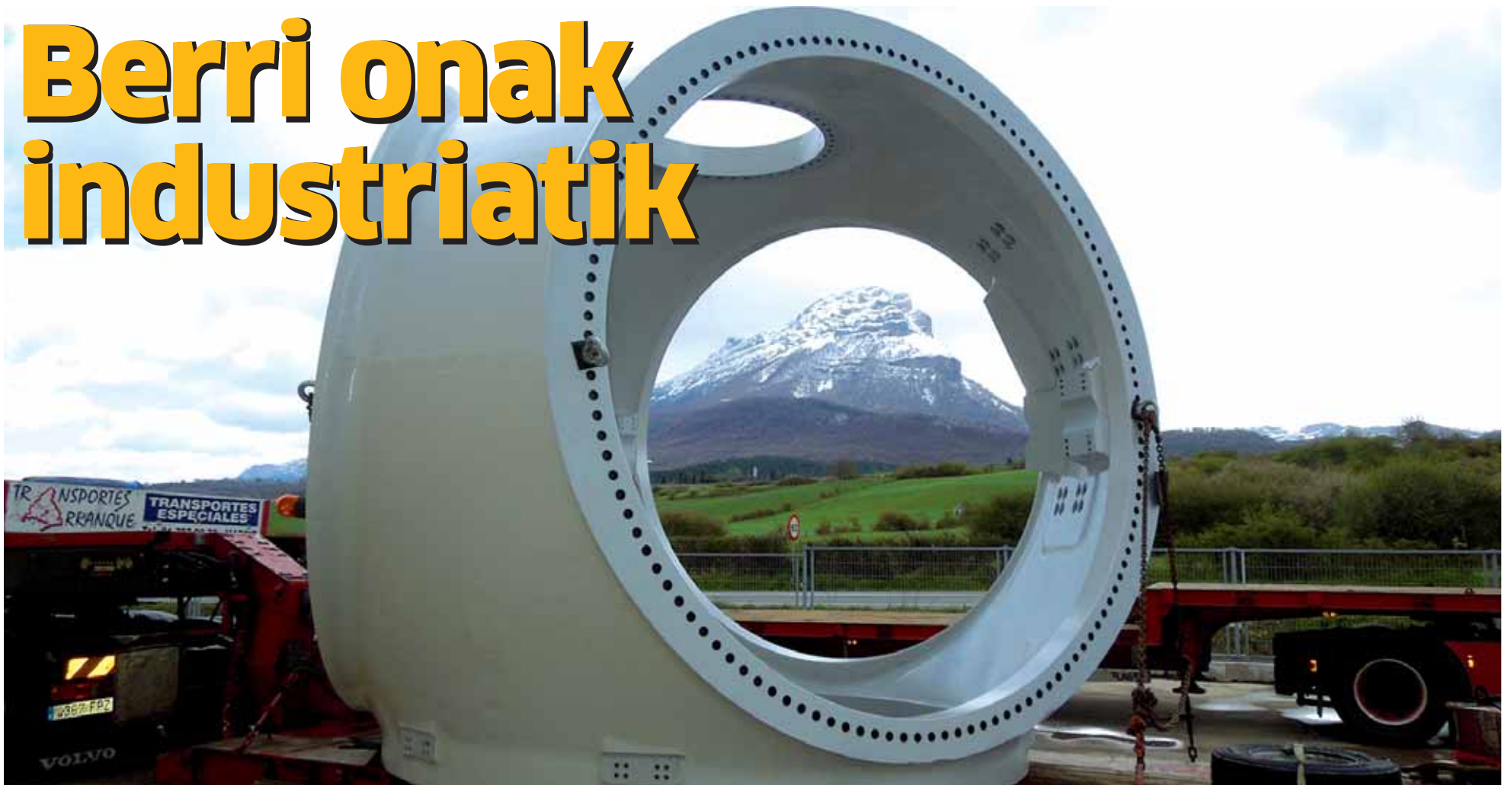
Sakana kooperatibak Siemensekin urte baterako akordioa sinatu du. Bestalde, hiru enpresek 15 lanpostu sortuko dituzte. UTZITAKOIA