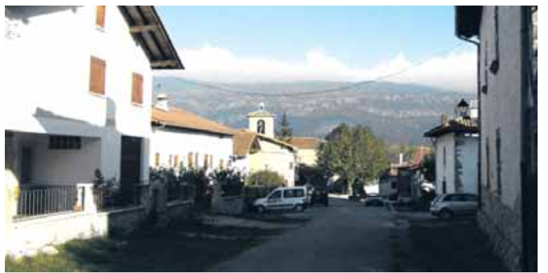
Satrustegiko ikuspegia hegoaldeetik. ARTXIBOIA