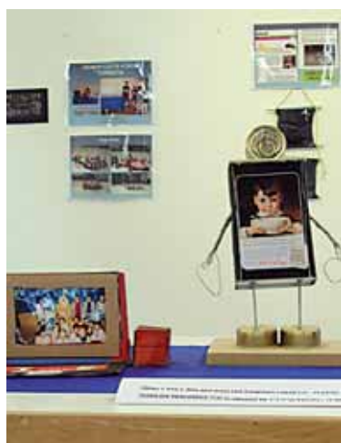
Aurreko erakusketa baten ikuspegia.