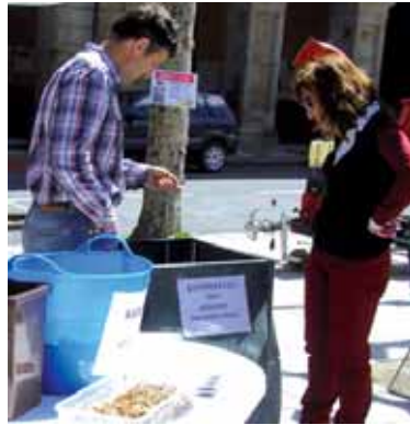
Bikotea konpostagailu ondoan.

Sakandarrek materia organikoari beste bizitza ematearen aldeko apustua egin dute. Mank-ek konpostatzea egiteko 1.653 eskaera berri jaso ditu (892 autokonpostatzea egiteko 761 auzo-konpostarako). Horiei Sakanan aurretik banatutako 300 konpostatzaileak batuta, materia organikoa beste modu batean ia 2.000 familiek aprobetxatu dute. Aurreikusten da. Mank-en eskaera berriak etengabe jasotzen ari dira. "Lehen esperientziak martxan jarri ostean, askoz gehiago apuntatuko dira. Edozein aldake-