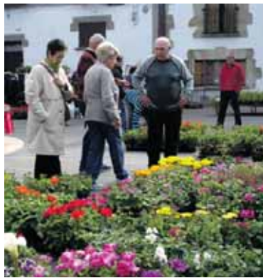
Lore eskaintza zabala izanen da.

Aurten 200 urte beteko dira Napoleonen armada Sakanan barna pasa eta herriak erre zituela, Gasteizko bataila galdu eta atzera egiten ari zela. Arbizun 45 etxe erabat deseginik geratu ziren eta herriaren memorian zauri nabaria geratu zen. Gertaera gogorazteko herri ekimena dago mar-