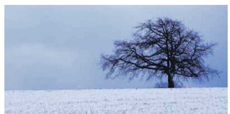
Guaixeko lehiaketan saritutako argazkia.

eta asko disfrutatu nuen argazkiak ateratzen. Orain, argazki berezi horrek, eguna birgogoratzeko eta lehiaketa irabazi dudala oroitzeko balio dit.