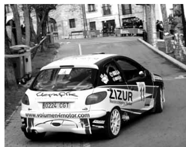
Rallyko une bat.