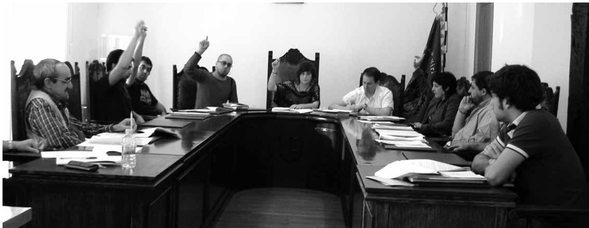
Udal bilkurako une bat.

NaBaiko Unai Uhaldek adierazi zuen aurrekontua "diru sarrera eta gastu korronteko aurrekontu hutsa ikusten dugu, egin diren emendekin txikiak kenduz ezta-