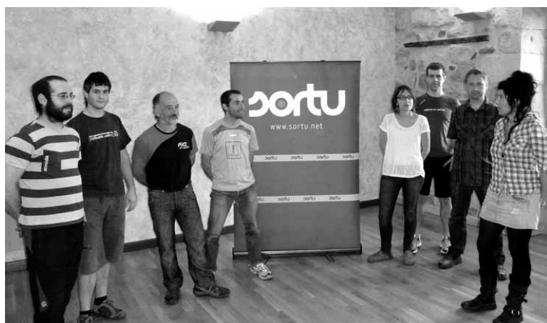
Sorturen ibarreko kontseilua osatzen duten etako batzuk. UTZITAKOIA

Sakanako Sortuk "egoera sozio ekonomiko larriari buelta emate