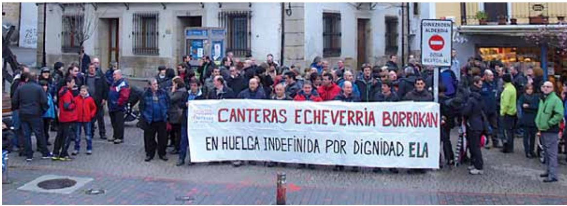
Aurretik egin duten moduan, atzo ere udaletxe aurrean kontzentratu ziren.