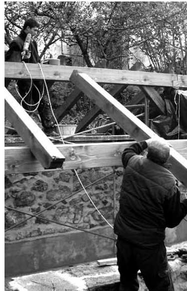
Bi gizon Egiarretan lanean.

Bost hilabetez (maiatzaren 15etik lastailaren 15era) lanaldi osoan aritzeko 5 pertsona kontratatu nahi ditu Arakilgo Udalak. 1.005,15 euroko soldata garbia izanen dute. Zerbitzu anitzetako sailean ariko dira lanean denak, haietako bat, gainera, retroeskabadorarekin lan egingen du. Arakilen errolatuta dauden langabetuak dira lanpostu horietara aurkez daitezkenak. Beti ere, eskola ziurtagiria izan behar dute eta autoendako B gida baime-