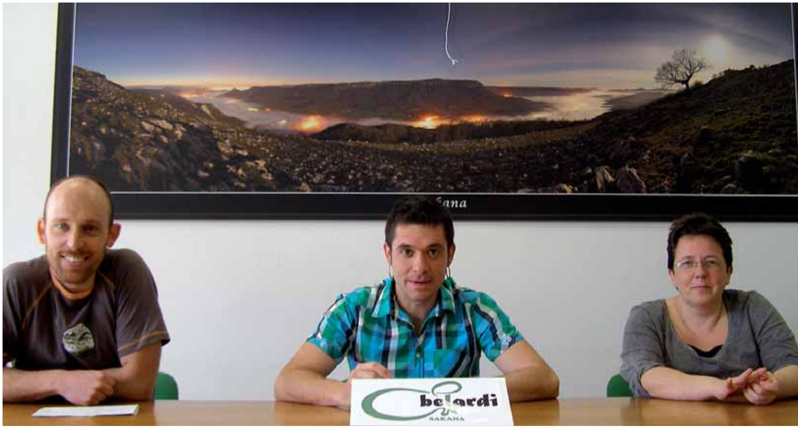
Igande goizean Etxarri Aranatzeko egiten da, Belardik antolatuta.