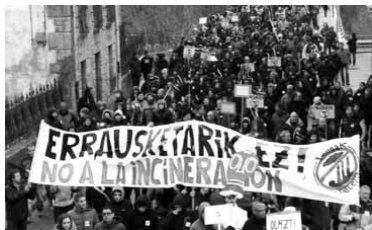
Altsasun egindako manifestazioa.