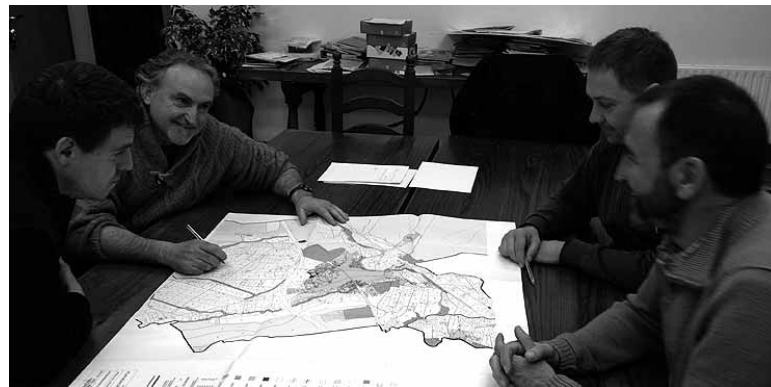
Hirigintza batzordea, bilduta. UTZITAKOIA.

Etxarriarrek herriko hirigintza jardueran ikusten dituzten arazok azaltzea nahi dute batzordeko kideek inkestaren bidez. Eta egun dauden arazoak konpontzeko ideiak proposatzea ere. Iragarri dutenez, aurrerago hirigintza plan osoaren berrikusketa aurrera egingen da, baina orain zahartuta gelditu diren edo zuzendu beharreko elementuetan zentratu nahi dute. Aldi berean, Hirigintza Batzordetik jakinarazi dute udala dagoeneko zenbait aldaketa zehatz bideratzen hasi dela, "industria jarduerak jartzeko eta abeltzariak zabaltzeko presa dagoelako edo hainbat laguntza galtzeko arriskua dagoelako".