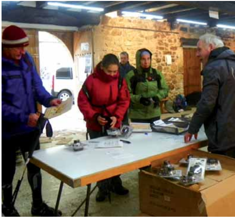
Mendizaleak Gure Etxeako helmugan. Alboan bi mendizale talde probaren azken txanpan. ERKUDEN BARROSO.

Antolakuntzak, bitartean, ibilbidea berrikusi eta arriskutsuak izan zitezkeen puntuak itxizituen, eta ibilbide alternatibo bat prestatu zuten. Horrela, Bargagaingo mendi tontorra (1.160m, ibilbideko altuera) ibilbidetik kendu egin zuten, elurra, lainoa eta haizea zirela medio. Ziordiko jaitsiera, ere, Olaztiko portutik egin zen. Ziordian indarrak berreskuratu eta gero ibilbidea bere horretan mantendu zen. Ibilbide luzea hautatu zuten mendizaleak, gehienak, Kipularrera igo ziren eta Alzaniako mendiak gurutzatuz Sorozarretatik jaitsi ziren. Baina hortik aurrera aldetak egin zituen antolakuntzak. Sarabe, Balankaleku eta