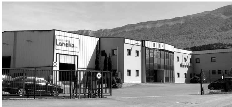
Industrias Lanekon 25 kaleratze egingen ditu zuzendaritzak.

Bestetik, langile guztielana aldiari eragiten zion espediente. Aurreko EEEen lan baldintzetan murrizketak egin zitzaizenez, horiek bere horretan mantenduko ditu zuzendaritzak. Espediente horrek sindikatuen adostasunarekin egingen du