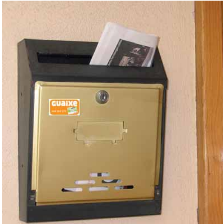
Sakanako makina bat buzoik pegatina mustu dute.

Hala ere, fundazioak herritar eta Guaixe irakurle orori informatu nahi die astekariaren ale batzuk herriz herri aukeratutako ondoren-