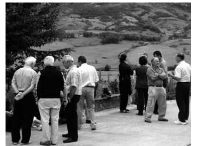
Jendea hizketan, Ergoienan.

Herri txikietan biztanleria mantendu ahal izateko Gaindegiak