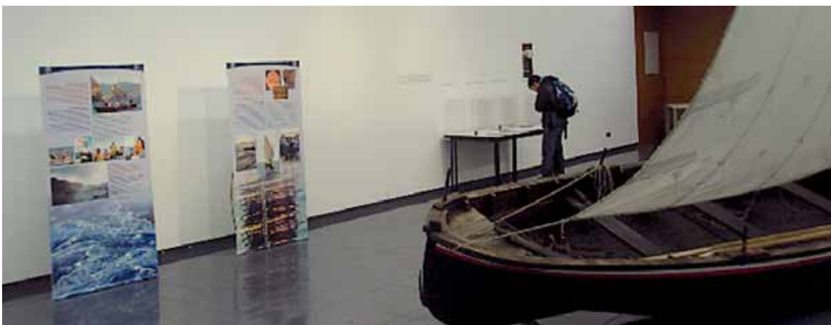
Batelarekin batera makina bat gauza daude ikusteko erakusketan.