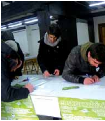
Sakandarrak, konpromisoa sinatzen.

“Ez zaitez espaloitik jaitsi!” ipuinaren bitartez, “konpromiso txikiak” hartzeko deia egin dute. Horretarako, konpromisoak idatzi zituzten hamarnaka pertsonak Gure Etxean jarritako kutxan. Konpromisoak uzteko kutxa Iortia Kul-