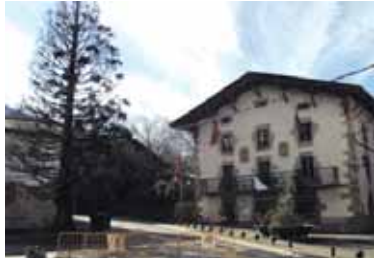
Udalletxe aurreko sekuoia gaixo dago.

Herriko etxearen parean dagoen sekuoiaz galdetuta, "norba iturri-kosturik gabeko ideiarekin batekin etortzen bada, ongi; bestela, zuhaitza lehortuta dago eta adar batzuk erortzekotan, moztu