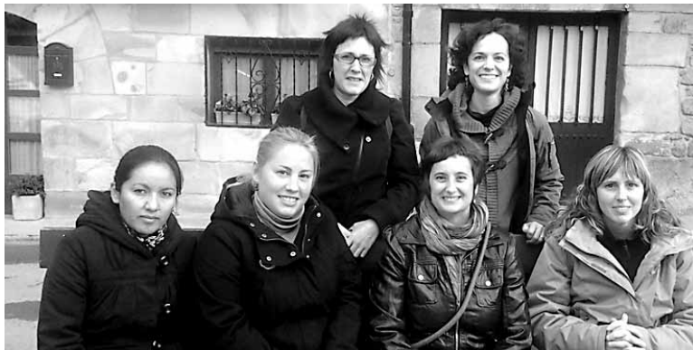
Parkea Martxan batzordeko kideak. ARTXIBOA

Lakuntzako Udalak bere gain hartuko ditu urbanizazio lanak. Apika, lanak udan has litezke. Parkea Martxan Batzordearen ardura da jolasparke egituratua eta ez egituratua. Jokoak eta beste muntatzen irailetik aurrera hasi nahi-