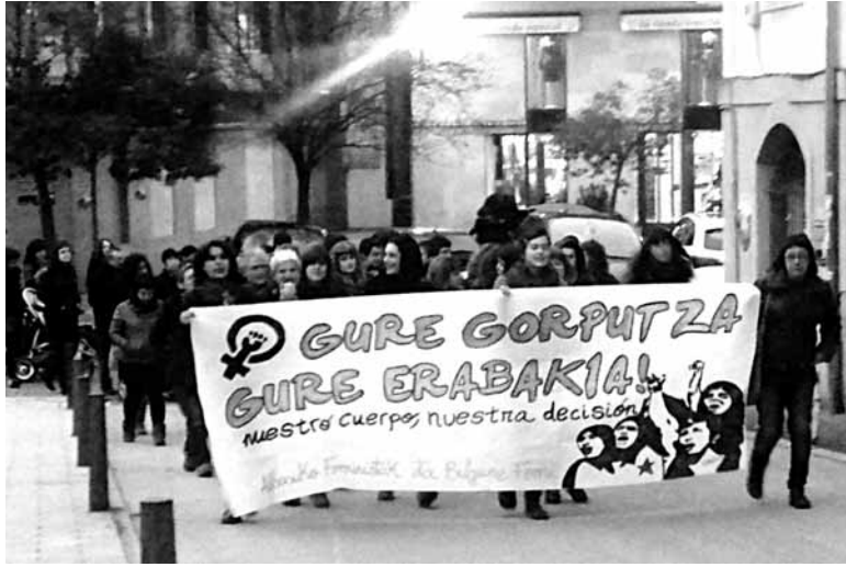
Oraindik ere emakumeen eskubideak aldarrikatu behar direla nabarmendu zuten.