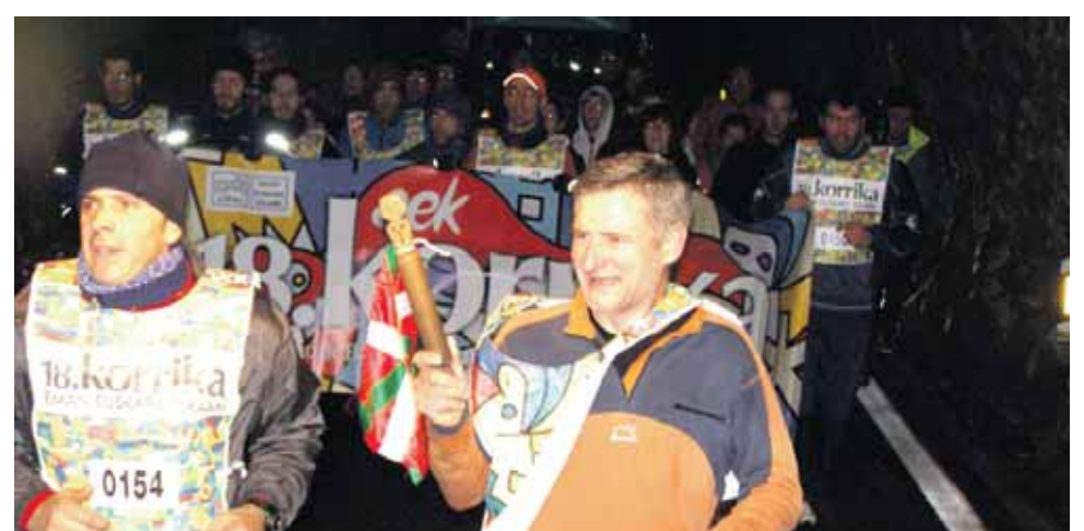
154 km. Aizpea euskara elkarte.