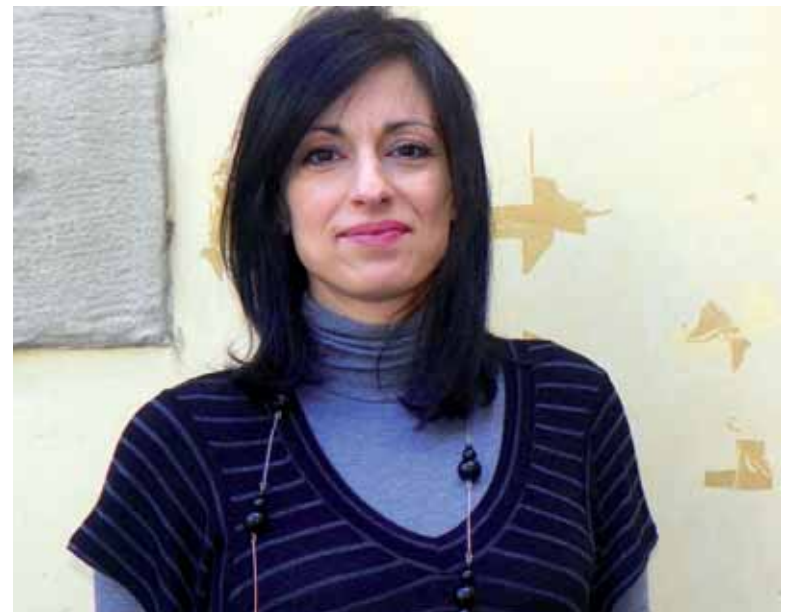
Elkarrizketa osorik: www.guaixe.net