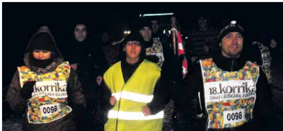
98 km. Ramoseko langileak.