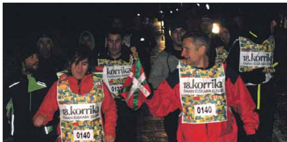
140 km. Bierrik Fundazioa.