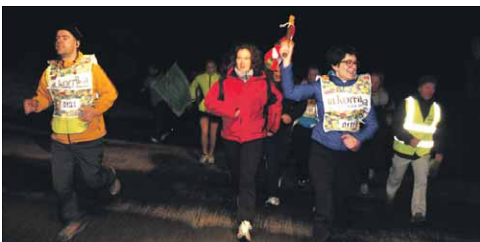
131 km. Arbizuko Udala.