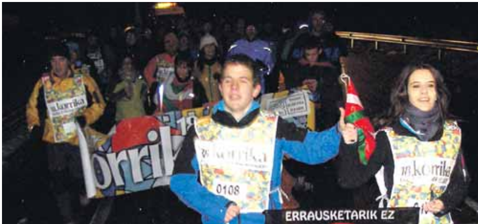
108 km. Ziordiko gaztetzxea eta elkartea.