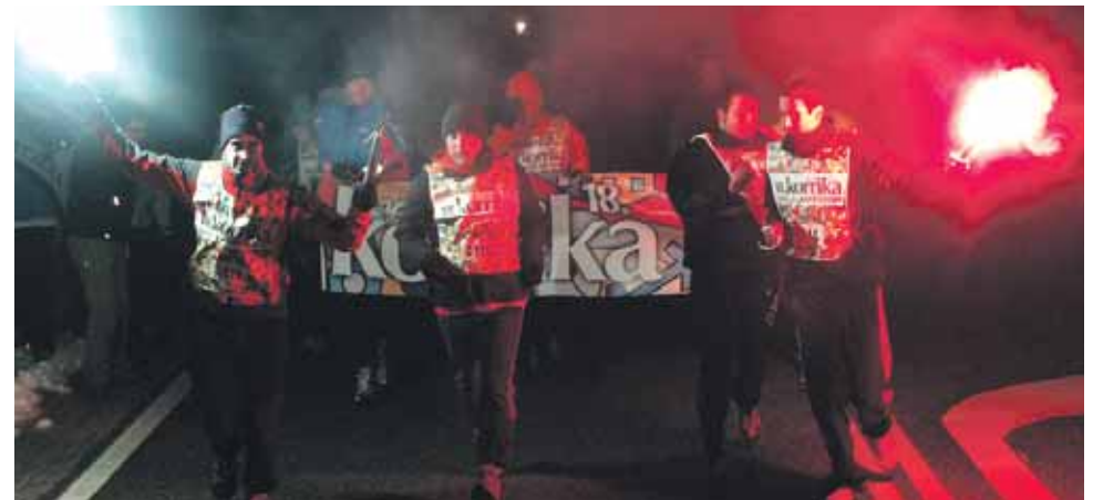
111 km. Olaztiko Maisuenea gaztetzxea.