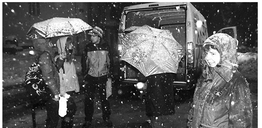
Otzaurten elurra mara-mara ari zuen, baina partaideek ongi etorri beroa eskaini zioten KORRIKARI.