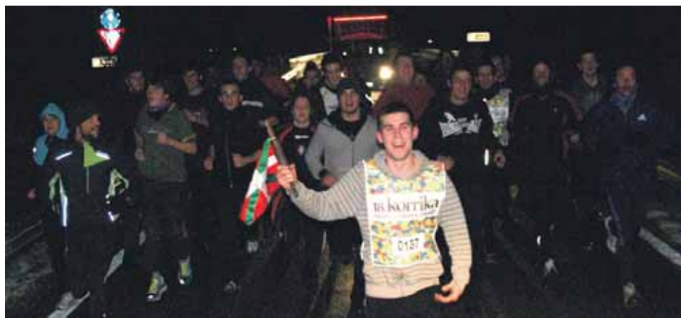
137 km. Arbibidea elkarte.