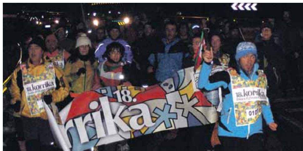
107 km. Iñigo Aritza Ikastola.