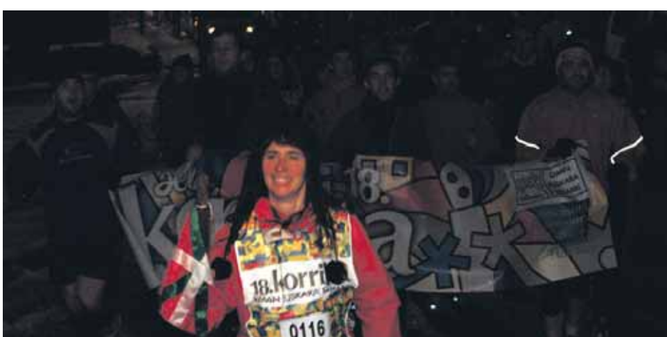
116 km. Urdiaingo Udala.