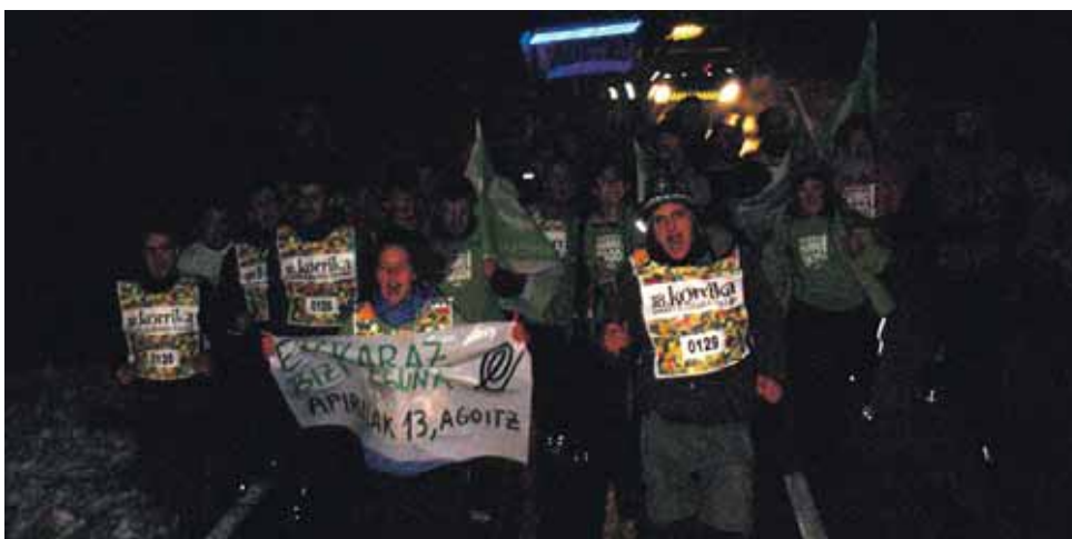
129 km. Etxarri Aranazko EHE.