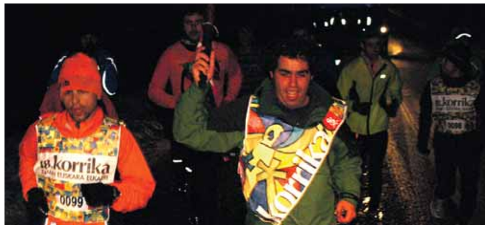
99 km. Guerra Hermanoseko langileak.