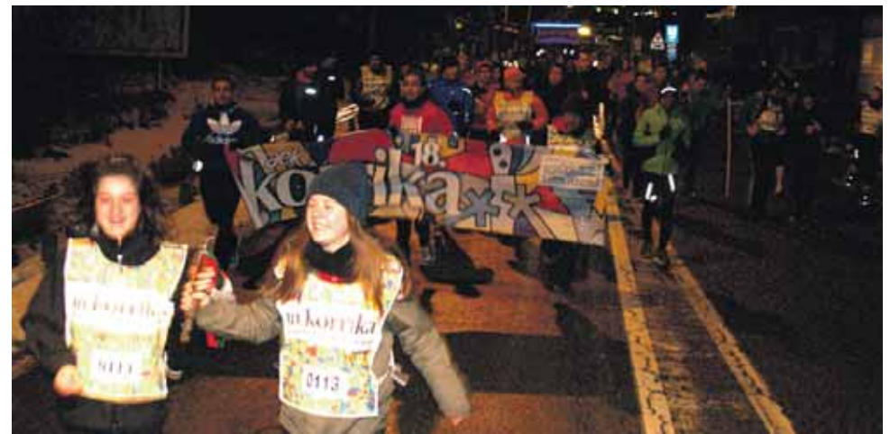
113 km. Viscofaneko langileak.