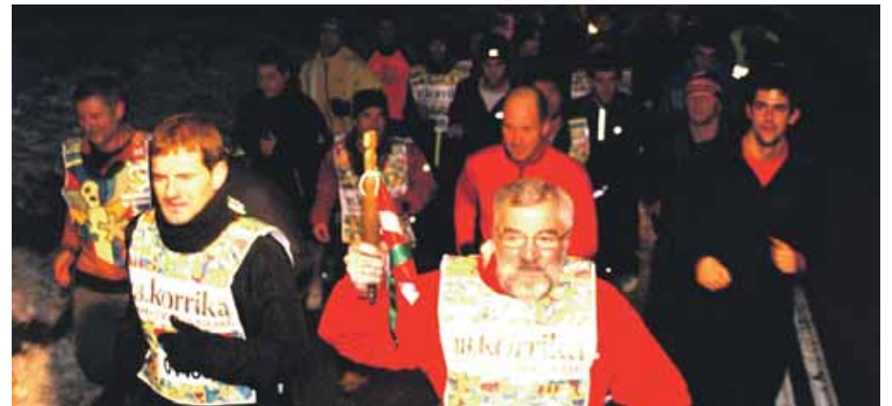
148 km. Iratxo elkarte.