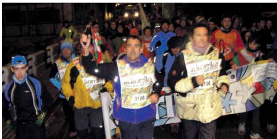
106 km. Sunsundegui.