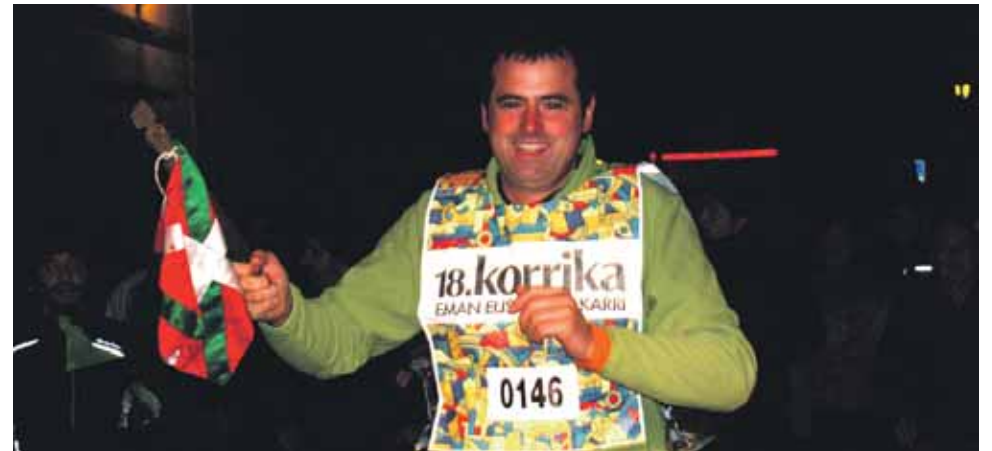
146 km. Arakilgo Udala.