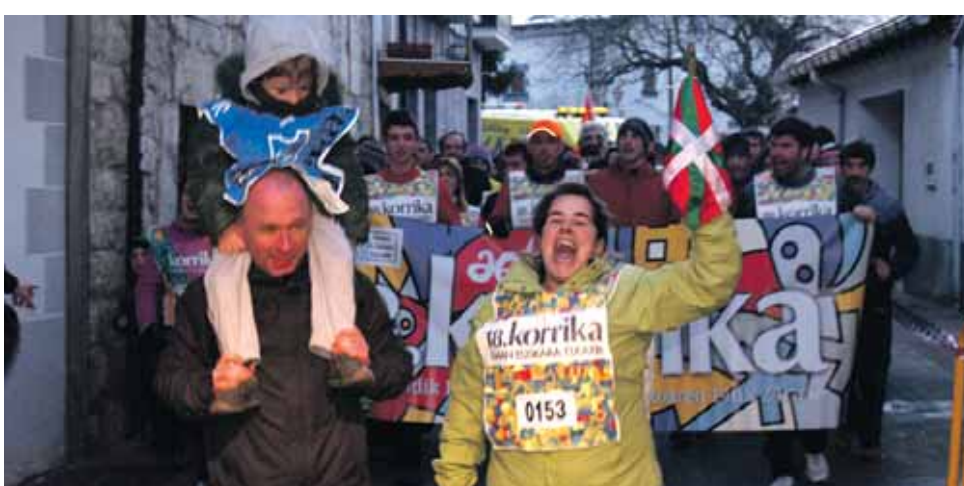
153 km. Atakondoa ikastetxe publikoa.