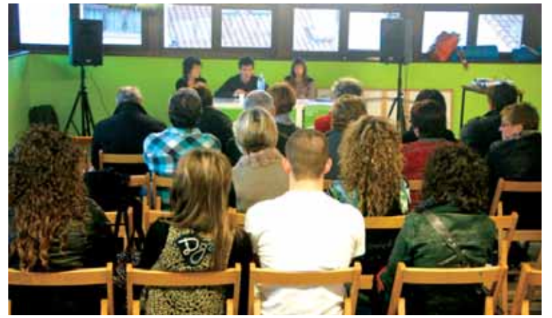
Lakuntzako EHEren aurkezpena. UTZITAKOIA