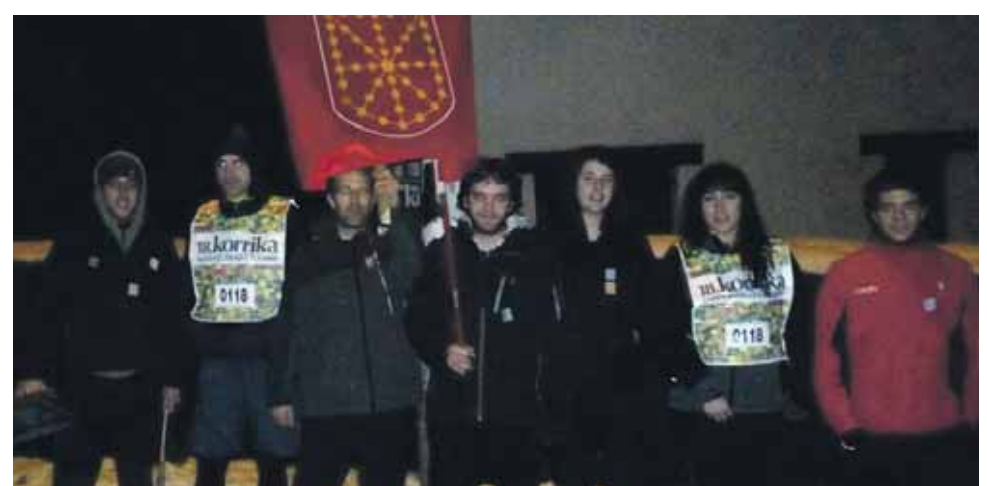
117 km. Aitzkozar elkartea.