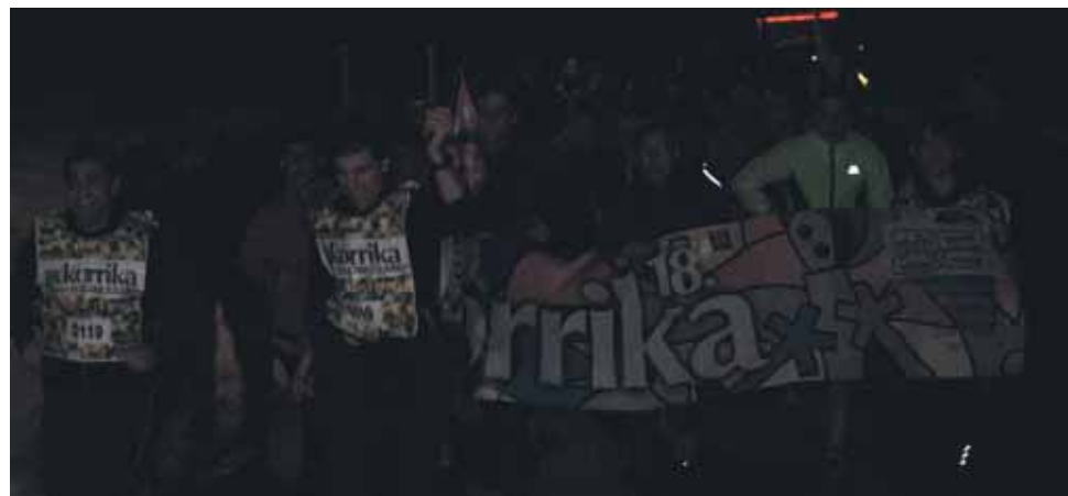
119 km. Bakaikuko Udala.