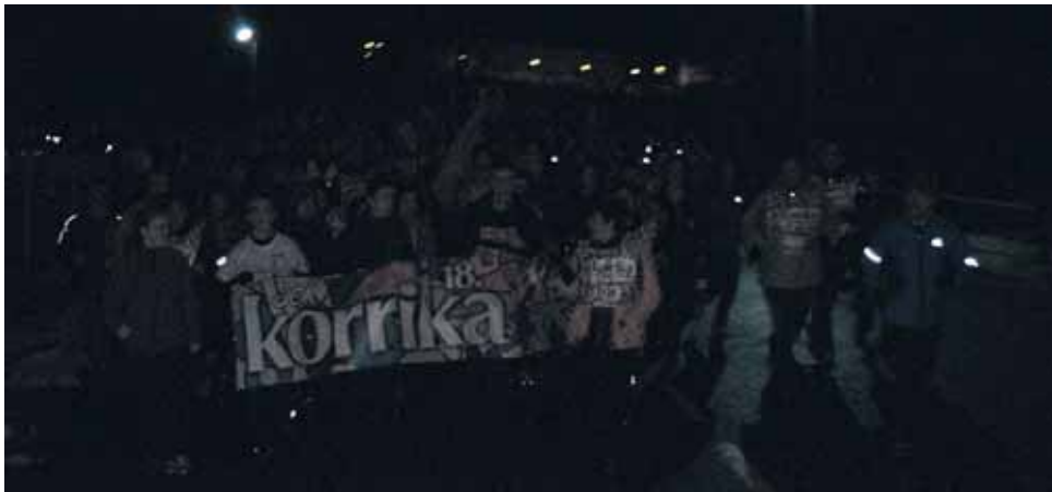
125 km. San Donato ikastetxe publikoa.