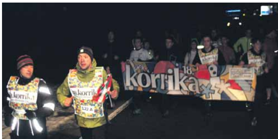
122 A km. Larrañeta elkarteak.