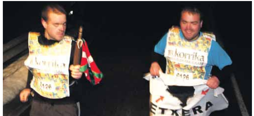
126 km. Udaberri elkarte.