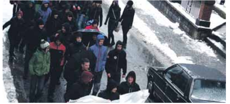
Ostegun goizean ikasleek egindako manifestazioa.

Bestalde, herenegun DBH3. eta 4. mailako, Batxilergoko, Lanbide Heziketako eta unibertsitateko ikasleak hezkuntza erreformaren kontra protesta egiteko greba egin zuten. Aralarko Mikel Donea ins-