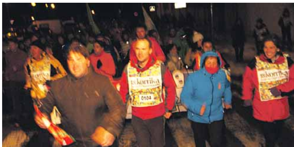
104 km. Zelandi eskola.