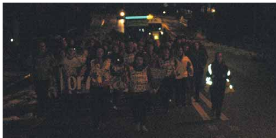
123 km. Etxarri Aranazko Udala.