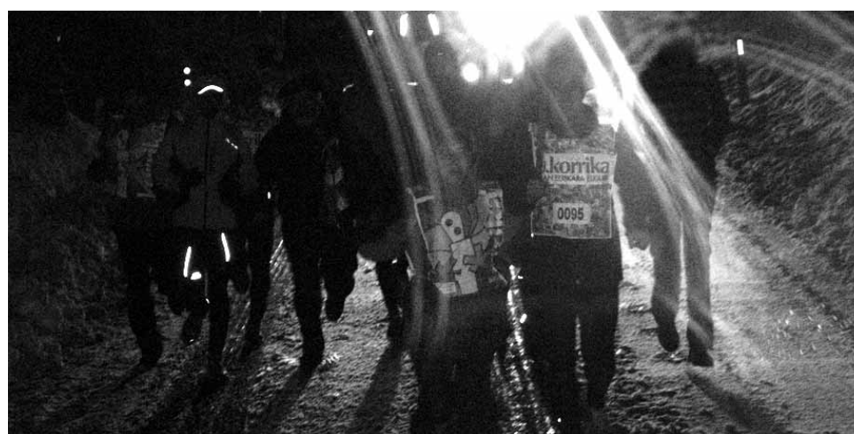
95 km. Sakanako LAB.