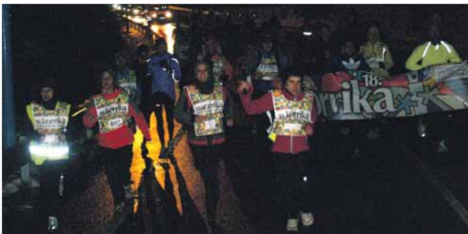
112 km. Eskola txikiak.