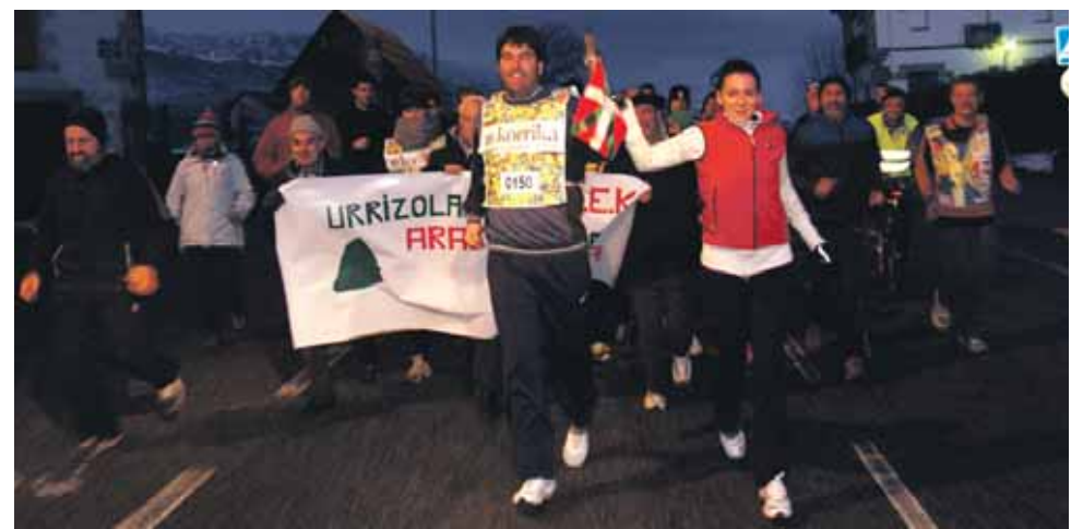
150 km. Urrizolako kontzejua.