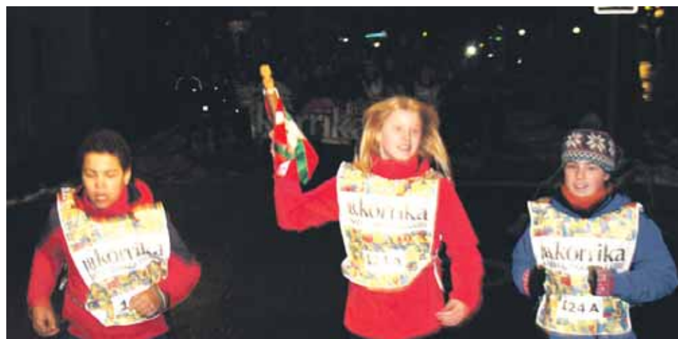
124 A km. Andra Mari Ikastolako ikasleak.