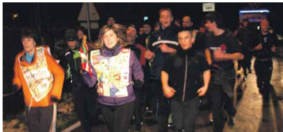
138 km. Aralar Mendi elkarte.