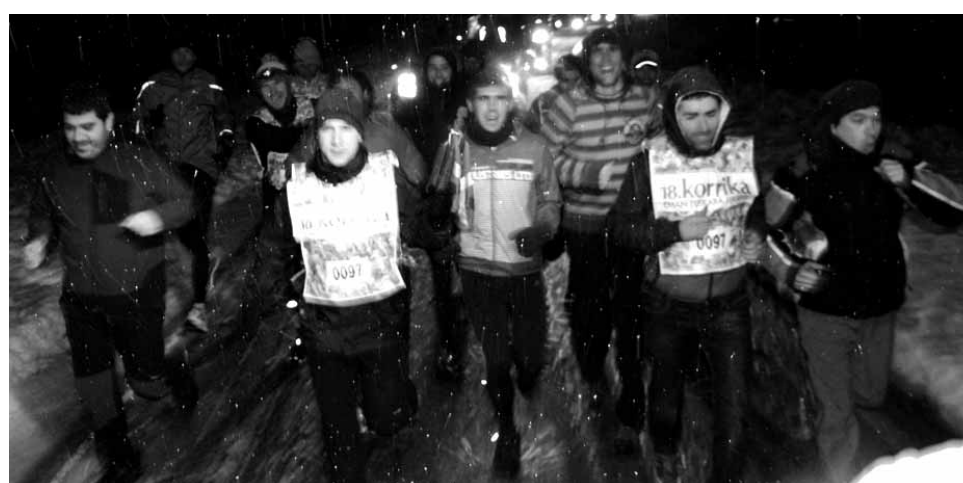
97 km. Magoteaux.