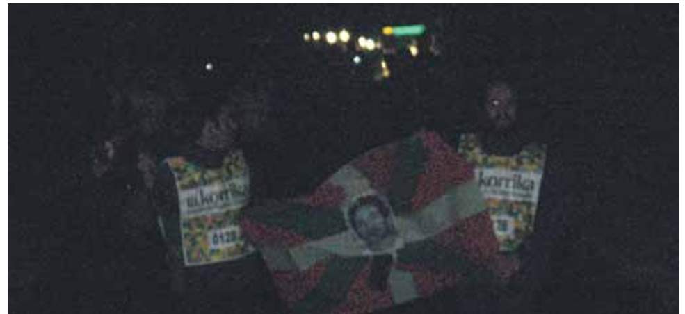
128 km. Karriestu elkarte.