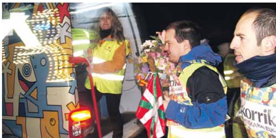
121 km. Guerra Hermanoseko langileak.