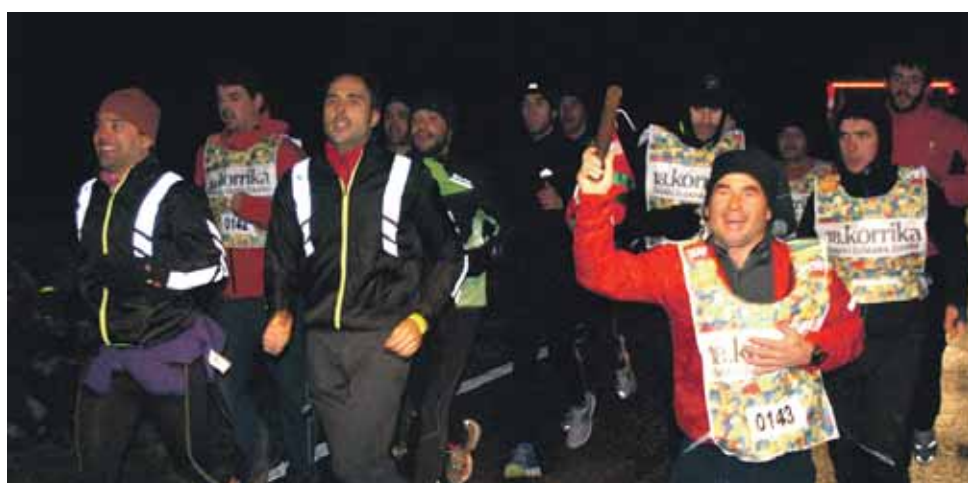
143 km. Pikuxar.