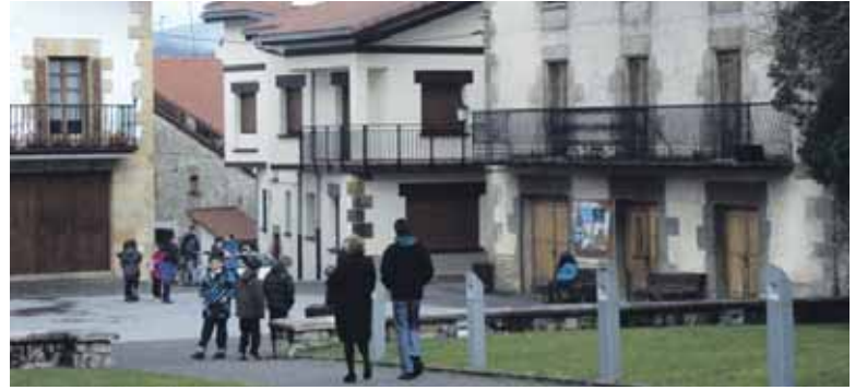
Sakanako udal hautetsiek ere manifestaziora deitu dute.

Harremanetarako helbide horretara ere jo daiteke.