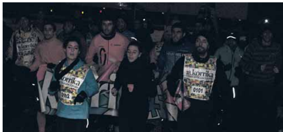
101 km. Altsasuko Gaztetxea eta Musika eskola.