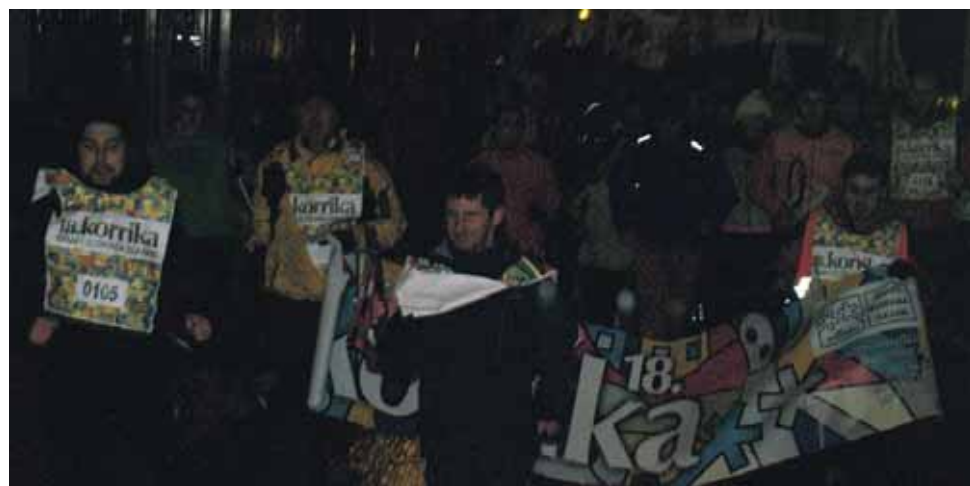
105 km. Altsasuko Udala.