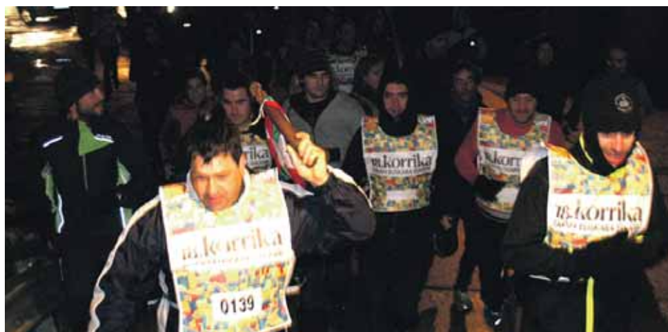
139 km. Uharte Arakilgo Udala.