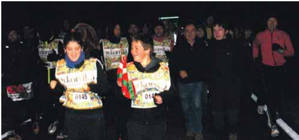
145 km. Hiriberriko kontzejua.