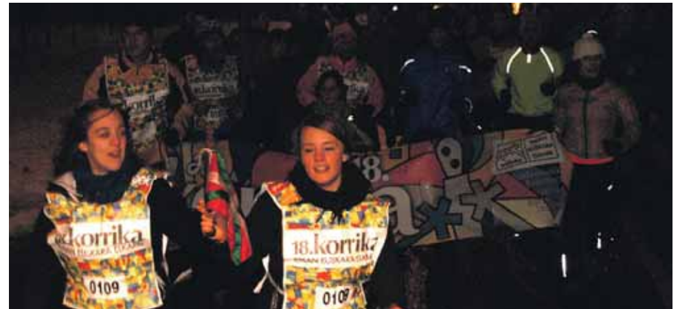
109 km. Ziordiko Udala.