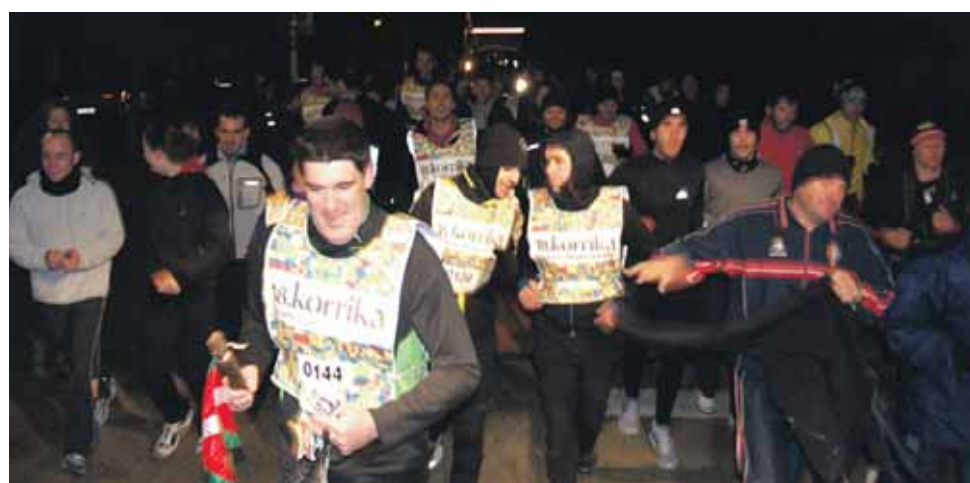
144 km. Ihabarko kontzejua.