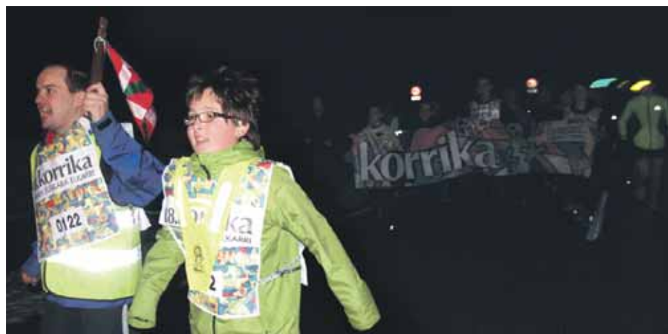
122 km. Andra Mari Ikastolako gurasoak.