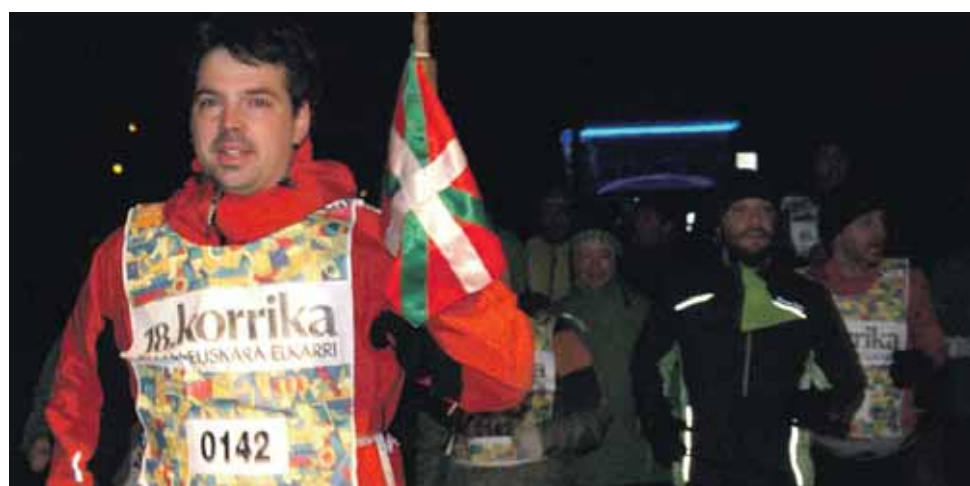
142 km. Irañetako Udala.