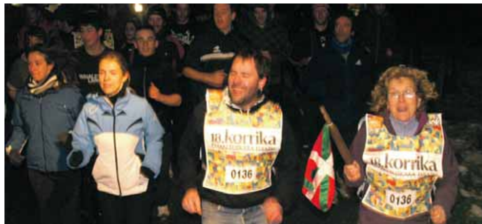
136 km. Arruazuko Udala.