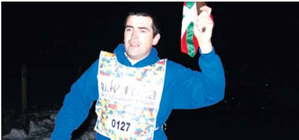
127 km. Jeingenekoa esnekiak eta kuadrilla.