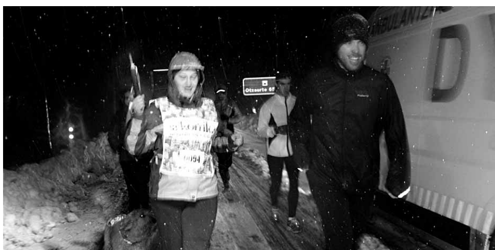
94 km. Sakanako Mankomunitatea.