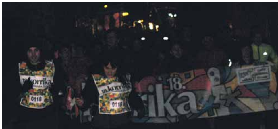
118 km. Iturmendiko Udala eta Aritzaga elkarteak.