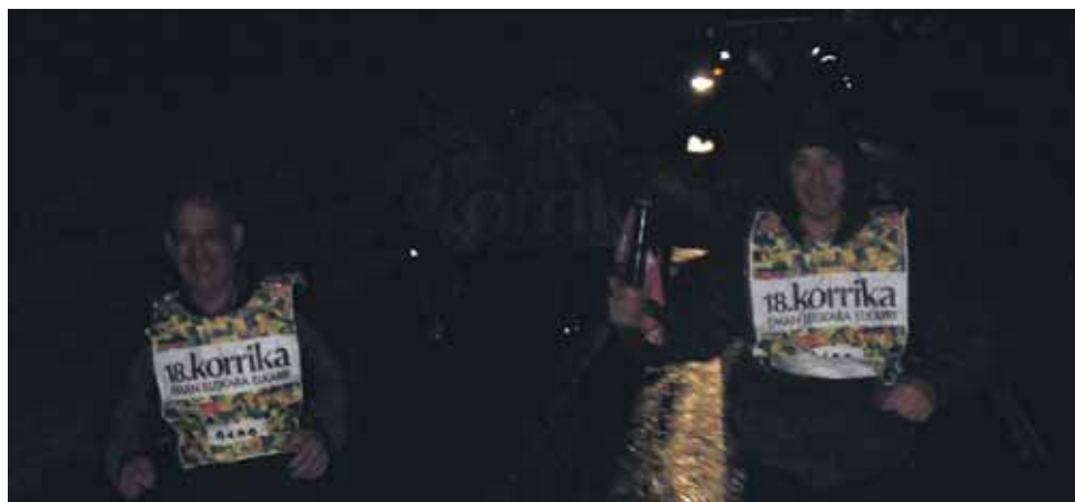
100 km. Artzabal elkarteak.