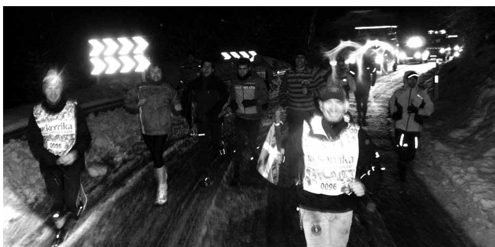
96 km. Euskaltea eta Mintzakideak.