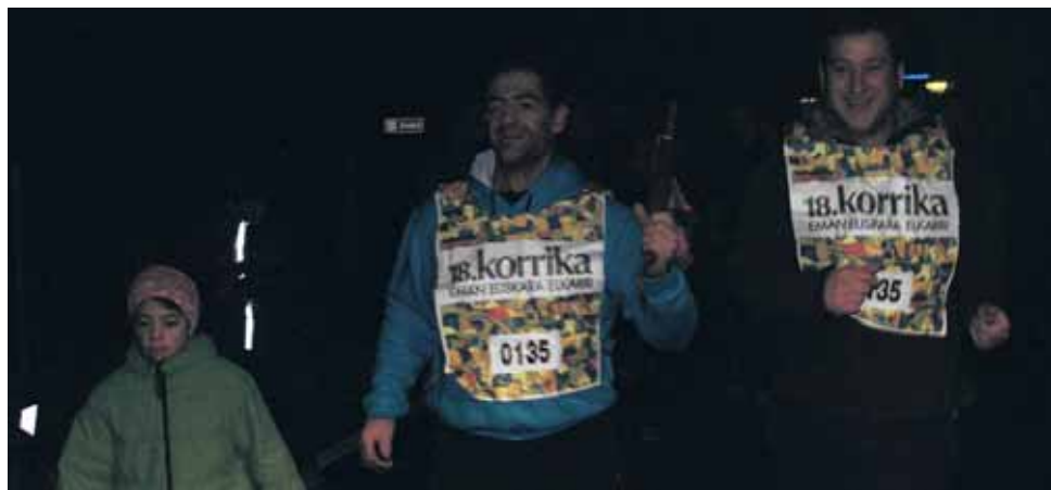
135 km. Sakana Coop.