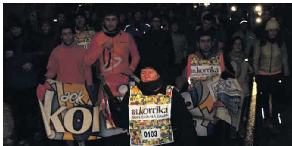
103 km. Iñigo Aritza Ikastola.