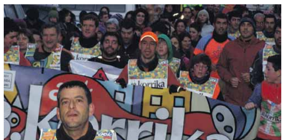
152 km. Irurtzungo Udala.