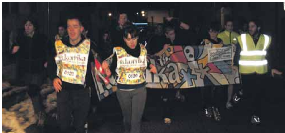
120 km. Bakaikuko Gazte Asanblada.