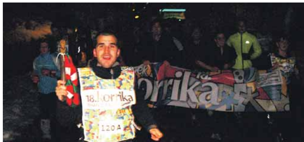
120 A km. Bakaikuko elkarteak.