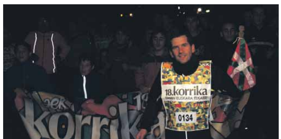
134 km. Lakuntzako Pertza eta Biltoki.