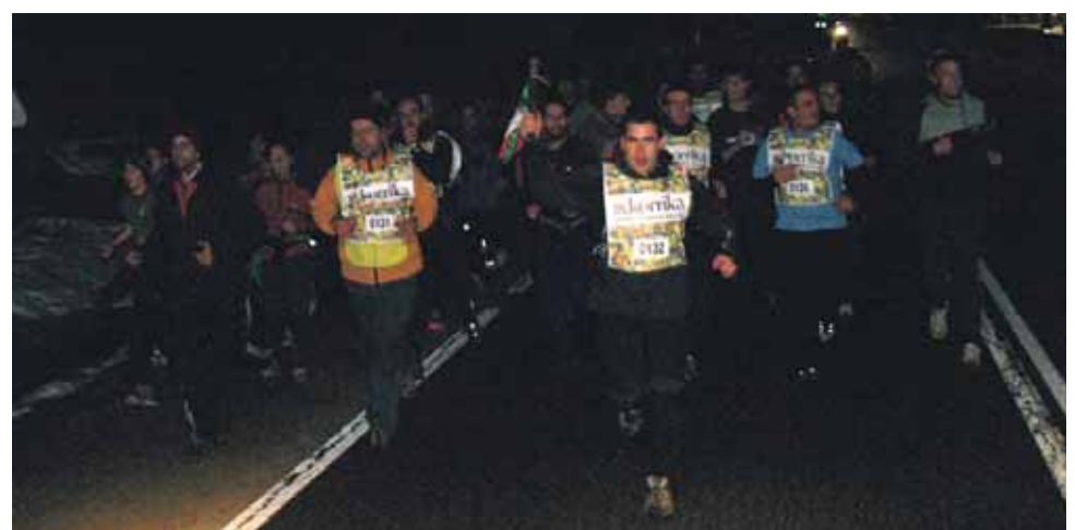
132 km. Aldabide elkarte.