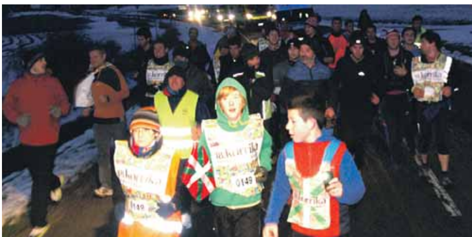
149 km. Etxarrengo kontzejua.