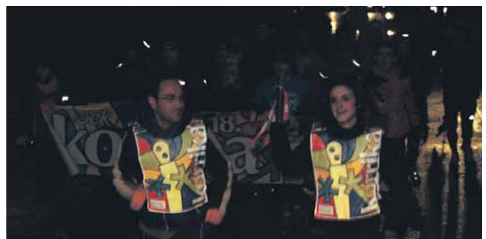
115 km. Urdiaindarrak.