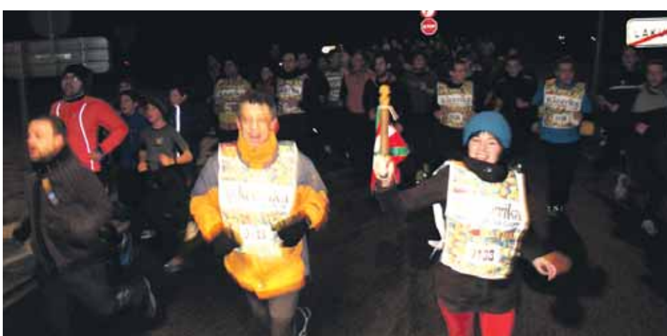
133 km. Lakuntzako Udala.