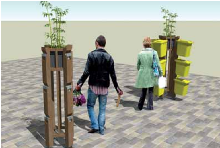
Igoarking -ek diseinatutako zintzilarioak.