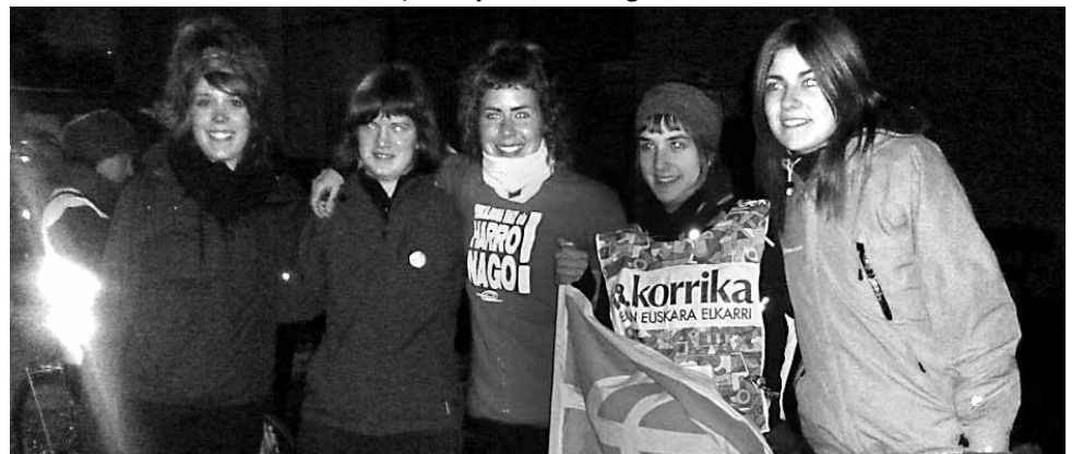
Altsasuarrak pozik, KORRIKAREN zain.