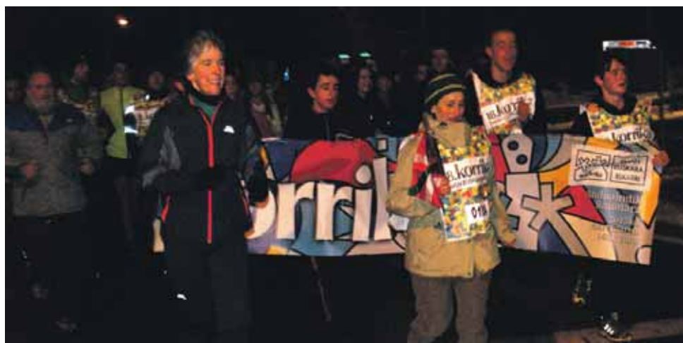
124 km. Andra Mari Ikastolako langileak.