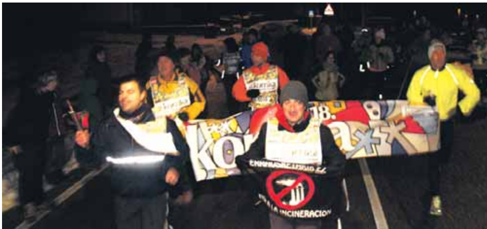
110 km. Olaztiko Udala.