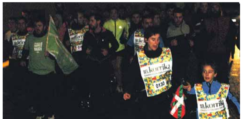
130 km. Lizarragabengoako kontzejua.