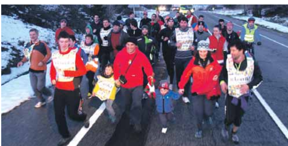
151 km. Etxeberriko kontzejua.