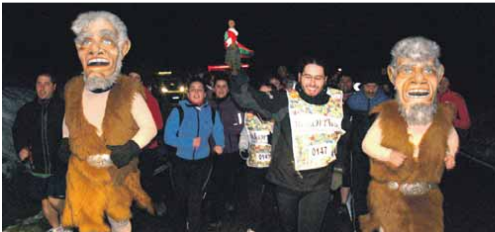
147 km. Orritz dantza taldea.