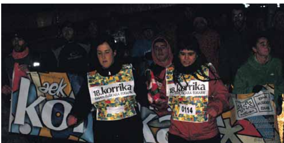
114 km. Aitziber eta Tintinurri elkarteak.