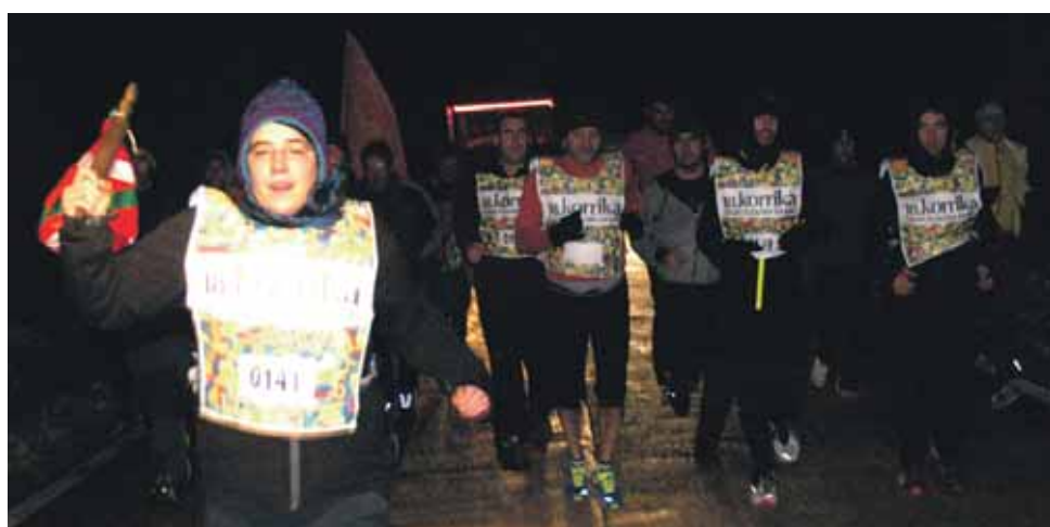
141 km. Irañetako euskara taldea.