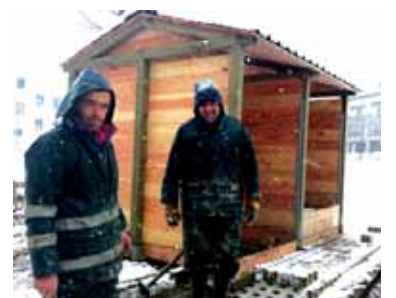
Elurretan jaso dute kaxeta.