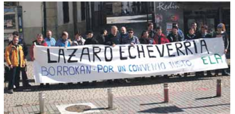
Langileak Altsasuko udaletxe aurrean protestan.

Lan baldintzen funtsezko aldaketa proposatu die enpresak langileei: soldata %10 murriztea, asteko lanaldia larunbatetara luzatzea eta "malgutasun neurri onartezinak". ELAk neurri horiek "berehala" baztertzeko eskatu du. Sindikatuak lan hitzarmen bat negoziatzeko proposamena luzatu dio enpresari. "Baita langileen eta enpresaren lasaitasuna bermatuko duten formulak aztertzea ere". ELAk kriti-