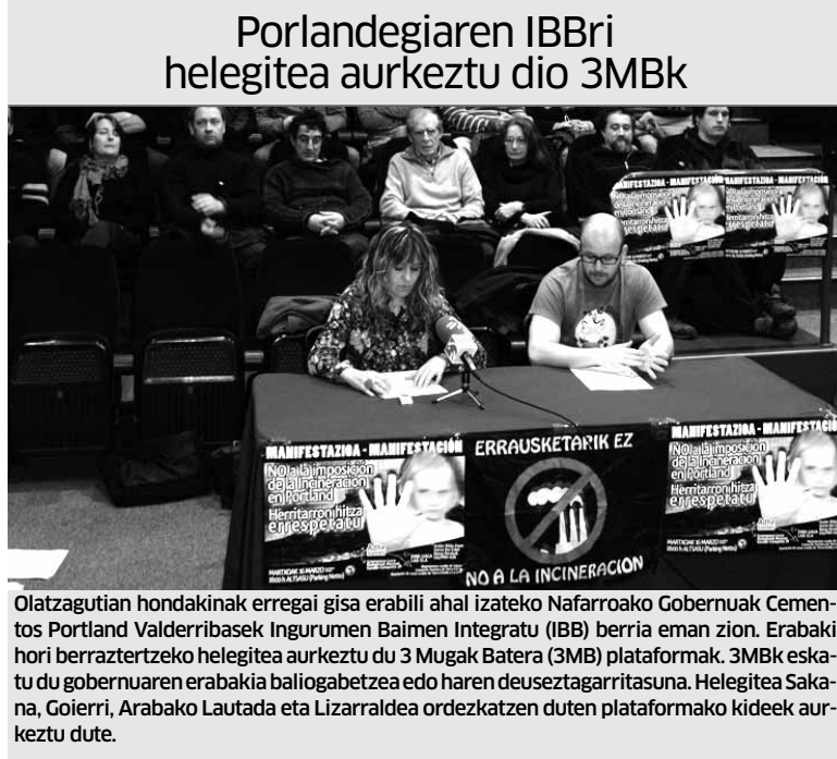
Porlandegiaren IBBri helegitea aurkeztu dio 3MBk Olatzagutian hondakinak erregai gisa erabili ahal izateko Nafarroako Gobernuak Cementos Portland Valderribasek Ingurumen Baimen Integratu (IBB) berria eman zion. Erabaki hori berraztertzeko helegitea aurkeztu du 3 Mugak Batera (3MB) plataformak. 3MBk eskatu du gobernuaren erabakia baliogabetzea edo haren deuseztagarritasuna. Helegitea Sakanan, Goierri, Arabako Lautada eta Lizarraldean ordezkatzen duten plataformako kideek aurkeztu dute.

Plataformakoak kritiko azaldu dira gobernuaren planetan hondakinak errausteko kokapena zehaztu ez izana eta esku pribatuetan uztea, "Nafarroan errausketa isilpean FCCren zementu fabrikaren bitartez sartu nahian". Errausketa ondo-ondorio kaltegarriak azpimarratu eta beste eskualdeetan kontra azal-