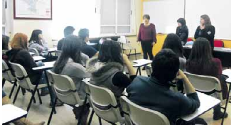
Lanbide heziketakokoak klasean azalpenak ematen. UTZITAKOIA

Izan ere, ikastetxetxetik ikastetxeko erronda horretan Emakumeen egunaren zergatia azalduko dute LHkoek. Horrekin batera, lanbidearen aukeraketari buruz hausnarketa zabaldu nahi dute hainbat galderen bidez: Zein ikasketa