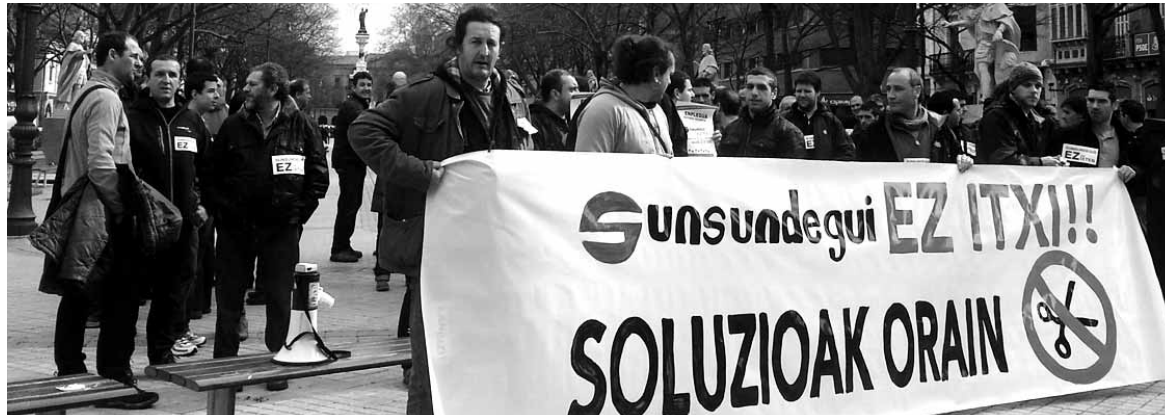
Sunsundegui 100 bat langile bildu ziren atzo Nafarroako Parlamentu aurrean.

Baina bazkide baten bilaketak abenduan porrot egin zuen eta hartzekodunen aurre-lehiaketa aurkeztu zuen Sodenak Sunsundeguirako (28rako zordunekin zorra negoziatu behar du, bestela lehiaketara pasatuko da). 13 enpre-