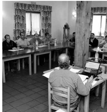
Patronatuko bilera.

Talde ekologistako kide batek azaldu digunez, "parkean dagoen legez kanpoko harrobiaz, kanpinaren hondakinaren kudeaketaz edota egiten uzten ari diren jardueren inguruan azalpenak ematea nahi dugu. Ekarpak egin,