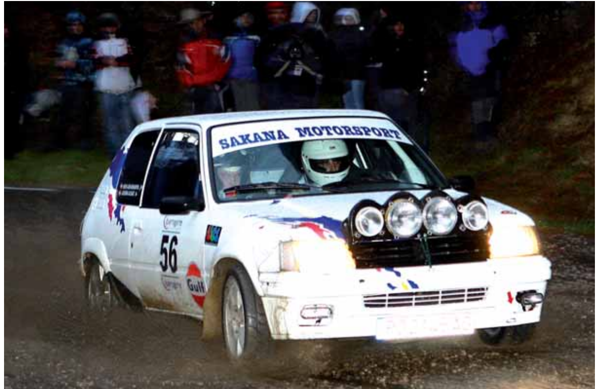
Zirkuitu ikusgarrian 33 autoren maniobreakin gozatu ederra hartzeko aukera izanen da Olaztin.

Puntako ikuskizunak jendetza erakarriko duela uste du antolakuntzak. Eguraldi iragarpenak ez du euririk aurrekusten eta zale ugari espero dira Olaztin. Proba gertu jarraitzeko aukera izango dute, antolakuntzak horretarako propio prestatutako eremuetan. Hortik kanpo ez kokatzeko deia egin du