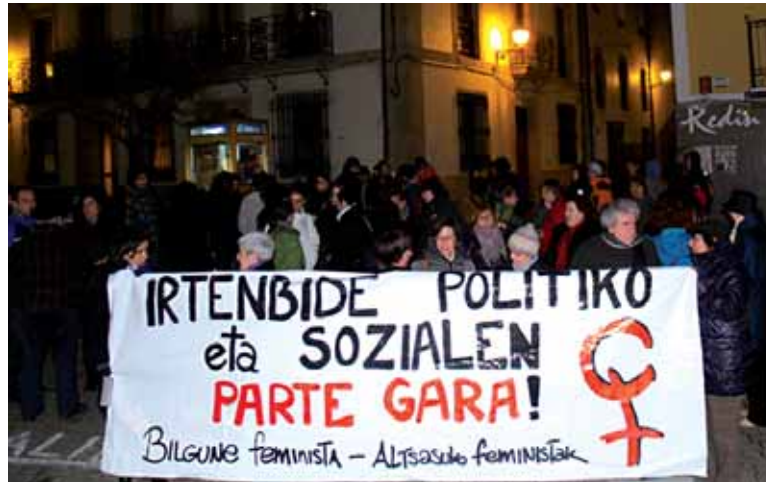
Joan den urtean Altsasun egindako bilkura.

Altsasuko Feministak eta Bilgune Feministak gaur aldarrikapena eta ospakizuna uzartuko dituzte. Emakumeen Nazioarteko Egunean. Gure gorputza, gure erabakia leloarekin, 19:00etan, manifestazioa abiatuko da Foru plazatik. Hura despedituta Alde Zaharrean triki-poteoa izanen da. Hura bukatutakoan