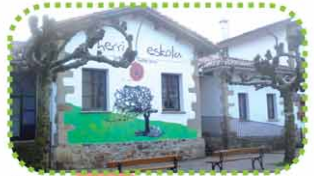
ARBIZU: ARBIZUKO HERRI ESKOLA

Utzubar txiki zg 31820 Etxarri Aranatz Tfnoa: 948 567 003 E-maila: cpetxarr@educacion.navarra.es www.etxarrioeskola.com