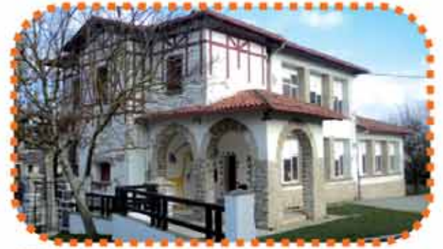
URDIAIN: URDIAINGO HERRI ESKOLA

Zelandi 18 31800 Alsasu Tfnoa.: 948 564 839 - Faxa: 948 564 011 E-maila: cpalsasu@educacion.navarra.es http://centros.educacion.navarra.es/cpzelandi