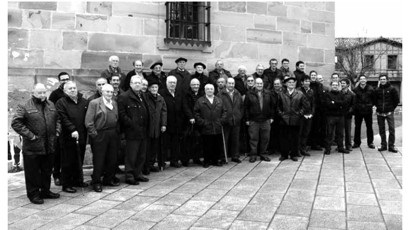
Elizkizunaren ondoren, Bakaikuko kofradeak. NEREA MAZKIARAN