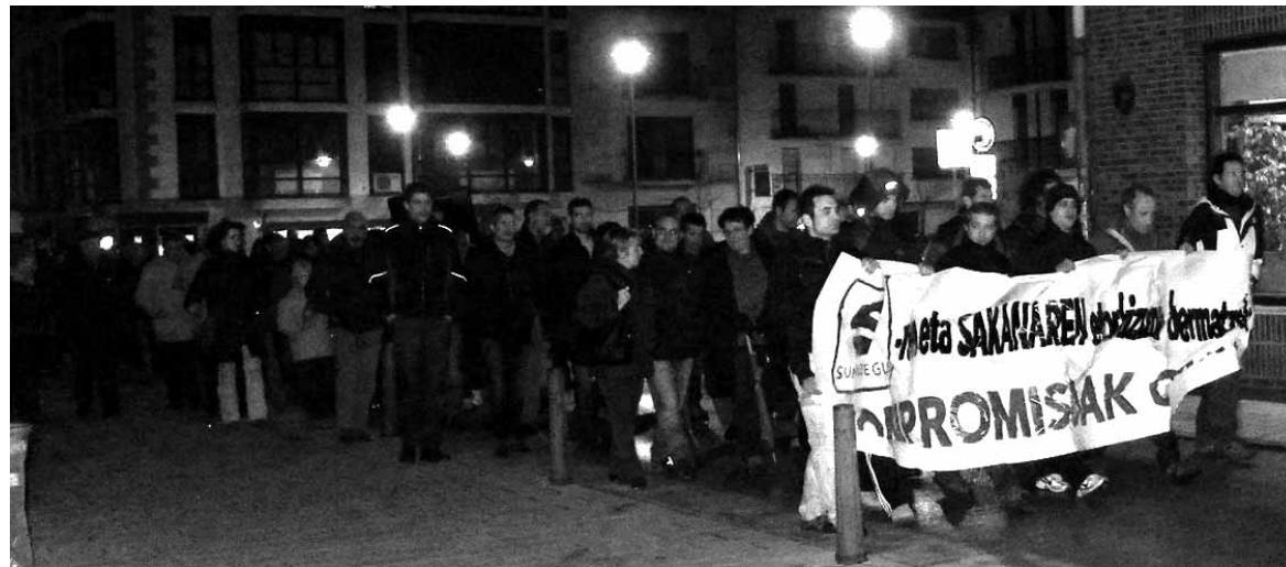
Manifestariak Nafarroako Gobernuari lantegiarekin eta ibarrarekin konpromisoa eskatu zioten. ERKUDEN RUIZ BARROSO

Sodenaren kudeaketa kritikatu dute, izan ere, "nafarren diruare-