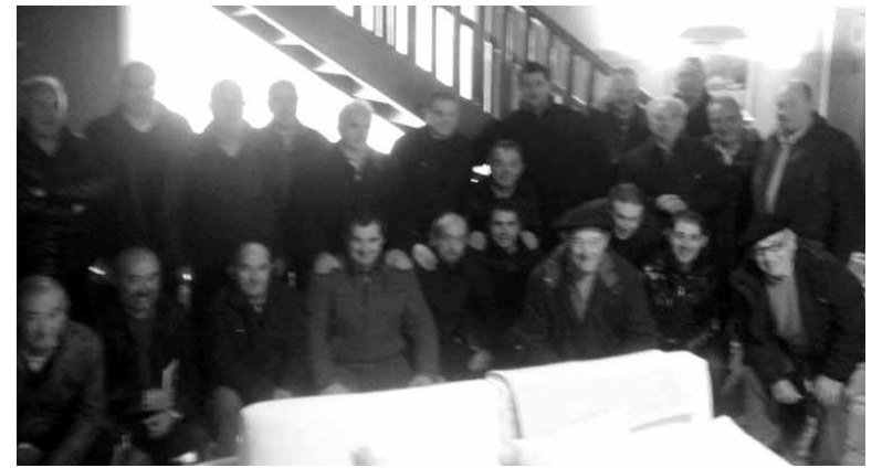
Kofradeendako Karmenek, Anparok eta Blankik sukaldatu zuten. A. LIZARRAGA.