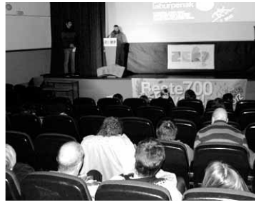
Abenduaren 3an ezagutarazi zuten.

arabera, Etxarriko erroldaren %10en sinadurak beharko dira Nafarroako Gobernuari galdeketa egitea eskatzeko. Ekimenak honako galdera egin nahi die etxarriarrei: Ados al zaude Etxarri Aranatz, Euskal Herriko udalerria izanda, Europako estatu independente berri baten parte izate-arekin?