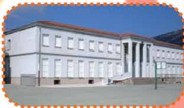
UHARTE ARAKIL: SAN MIGUEL IP

Abarrategi zg 31830 Lakuntza Tfnoa eta faxa: 948 576 020 E-maila: cplakunt@educacion.navarra.es