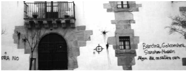
Goikoetxeatarren etxeko fatxada larunbat goizean. UTZITAKOIA