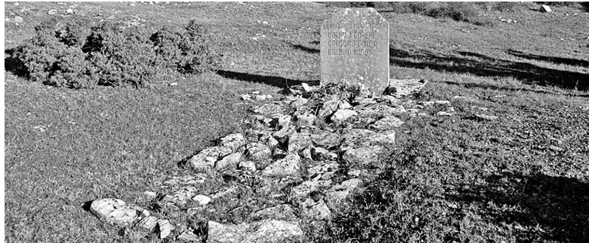
Urbasako sarioan Amekoako UGTko 3 kideren erailketa oroitarria. WWW.FOSAS.NAVARRA.ES

Mapan aipatzen diren ibarreko 10 hobietako bakarra ikertu dute. Altsasundago, N-1 errepidearen 401 km-an (egungo NA-1000), Gipuzkoako mugatik gertu. Arantzadi zientzia elkarteko kideek georadarra erabiliz errepide azpian hobia egon zitekeen aztertu zuten. Hobiaren sakontasunak eta errepidea egoteak zaildu egiten du gorpuzkinak berreskuratzea.