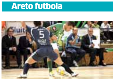
Usinek 2 gol sartu zizkion Marfili.