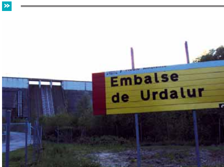
Ur sarean behin behineko konponketa egingen dute heldu den astean.