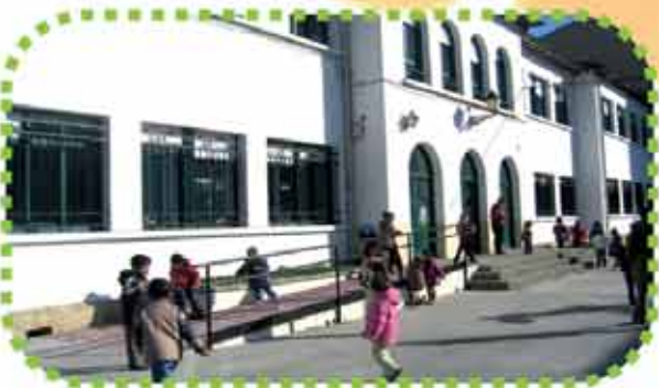
LAKUNTZA: LUIS FUENTES IP

Kale Nagusia, 1 31839 Arbizu Tfnoa: 948 460 763 E-maila: cparbizu@educacion.navarra.es www.arbizukoherrieskola.blogspot.com.es