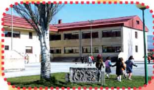
ETXARRI ARANATZ: SAN DONATO IP

Elizalde, 4 31810 Iturmendi Tfnoa eta faxa: 948 563 414 E-maila: cpiturme@educacion.navarra.es