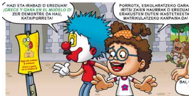
Pailazo ezagunak dira matrikulazio kanpainako irudia.

Sakanako Mank 2010 eta 2011n jaiotako haurren gurasoei zuzendu zaie, otsailaren 1etik 8ra ikastetxe-etan aurrematrikulatzeko epea iritsi baita. Mankomunitateak aipatu gurasoak euren seme-alabak D ereduan matrikula ditzaten animatu nahi dituzte "D ereduak bakkarririk bermatu baitezake euskara eta gaztelania erabat menperatzea".