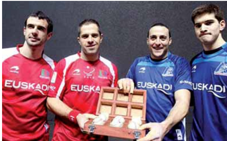
Olaizolari eta Zabalari 16-22 irabazi zieten Irujok eta Zabaletak. UTZITAKOIA