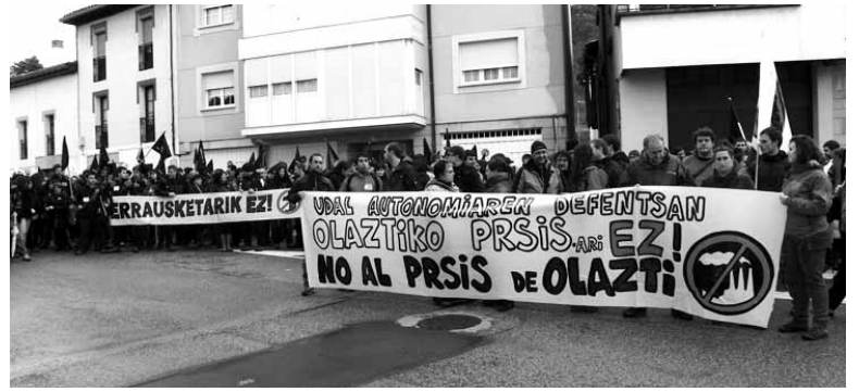
Hautetsiekin batera makina bat sakandar bildu ziren.

Nafarroako Gobernuak gizarte gehiengoaren kontra jo duela salatu dute hautetsiek. Gainera, Sakanako, Lizarraldeko, Arabako Lautadako eta Goierriko udalen gaine-