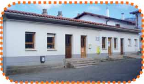
ITURMENDI: ARRANO BELTZA IP

Elizazpi 4 31810 Urdiain Tfnoa eta faxa: 948 468 345 E-maila: cpurdiai@educacion.navarra.es