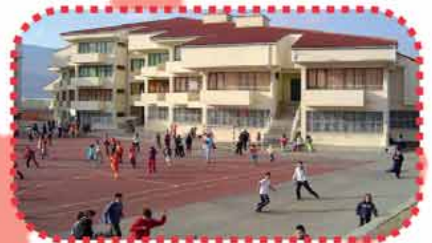
IRURTZUN: ATAKONDOA IP

San Juan Olaza zg 31840 Uharte Arakil Tfnoa.: 948 567 100 E-maila: cpuharte@educacion.navarra.es