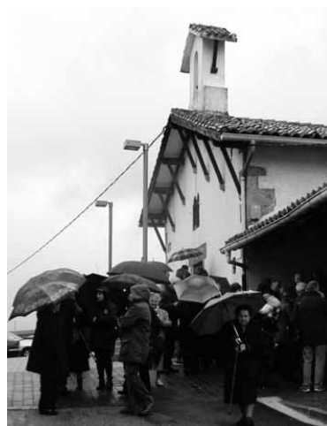
Jendea San Sebastian ermitan.