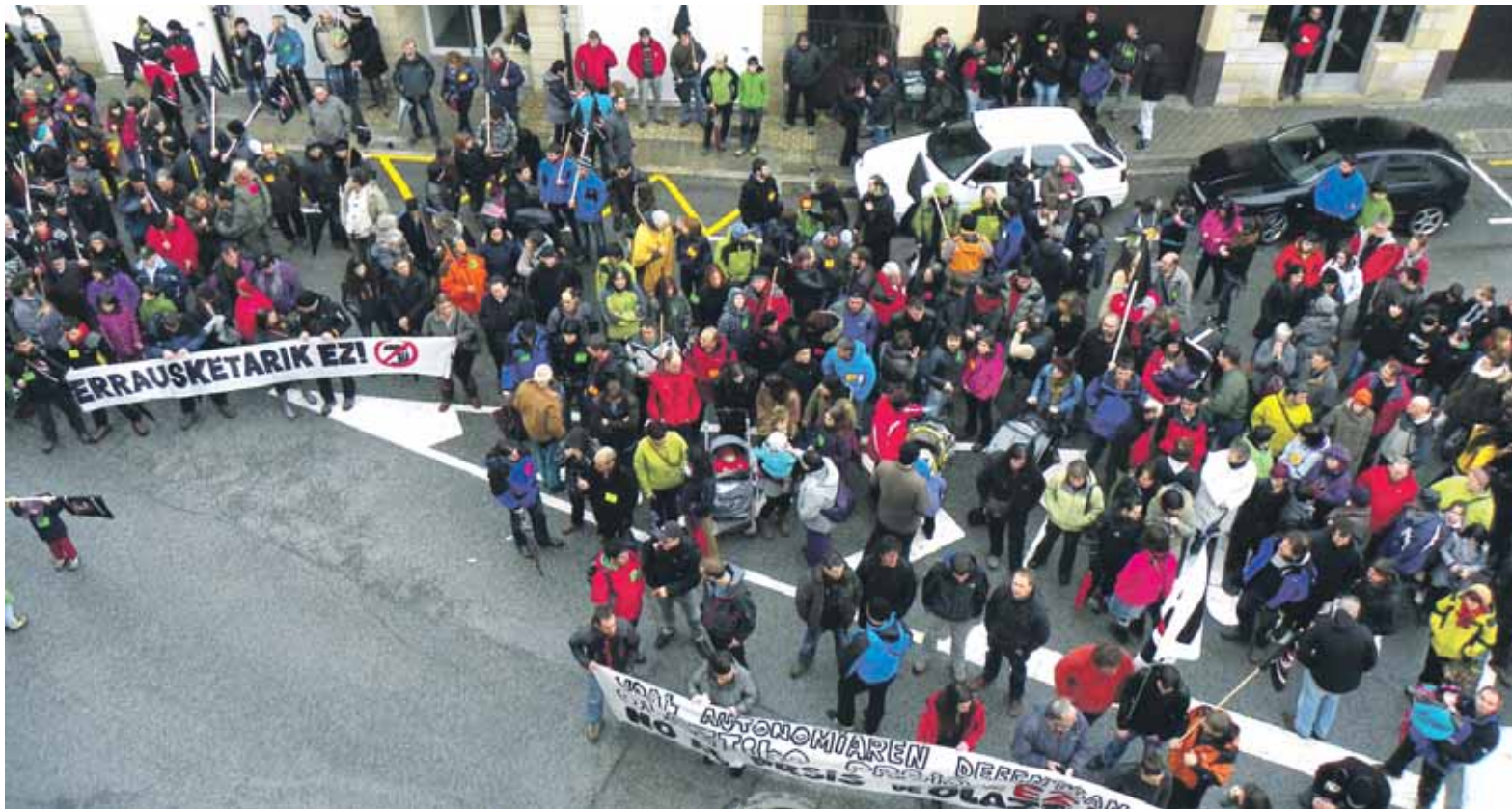
Itxialdian egon ziren hautetsiekin batera sakandarrek parte hartu zuten larunbatean Olatzagutian egindako kontzentrazioan. ERKUDEN RUIZ BARROSO