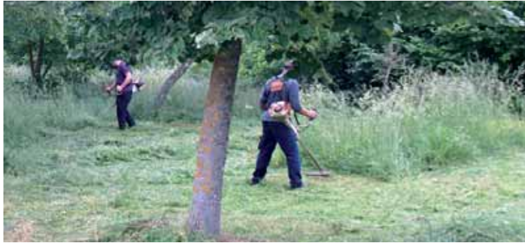
Lorezaintza lanak egiten.

Duela urte bat baino 127 gizonezko eta 74 emakumezko gehiago daude langabezian