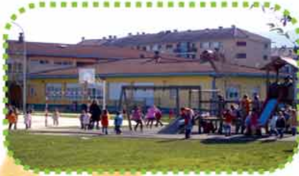
ALTSASU: ZELANDI IP

Nagusia 16 31809 Olazti Tfnoa. eta faxa: 948 563 307 E-maila: cpolazag@educacion.navarra.es