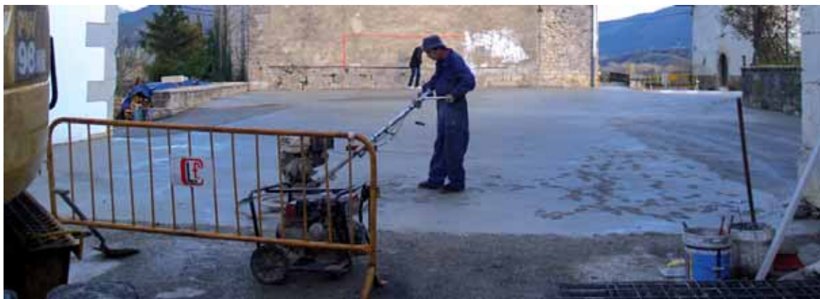
Pasa den urte akaberan Etxarrengo frontoi irekiko zorua berritu zuten.

Bestetik, Irurtzongo Udalaren batera, lan arloa suspertzeko lan ildo jarriko da martxan (langabetuen poltsa, enpresei haren berri eman, ekintzaileei mikro-kredituak eman, langabeak kontratatzen dituztenei laguntzak eta etxebizitza berritu, irisgarritasun eta energia ordenantzak). Enplegu planeko 3. ardatza prestakun-