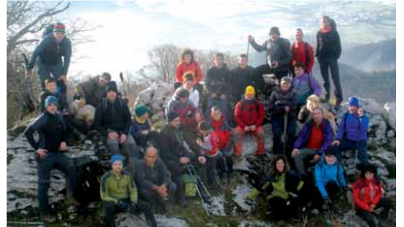
Lakuntzarrek Aralarra jo zuten, Eskuarrira eta bordetara. J. GAYA

Bestetik, Sakanako Mendizaleak taldeak deituta, Errege Egunean Beriain gainean egin zuten topo mendizaleek. Ez ziren kantutak falta izan. Altsasuko Mendigoizaleek urteko lehen igandero egin ohi dutenez, Urbasako Bargainera jo eta bertan hamaiketako hartu eta festatxo egin zuten.