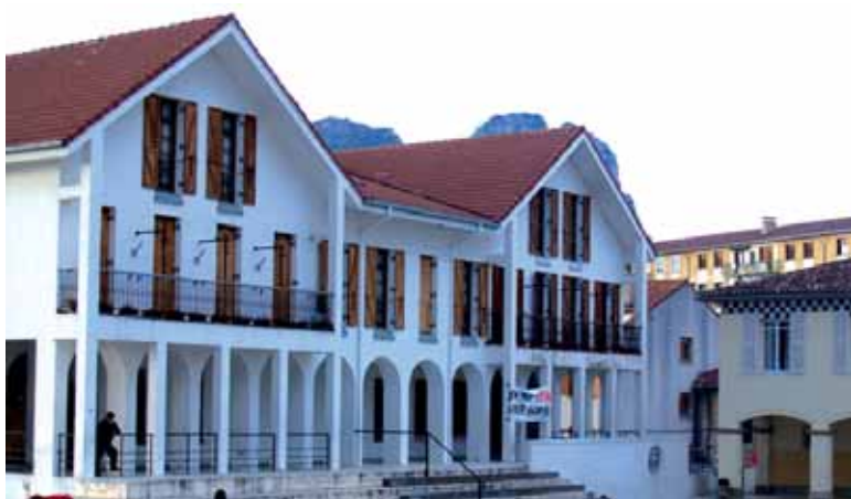
Irurtzungo eta Arakilgo udaletxeak.