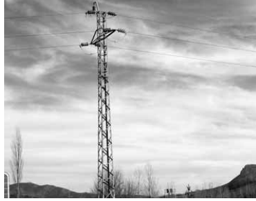
Artxueta eta Beriain artean, postea.

Energia Gara eta Goiener energia berriztagarrien kooperatibako kideak izanen dira hizlariak.