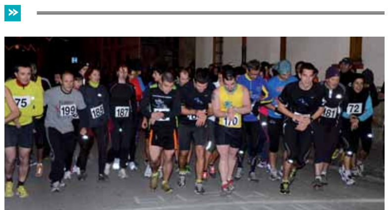
Helduen kategoriako irteera, Olaztikoko San Silbestrean.