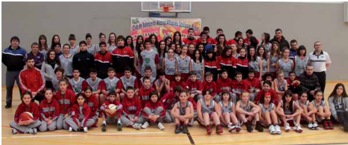
CBASKek osasun bikaina dauka. 88 jokalarik dauka taldeak. CBASK