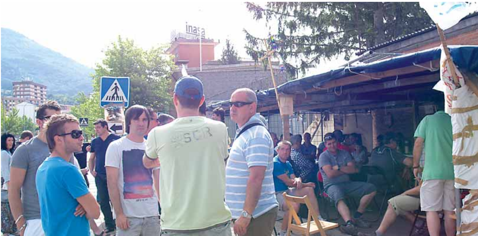
Abenduaren 28an bildu ziren langileak eta plataforma sortu zuten.