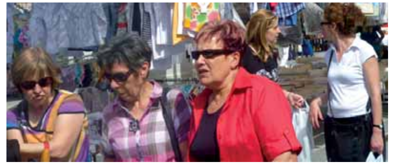
Jendea Altsasuko azokan. ARTXIBOA

Euskaraz idazten den lehenengo aldizkari irakurriena da Guai-