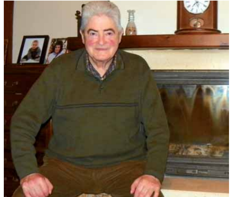
Elkarrizketa osorik www.guaixe.net-en .