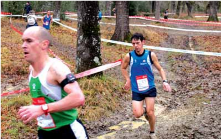
Altsasuko probak Nafarroako Beteranoen Kros Txapelketa erabakiko du.

ATLETA FEDERATUEK HARTU AHAL DUTE PARTE. 10:00ETAN NAFAR KIROL JOLASEN LASTERKETAK JOKATUKO DIRA, 12:45EAN EMAKUMEEN KROSA (5.750 M) ETA 13:15EAN GIZONEZKOENA (7.490 M)