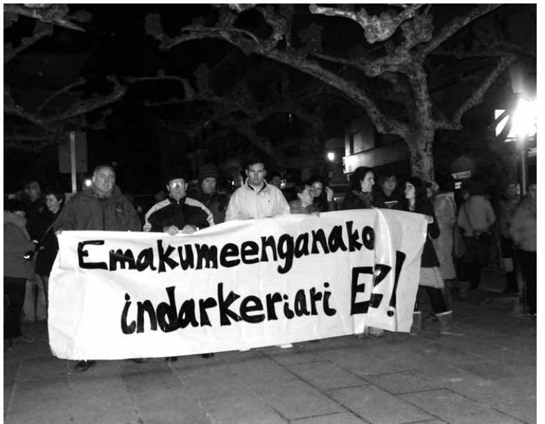
Ehundik gora etxarriar eta udalean ordezkaturako 3 alderdietako ordezkariak izan ziren bilkuran. ERKUDEN RUIZ BARROSO