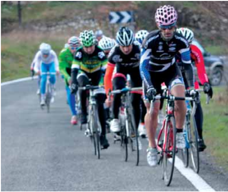
Patxi Zia tropeletik tiraka Urbasan gora. UTZITAKOIA

Bukaeran txirrindulari guztiak oroigarria jaso zuten SDAren egoitzan. Bertan egin zen sari ematea.