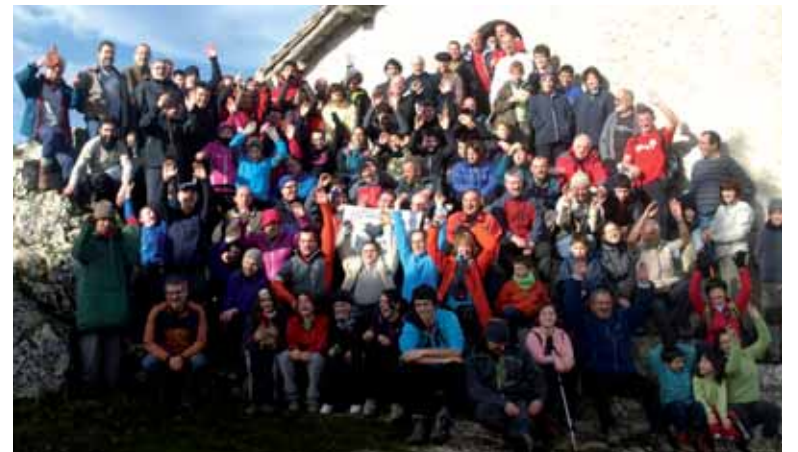
Erga Trinitatean despeditu zuten urtea irurtzundarrek. URKO