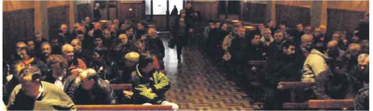
Pasa den urteko agorrilean utzi zioten lanera joateari Inasako 168 langileek.

Pentsio plana defendatzeko helburuz ere ariko dira langileak, Carrionek azaldu digunez. Inasakoa 3 urtero balioa handitzen da. Langile guztiei eragiten die, baita aurretik atera zirenei ere. Izan ere, Baikap enpresaren asmoa da diru