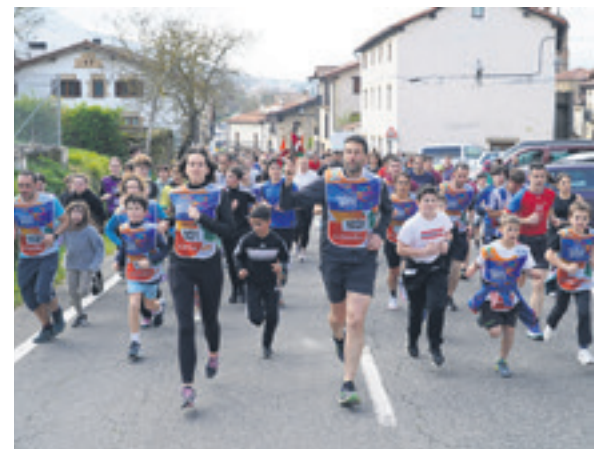
1031. lekuko hartzea: Bakaikuko elkartea.