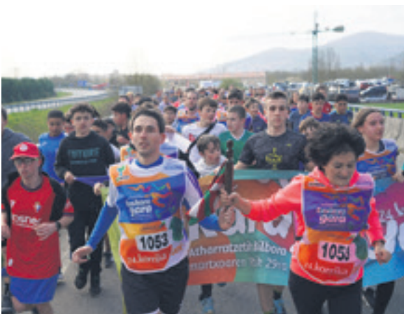
1053. lekuko hartzea: Lakuntzako Pertza elkarte.