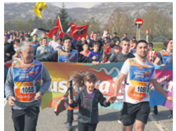
1055. lekuko hartzea: Aldabide elkarte.