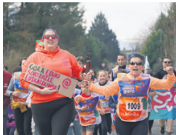
1009. lekuko hartzea: LH IIP Sakana.