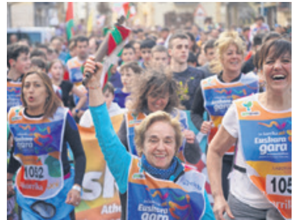
1052. lekuko hartzea: Lakuntzako Udala.