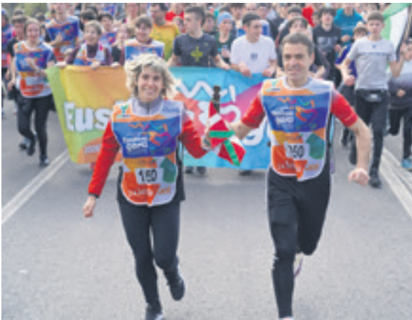
1050. lekuko hartzea: Sakana Koop.