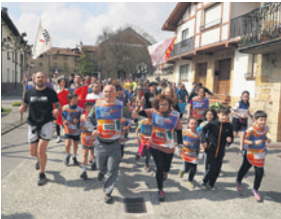
1002. lekuko hartzea: Ziordiko Udala.