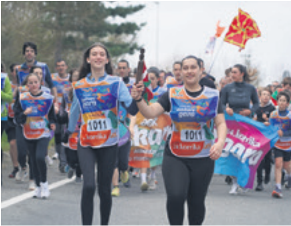
1011. lekuko hartzea: Altsasuko BHI institutua.