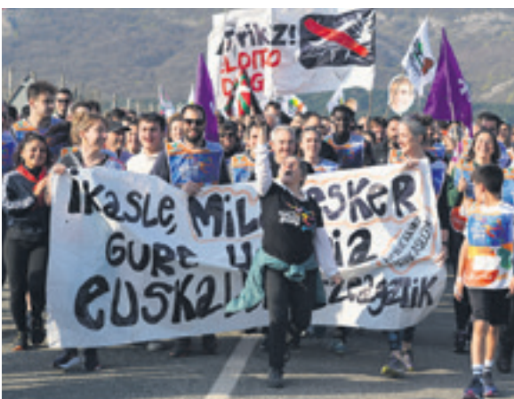
1077. lekuko hartzea: Iruñerriko AEK.