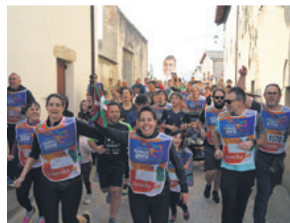
1070. lekuko hartzea: Txeparrak.