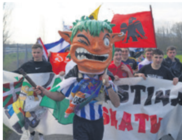
1054. lekuko hartzea: Biltokiko gazteak.