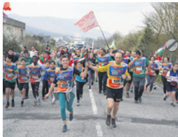
1006. lekuko hartzea: Olatzagutiko Udala.