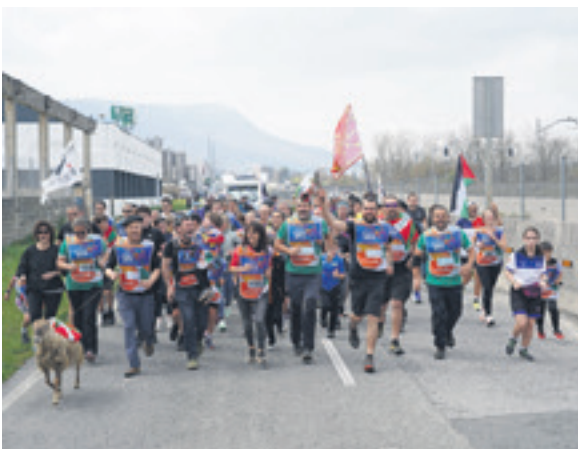
1005. lekuko hartzea: Euskal ardi moztailen elkarte.