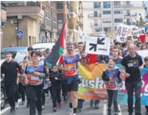
1038. lekuko hartzea: Etxarri Aranazko Udala.