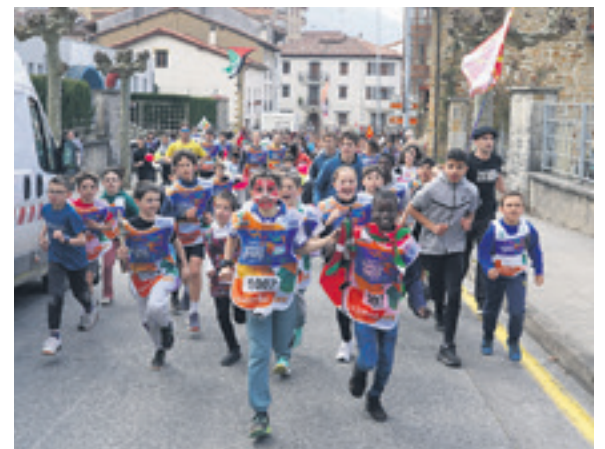
1007. lekuko hartzea: Maisuenea gaztetxea, Olatzagutiko eskola eta Ithoetak.