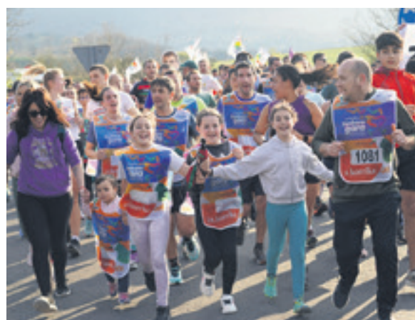
1081. lekuko hartzea: Hydroko langileak.