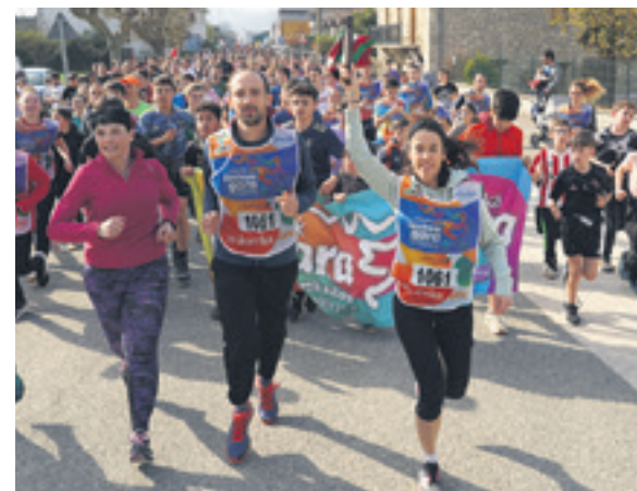
1061. lekuko hartzea: Uharte Arakilgo Udala.