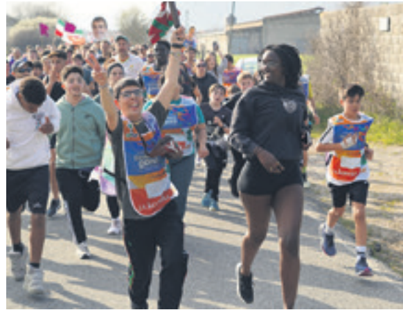
1072. lekuko hartzea: Ilundain fundazioa.