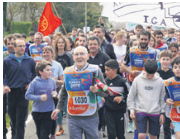
1030. lekuko hartzea: Bakaikuko Udala.