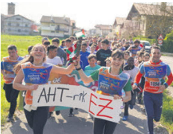
1056. lekuko hartzea: Arruazu.