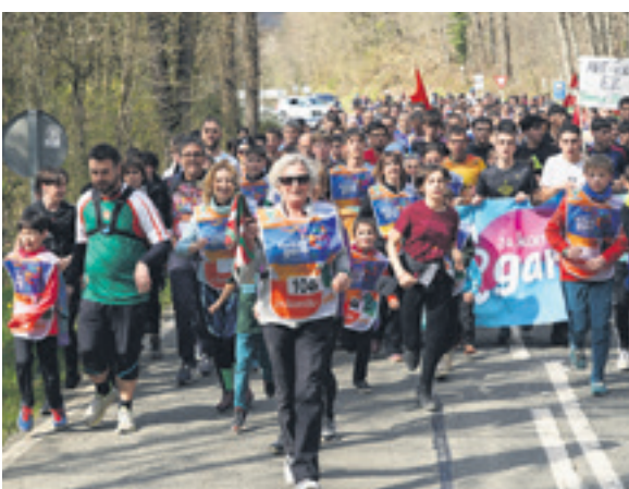
1044. lekuko hartzea: Lizarragatarrak.