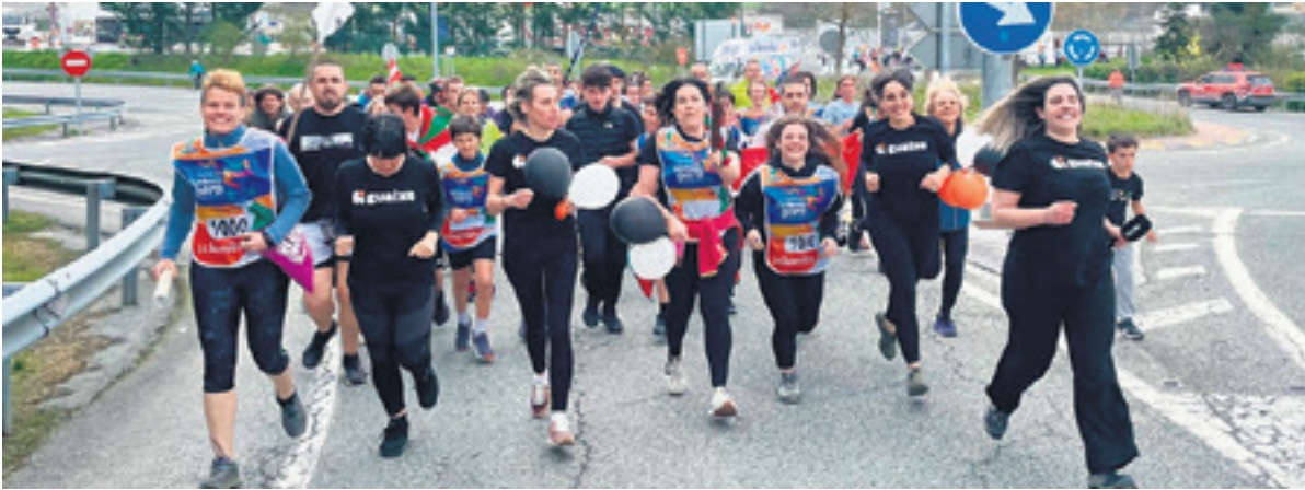
1000. lekuko hartzea: Guaixe fundazioa.