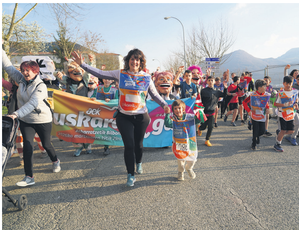
1086. lekuko hartzea: Atakondoa ikastetxeko eskola komunitatea.