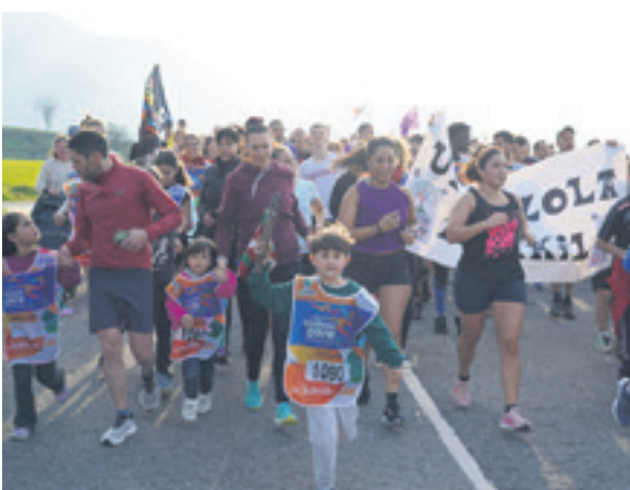
1080. lekuko hartzea: Urritzolako herria eta Urritzolako kontzejua.