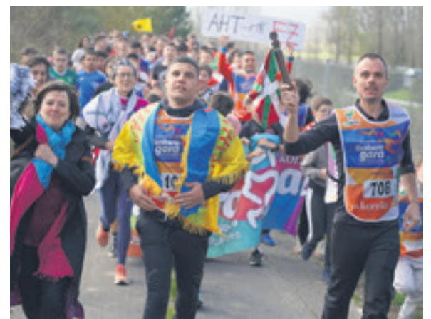
1058. lekuko hartzea: Sakanako Mankomunitatea.