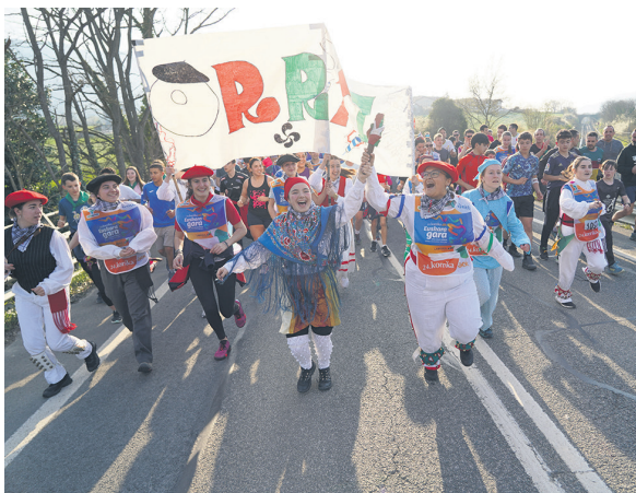
1083. lekuko hartzea: Orritz dantza taldea.