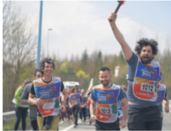
1012. lekuko hartzea: Mekalsako langileak.