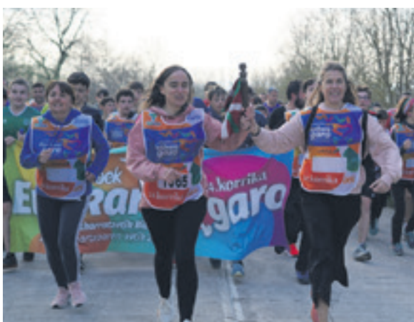
1065. lekuko hartzea: Emun Koop. E.