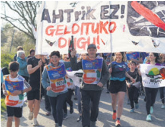
1074. lekuko hartzea: Hiriberriko kontzejua eta Txitera elkarte.