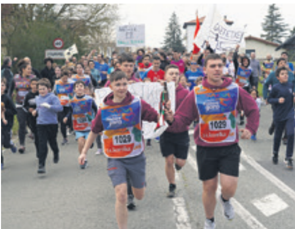
1029. lekuko hartzea: Bakaikuko Gazte Asanblada.