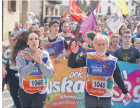
1048. lekuko hartzea: Arbizuko Udala.