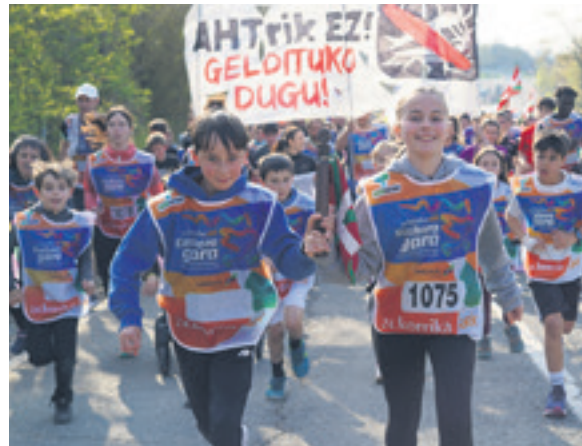
1075. lekuko hartzea: Aresoko eragileak.