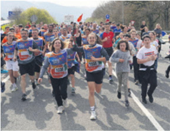
1035. lekuko hartzea: Karriestu elkarte.