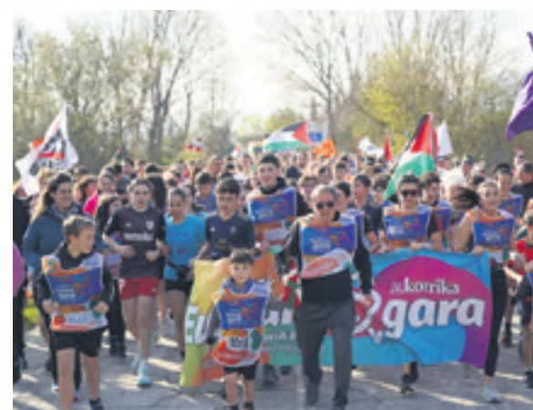
1067. lekuko hartzea: Irañetako euskara taldea.