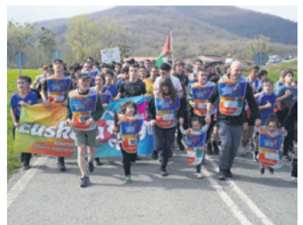
1046. lekuko hartzea: Lizarragabengoako kontzejua eta Bordatxo elkarte.