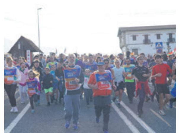
1082. lekuko hartzea: Etxarrengo kontzejua.