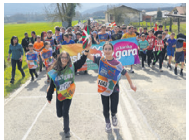
1043. lekuko hartzea: Jeingenekoa.