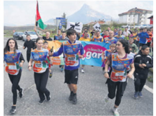
1037. lekuko hartzea: Andra Mari ikastolako ikasleak.