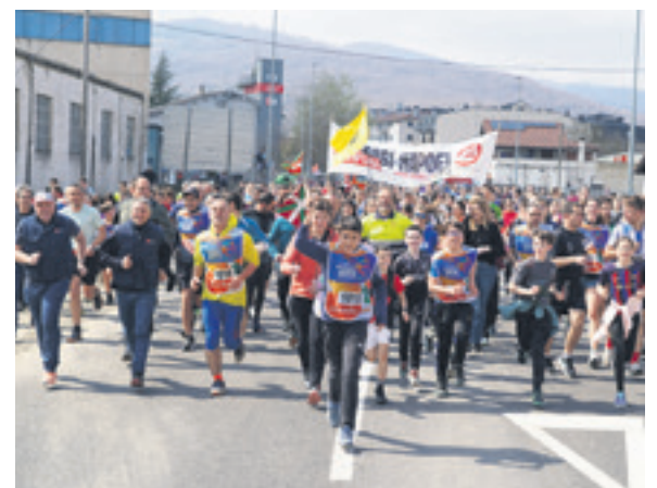
1019. lekuko hartzea: Ramoseko langileak.