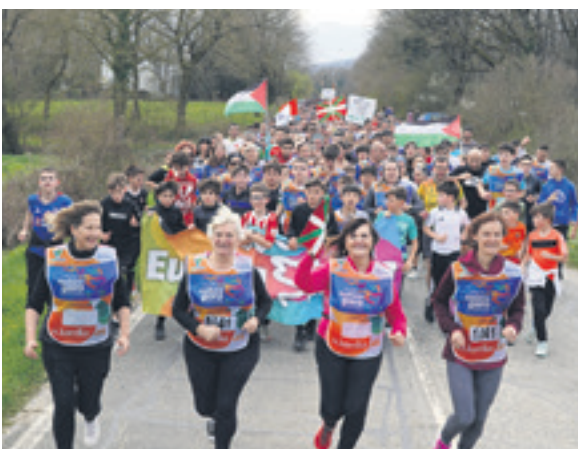
1041. lekuko hartzea: Andra Mari ikastolako langileak.