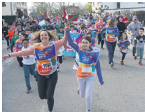
1060. lekuko hartzea: Uharte Arakilgo Herri eskola eta Aralar mendi elkarte.