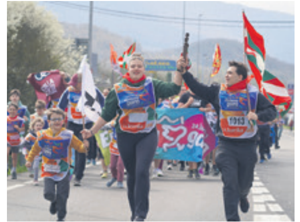
1013. lekuko hartzea: Kukuerreka elkartea.