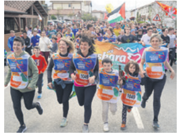
1049. lekuko hartzea: Arbizuko Herri eskola.