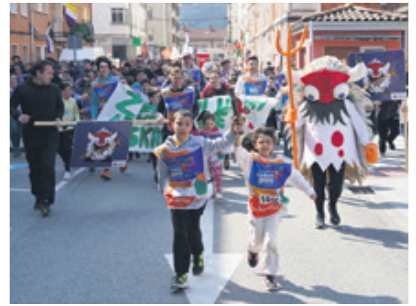
1016. lekuko hartzea: Zelandi eskola publikoa.