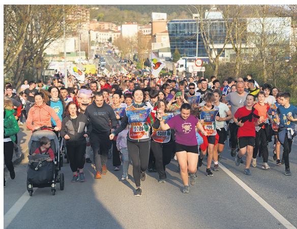
1089. lekuko hartzea: Etxeberriko Kontzejua.