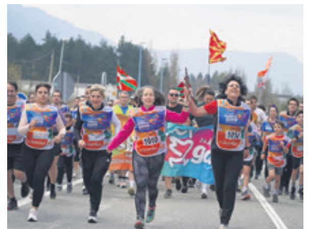
1010. lekuko hartzea: Copreciko langileak.