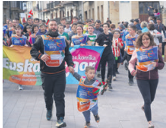
1051. lekuko hartzea: Lakuntzako Herri eskola.