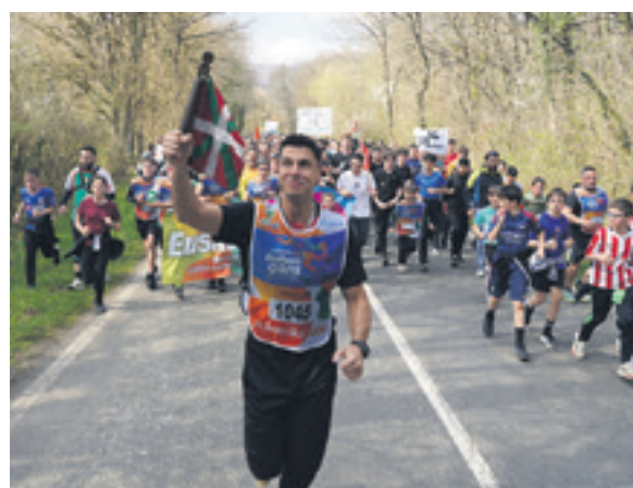
1045. lekuko hartzea: ZETAK.