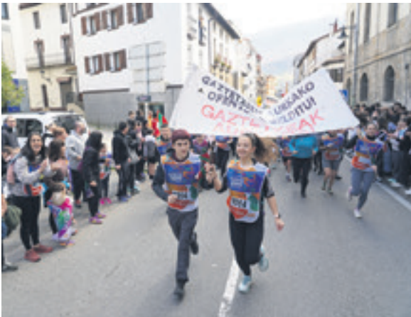
1014. lekuko hartzea: Altsasuko gaztetea.