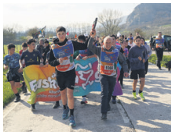
1066. lekuko hartzea: Irañetako Udala.