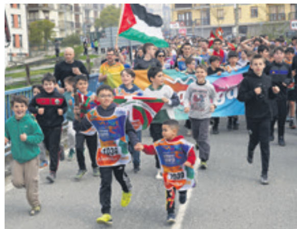
1039. lekuko hartzea: San Donato eskola.