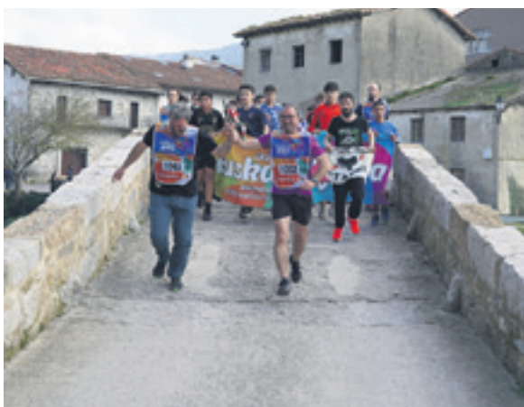
1062. lekuko hartzea: Magotteaux Navarra SA.