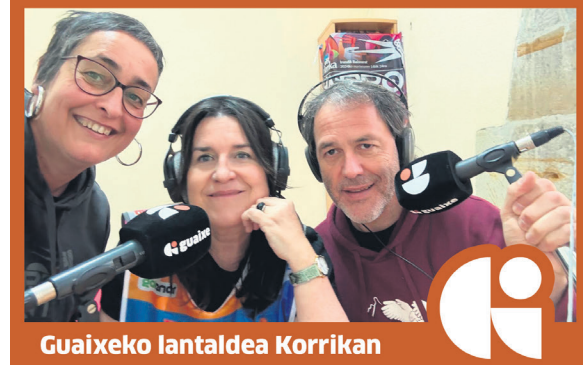
Guaixeko lantaldea Korrikan