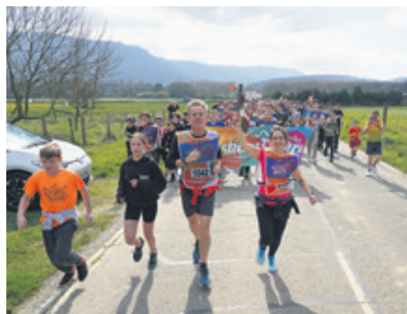
1042. lekuko hartzea: Andra Mari ikastola.