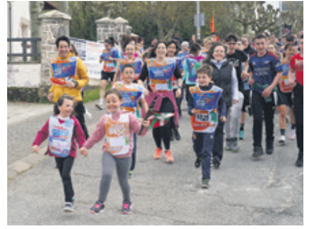
1025. lekuko hartzea: Urdiaingo Herri eskola.