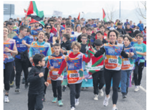
1040. lekuko hartzea: Larrañeta elkarte