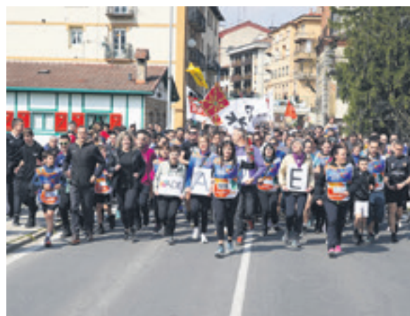
1018. lekuko hartzea: Altsasuko Dendari elkartea.