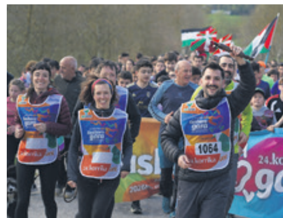
1064. lekuko hartzea: Txalaparta argitaletxea.