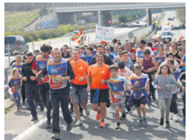
1034. lekuko hartzea: Eseki.