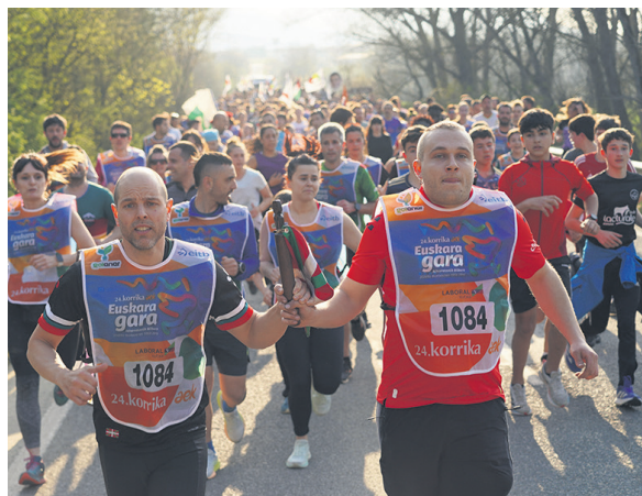
1084. lekuko hartzea: Iratxo elkarte.