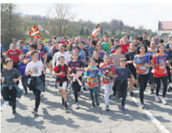
1020. lekuko hartzea: Unamuno pentsuak.