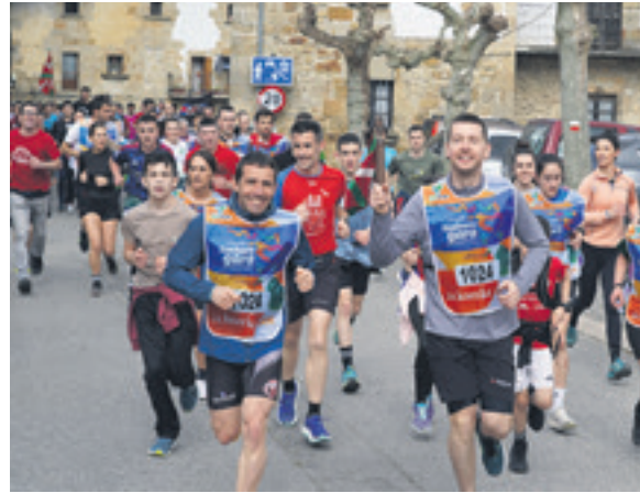
1024. lekuko hartzea: Urdiaingo Udala.