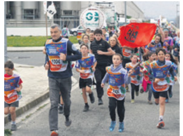
1004. lekuko hartzea: Gerra anaiak enpresa.