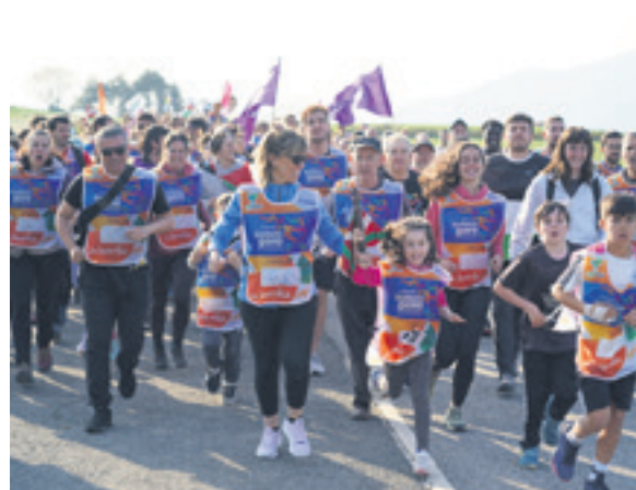
1078. lekuko hartzea: Ochoa de Olza institutuko langileak.