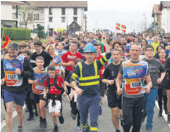
1026. lekuko hartzea: Magotteauxeko langileak.