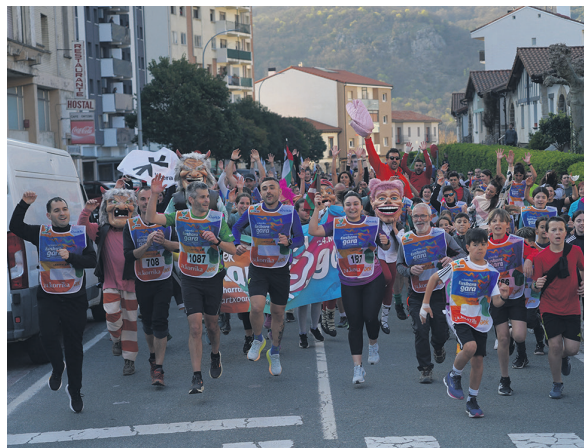
1087. lekuko hartzea: Irurtzungo Udala.