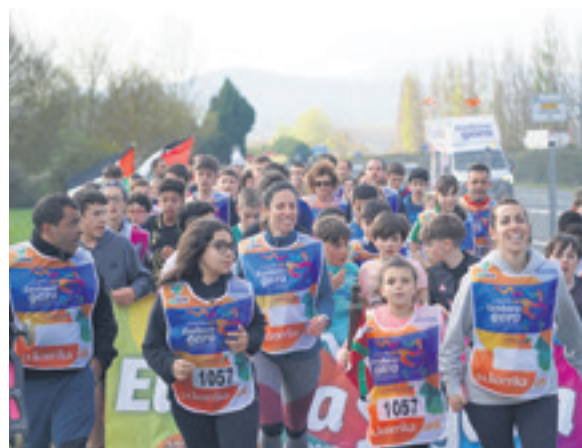
1057. lekuko hartzea: Poke gaztak.