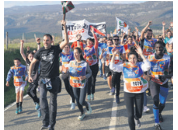
1076. lekuko hartzea: Aresoko Udala.