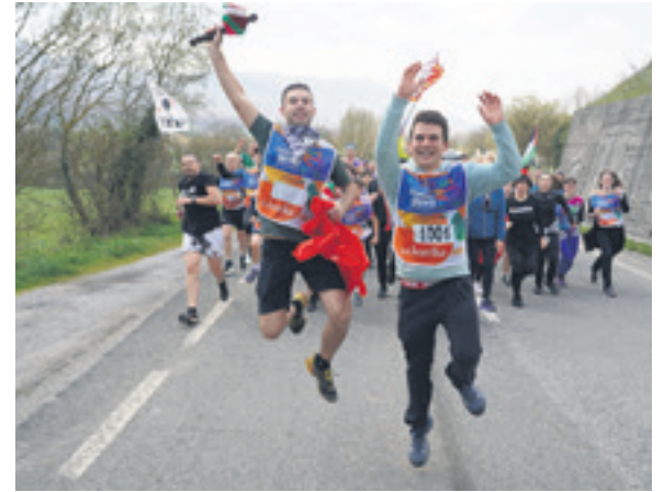
1001. lekuko hartzea: Ziordiko elkarte eta Gazte Asanblada.