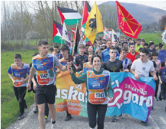
1047. lekuko hartzea: Arbizuko Gazte Asanblada.