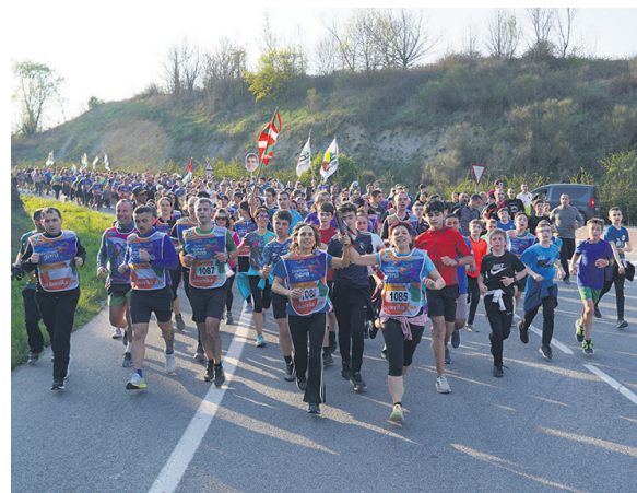
1085. lekuko hartzea: Aizpea .