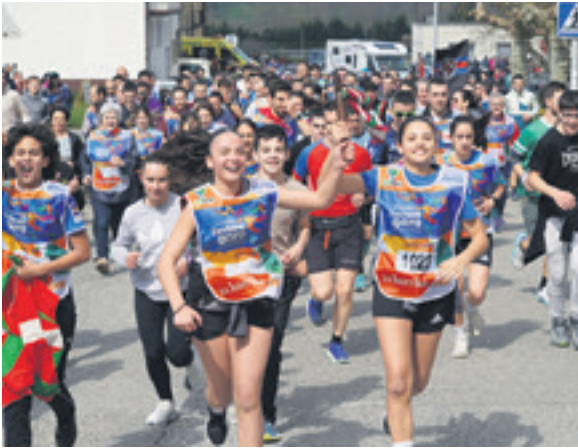
1023. lekuko hartzea: Urdiaindarrak.