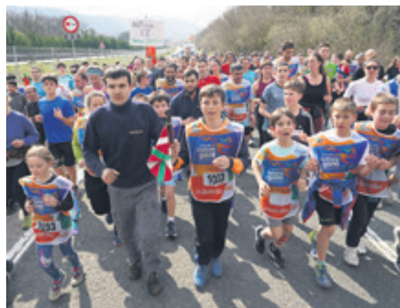
1033. lekuko hartzea: Bikain garajea.