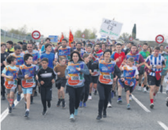
1032. lekuko hartzea: Gerra Anaiak.