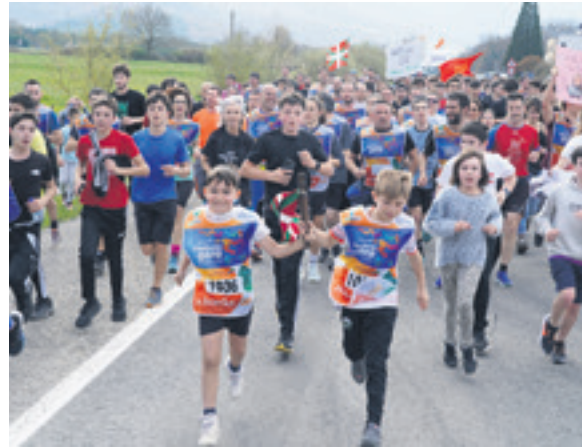
1036. lekuko hartzea: Hartzabal elkarte.