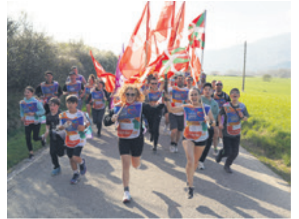
1073. lekuko hartzea: Nafarroako LABeko langileak.