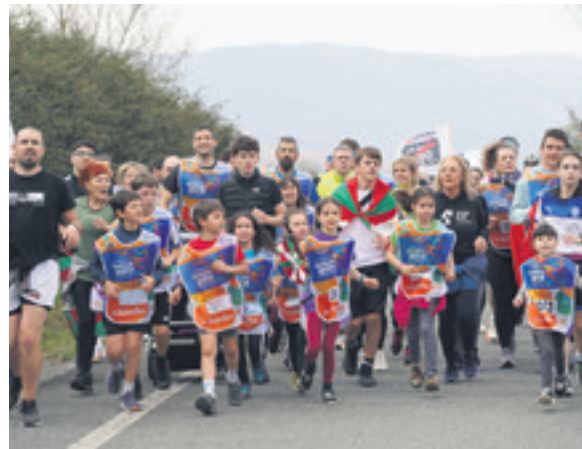
1003. lekuko hartzea: Amarauna.