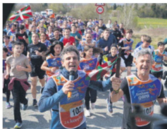
1021. lekuko hartzea: Gozategi taldea.