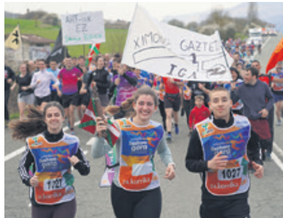
1027. lekuko hartzea: Iturmendiko Udala.