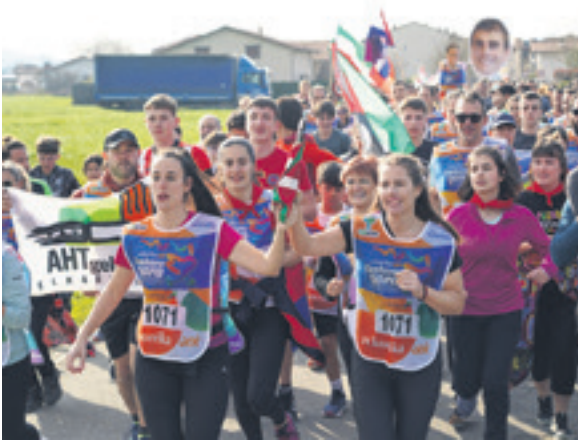
1071. lekuko hartzea: Ihabarko kontzejua.