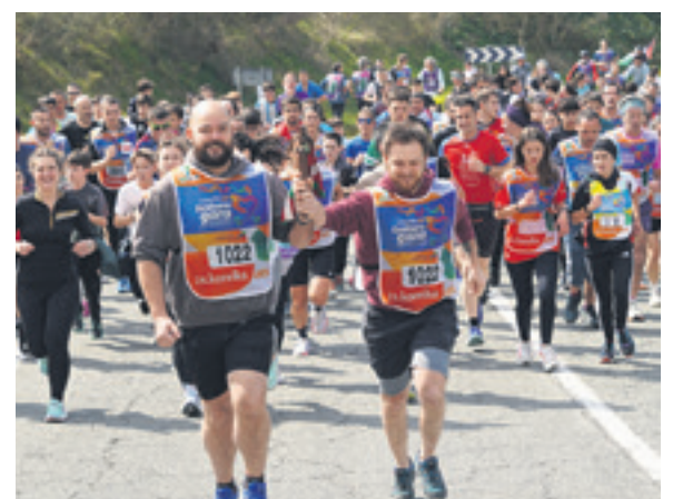
1022. lekuko hartzea: Aitziber eta Tintinurri elkarteak.