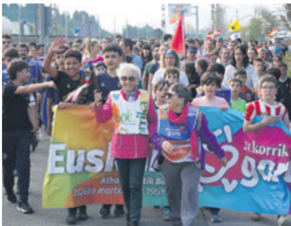
1059. lekuko hartzea: Ochoak.