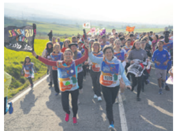
1079. lekuko hartzea: San Fermin ikastolako langileak.