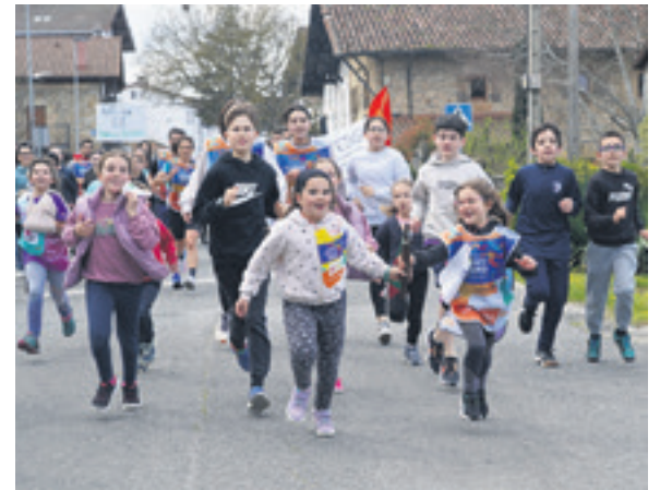
1028. lekuko hartzea: Iturmendiko elkarteak, eskola eta Gazte Asanblada.