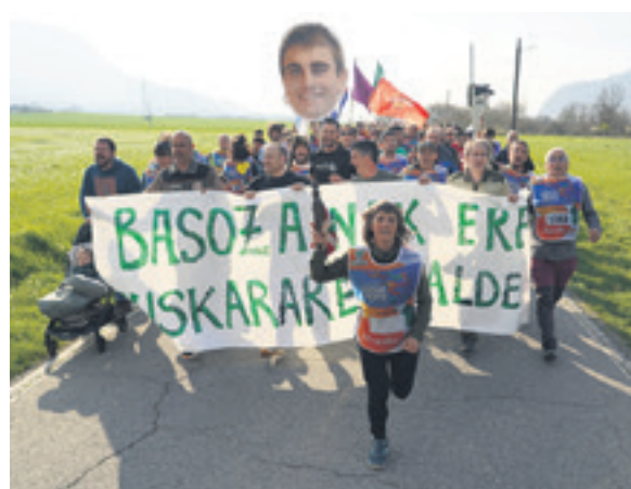
1069. lekuko hartzea: Nafarroako basozainak.