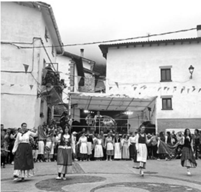
LIZARRAGA Zortzikoa dantzatu zuten plazan.