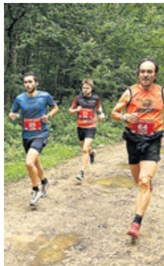
Korrikalariak, iazko edizioan.

Etxarri Aranazko kanpina irteera eta helmuga izanda, inguruko parajeetan Triku Trailek