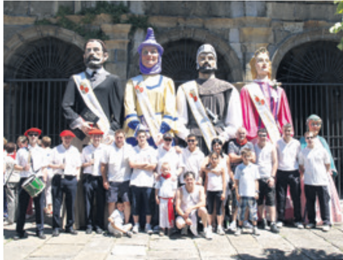
Konpartsaren 2011ko talde argazkia.