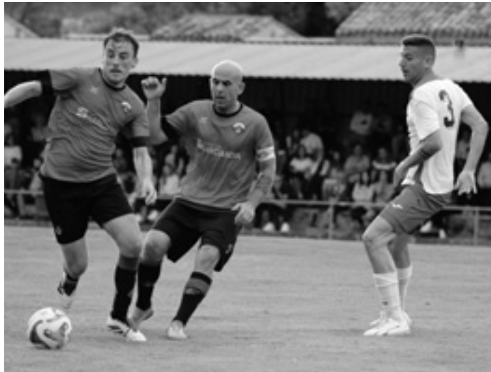
Igandean jende asko bildu zen San Donaton jokaturako joaneko partidari. ETXARRI K.E.

Joaneko partida San Donato zelaietan jokatu zuten bi taldeek