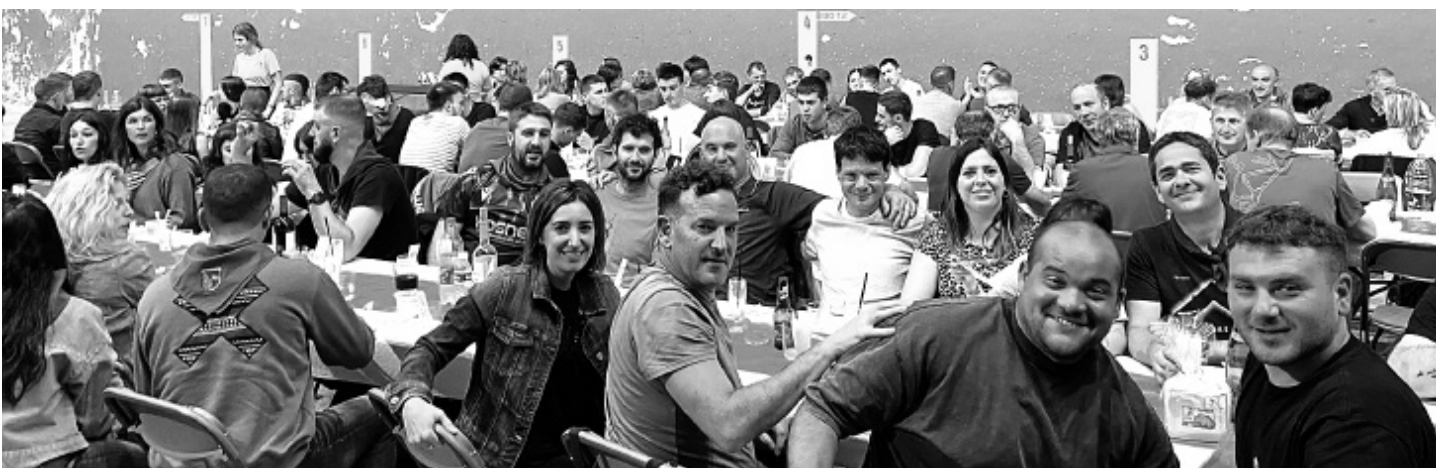
LIZARRAGA Herri afarian majo pasa zuten lizerratarrek. UTZITAKOIA