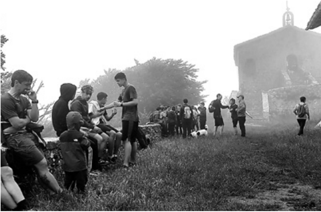
IRURTZUN Ergako Trinitatera igo ondoren gosaltzen. UTZITAKOIA