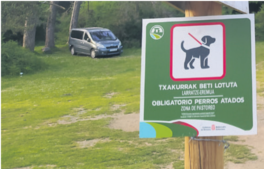
Urbasa-Andiako aparkaleku batean jarritako kartela.