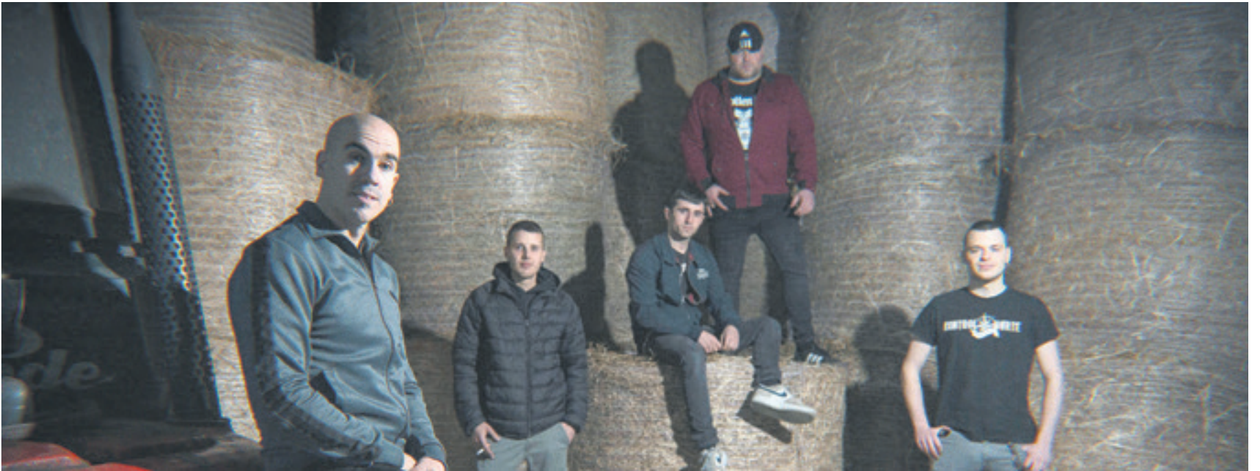
Askazi taldeko kideak.