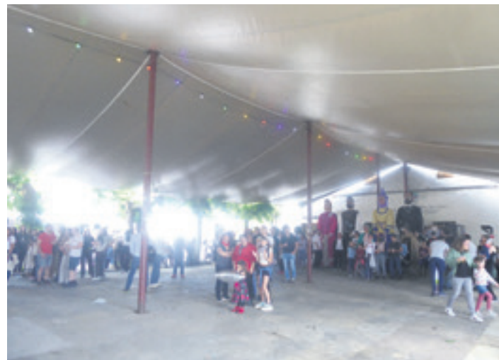
UHARTE ARAKIL Erraldoi eta buruhandien konpartsa izanen da protagonista.

19:30 Herrietxetik San Juan ermitara kalejira, txistulariekin,