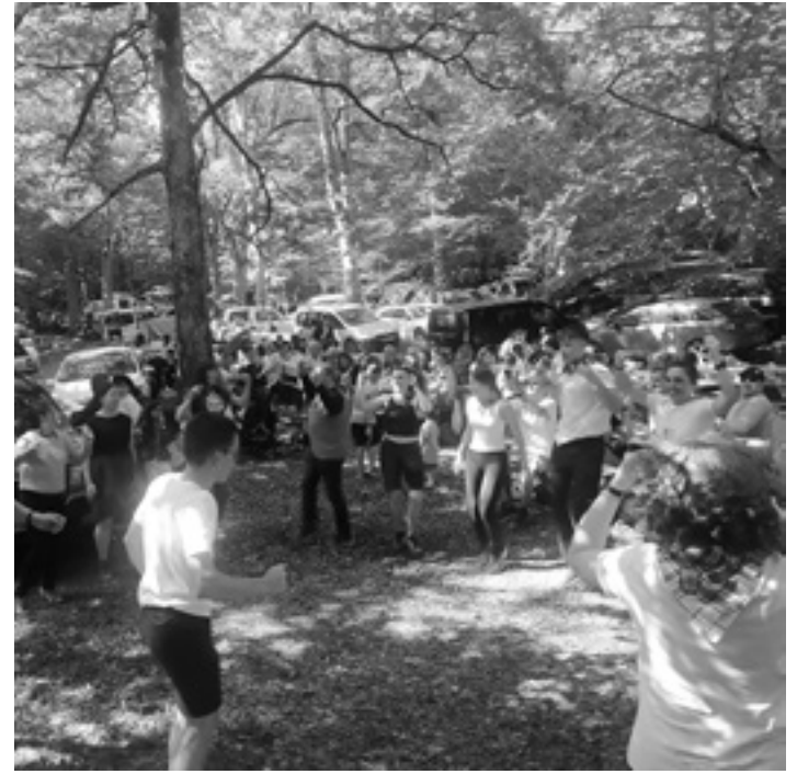
ETXARRI ARANATZ Bazkaldu ondorengo lehen dantzak.