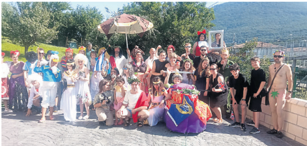
Izurdiagarrik etxez etxeko errondan ibiltzeko mozorrotu egiten dira.

Izurdiagako festen egitarauaren barruan falta ezin dena etxez etxeko erronda da. Berezitasuna da mozorrotuta egiten dutela. Neguan ihoterik ospatzen ez dutenez, herriko inauteriak larunbatekoak izanen dira