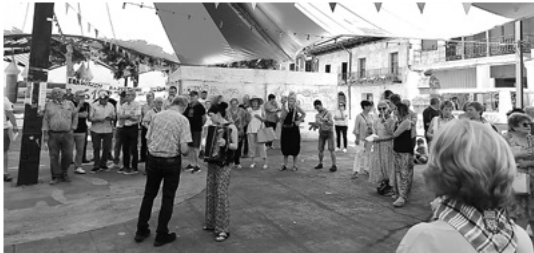
ARBIZU San Juan bezperan, ekainaren 23an, hasiko dira Arbizuko festak.

11:00 Herriko puzgarriak. 12:00 Meza nagusia. 12:30 Herri gosaria, udalak eskainia. 13:00 Eingo taldea: Kantan eta dantzan.