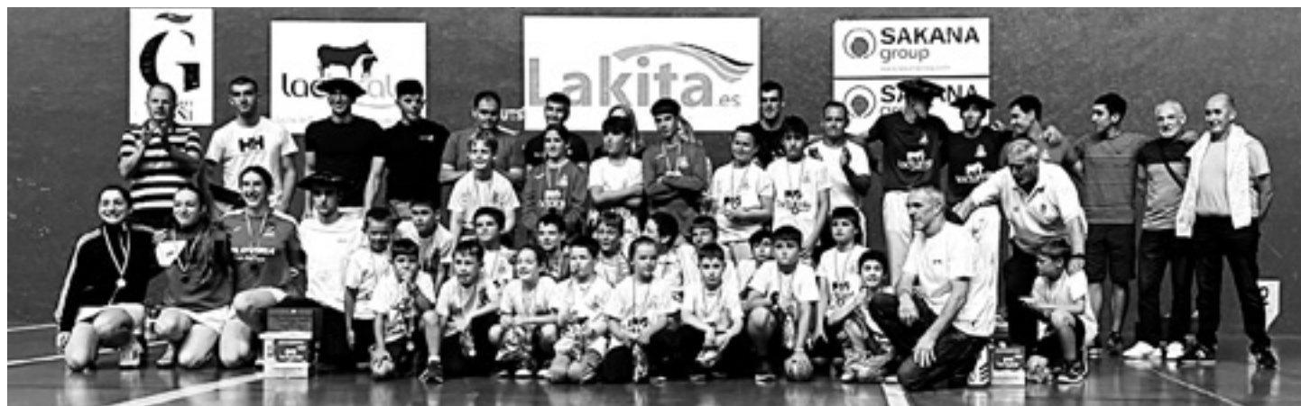
IRURTZUN PILOTA KLUBA

San Fermin Torneoko Urrezko Liga azken txanpan sartu da. Ekainaren 24an lehen faseko lau bikoterik onenak Arbizun neur-tuko dituzte indarrak 18:00etatik aurrera hasiko den jaialdian. Lehenik eta behin Aldai-Bergarak Salsamendi-Mendizabal izango dituzte arerio, eta bigarrenik Etxegarai-Gamindek Zabaleta-Erasun.