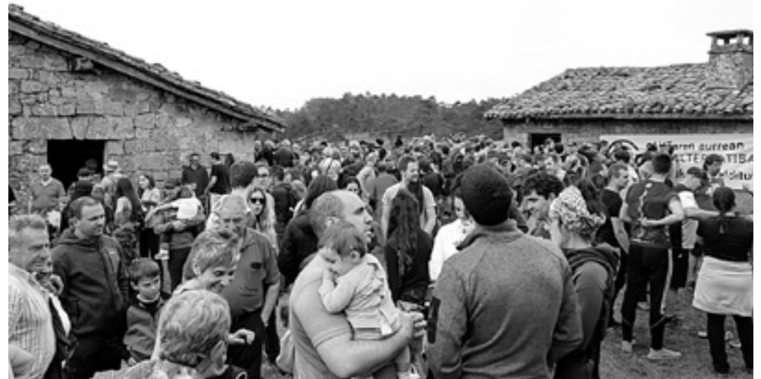
BAKAIKU-ITURMENDI Santa Marinako plaza bakaikuar eta iturmendarren topaleku izan zen.