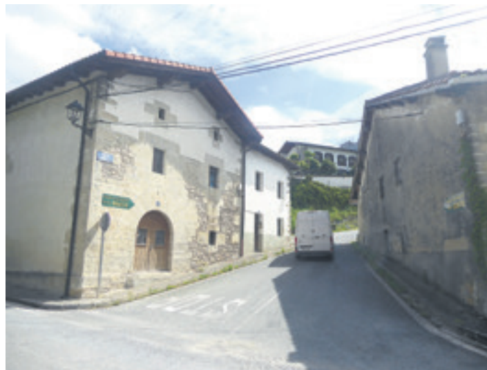
Ezkerrean berritzen ari diren etxea. Furgoneta kalea estutzen zen tokian.

Arakilgo Udalak ibarrerako Lehenasunezko Birgaitze Eremu izendapena lortu zuen 2022an. Nafarroako Gobernuaren izendapen horrek etxebizitzak zaharberitu behar dituzten arakildarrek eta kontzejuek foru administrazioetik dirulaguntza handiagoa lor dezakete. Arakilek jasotako izendapen hori baliatuta, Errozko Kontzejua Nafarroako Gobernuari eskatu zion Esku-hartze Publikoko Proiektu bat garatzea. Haren bidez, Errozko Kontzejua bi etxebizitzak egiteko dirulaguntza eskuratu nahi zuen. Legearen arabera aurrekontuaren %60ra arteko dirulaguntza jaso daiteke. Nafa-