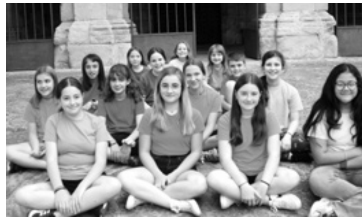
Etxarri Aranazko Abesbatza Txikiaren kideak. UTZITAKOIA

Bestetik, Abesbatza Txikia datorren ikasturtean izen emateko epea zabalik dago, eta horretarako abesbatzak sareetan jarri duen helbidean dagoen galdetegia bete behar da. Abesbatza Txikia 6 eta 15 urte bitarteko haur eta gazteendako da. Entseguak astean behin izaten dira, ostiraletan, eta ordu bateko iraupena izatne dute. corotxikis@gmail.com helbidera informazio gehiago eska daiteke. Gaur egun hamasei gaztetxok parte hartzen dute.