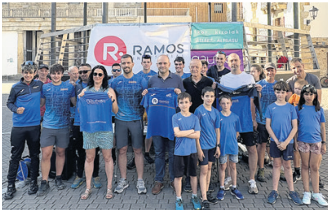
Dantzaleku Sakana Atletismo klubeko juntako kideek, babesleek eta korrikalariak talde argazkia egin zuten.